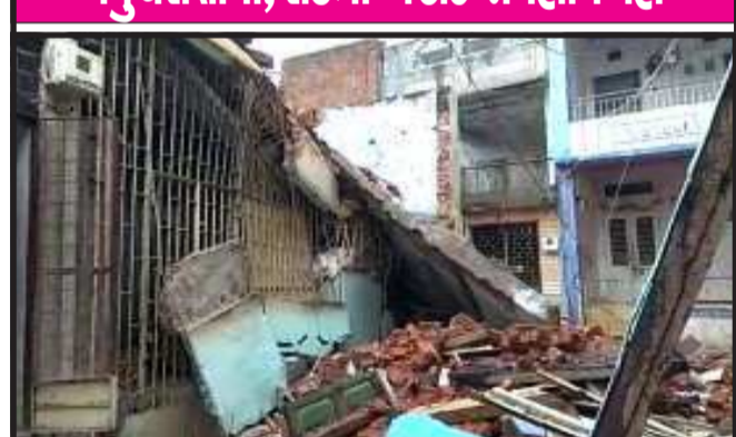
તસ્વીર : ગોધરા શહેરમાં ગતરોજ સમી સંજે તેમજ મોડી રાતે ભારે વરસાદી ઝાપટા પડ્યા હતા. જેને લઈને ગોધરા શહેરમાં ઢેકેઢાણે પાણી ભરાયાં હતાં. ગોધરા શહેરમાં ગત રાજે એક કલાકમાં એક ઈંચ જેટલો વરસાદ ખાબક્યો હતો, ત્યારે વરસાદને લઈને ગોધરા શહેરના મકનકુવા વિસ્તારમાં આવેલા

કોઠારીવાડમાં આવેલું એક ખૂનું અને જર્જરીત મકાન ધરાશયી થઈ ગયું હતું. સદભાગ્યે આ મકાનમાં કોઈ રહેલું ન હોવાથી સમગ્ર બનાવમાં કોઈ જાનહાનિ થવા પામી ન હતી. આ ઘટનાને પગલે આસપાસના વિસ્તારના લોકો ઠોડી આવ્યા હતા. હાલ આ મકાનમાં કાટમાળને ખસેડવાની તજવીજ હાથ ધરવામાં આવી હતી.