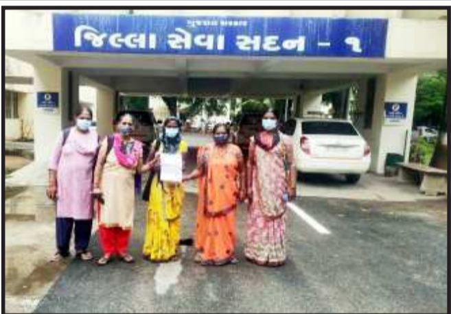
અને મહિલા સંગઠનો તરીકે કાયદા અને ન્યાયી વ્યવસ્થામાં અમારો શ્રિવાસ વધે છે. મહિલાઓ પર અગત્યચાર, તેમને નિર્વસ્ત્ર કરી ગામમાં ફેરવી, તેમના માથાં નાં વાળ બળજબરી પૂર્વક ઉતારવા, પુરૂષો ને મહિલાના ખભે બેસાડી તેમને ગામમાં ફેરવી, ઝાડ સાથે બાંધી જાહેરમાં લોકો દ્વારા મારપીટ, ગાળો આપી અપમાનિત કરવા, મહિલાની ઈર્ષ્યા વિરૂદ્ધ સમાજ નાં કહેવાતા આગેવાનોની મરજી મુજબના સ્થળે રહેવાનું સ્વીકારી

સમાજ અને દેશ તરીકે આપણે દાવો કરીએ છીએ. દાહોદ અને પંચમહાલ નાં સમાજ નાં પ્રેમના નામે શંકા- કુશંકા ના આધારે ગુંડા-ગર્દી પણ જનક બર્બર હરકતો, યુપક અને યુપતીઓ ની હત્યા કરી તેને અકસ્માત ગણાવી આ વેદના બનાવો બની રહ્યાં છે. આઝાદીના આ ૭૫ વર્ષ નિમિત્તે તેનું અમૃત મહોત્સવ જાણે આ બનાવો વચ્ચે આપણે મનાવી રહ્યાં છીએ તેવું દેખાય છે. મહિલાઓ પર હિંસા. તેમની સાથે ભેદભાવ કરવા મહિલાના રક્ષણ માટે રાષ્ટ્રીય અને આંતરરાષ્ટ્રીય કાયદા અને નીતિ વ્યવસ્થા અમલમાં છે. સતત વિકાસના ઉદ્દેશ્ય મુજબ જેન્ડર સમાનતા અને સમાન અવસર સાથે મહિલાઓને સંરક્ષણ ને પ્રાધાન્યતા અપાઈ છે છે પણ તેમના અમલ અને આ નીતિઓ નું સામાજિક વ્યવહાર સાથે જોડાણ જોવા મળતો નથી. અને તેના ભંગ સામે યોગ્ય કાનૂની કાર્યવાહી નો અભાવ જોવા મળે છે. એક તરફ સમાજના પંચ અને બીજી તરફ પોલીસ તંત્ર અને કાનૂની વ્યવસ્થાની આંટી ઘૂંટી માં મહિલાઓ અટવાઈ છે. આ તમામ ગુન્હાઓમાં મહિલા હિંસા અને મારપીટ બાબતે કાયદાકીય કાર્યવાહી સાથે સંઘર્ષજીવી મહિલા નાં સ્વપ્નના, તેને વેઠવી પડતા ઘૂણા, બહિષ્કાર માટે શું ? અપમાન અને તિરસ્કાર અને ઘર થી બહાર નીકળવું મુશ્કેલ થઈ પડે છે તેનું શું . આ અને આવા પ્રશ્નો પર પણ સકારાત્મક વાતાવરણ બને અને કાર્યવાહી થાય તે જરૂરી છે.