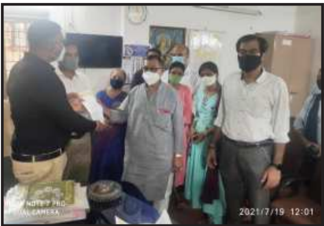
અને ટ્રાવેલ્સ બસો સહિત તમામ વાણિજ્ય વ્યવસાયોને કોવિડ ગાઈડ લાઈન અનુસાર ખોલવાની મંજૂરી આપવામાં આવી છે. પરંતુ ખાનગી શાળાઓના વાલીઓ, શિક્ષકો, વિદ્યાર્થીઓ અને સંચાલકો લાંબા સમય થી શાળાઓ ખોલવા માટેની માંગને કોઈને કોઈ કારણોસર અનદેખી કરવામાં

આવી રહી છે. જેને લઈ રાજ્યના તમામ ખાનગી શાળા સંચાલકો નારાજ છે અને ઉગ્ર પ્રતિક્રિયા આપતા સરકાર સમક્ષ શાળાઓ તુરંત ખોલવાની ઉગ્ર માંગ કરી છે.