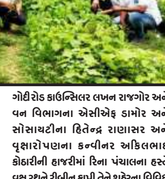
સ્ટેશન રોડ, ગોરીરોડ, ગોધરા રોડ તાલુકા શાળા રોડ સહિત અલગ અલગ વિસ્તારોમાં નગરજનો દ્વારા કરાયેલા સ્ટ્રેટ્ટેશન બાદ આજરોજ રોપાઓ વિતરણ કાર્યક્રમનું આયોજન કરાયું હતું.

દાહોદ, વિશ્વમાં એક ચર્ચા છે, પૃથ્વી પર ગંભીર ખતરો વર્તાઈ રહ્યો છે. જેનું મુખ્ય કારણ માત્ર માત્ર વૃક્ષોની ઘટ થઈ રહી છે.