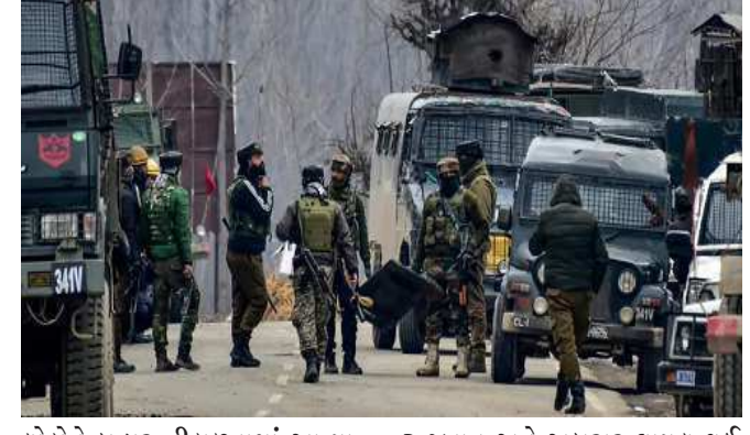
લોકોને બહાર નીકળવામાં આવ્યા. અબરારના પગલે હથિયારોની શોધ કરવામાં આવી રહી હતી, ત્યારે એક ઘરમાં છૂપાયેલા તેના સાથીએ ફાયરિંગ શરૂ કરી દીધું. આમાં સીઆરપીએફના

પારિપોરા, શ્રીનગરના પારિપોરામાં સો મવાર સાંજથી ચાલી રહેલી અથડામણમાં સુરક્ષાદળોએ ૨ આતંકવાદીઓને ઠાર કર્યા છે. આમાં પાકિસ્તાની આતંકવાદી નદીમ અબરાર અને એક તેનો સ્થાનિક સાથી સામેલ છે. અબરાર લશ્કર-એ-તૈયબાનો ટોચનો કમાન્ડર પણ હતો. તેની ગઈકાલે જ ધરપકડ કરવામાં આવી હતી. મોટી રાત સુધી ફક્ત એક આતંકવાદીના માર્યા જવાના સમાચાર હતા. સો મવાર સાંજે ૬ વાગ્યે સુરક્ષાદળોએ આ સંપૂર્ણ વિસ્તારને ઘેરી લીધો હતો. સૌથી પહેલા અહીંથી સ્થાનિક