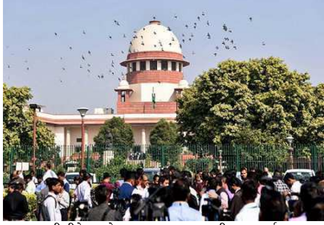
રાજ્ય જરૂરી રીતે વન નેશન, વન રાશન કાર્ડની સ્કીમ લાગુ કરે જેથી પ્રત્યેક પ્રવાસી મજૂર દેશના કોઈ

રાજ્યોએ અત્યાર સુધી વન નેશન, વન રાશનની સ્કીમ લાગુ નથી કરી તેઓ ૩૧ જુલાઈ સુધી અનિવાર્ય રીતે આ સ્કીમને લાગુ કરે. સુપ્રીમ કોર્ટે પ્રવાસી મજૂરોના વેલફેર માટે અન્ય નિર્દેશ પણ જાહેર કર્યા છે. સુપ્રીમ કોર્ટે કેન્દ્ર સરકારને કહ્યું છે કે, તે એનઆઈસીથી સંપર્ક કરે. તમામ અસંગઠિત મજૂરો અને પ્રવાસી મજૂરોના રજિસ્ટ્રેશન માટે પોર્ટલ તૈયાર કરે. આ પ્રક્રિયા ૩૧ જુલાઈ સુધી શરૂ થઈ જવી જોઈએ. કેન્દ્ર સરકારને સુપ્રીમ કોર્ટે એ પણ નિર્દેશ આપ્યો છે કે તે પ્રવાસી મજૂરોના અનાજના પુરવઠા માટે