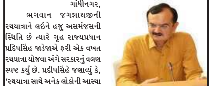
ભગવાન જગન્નાથજીની રથયાત્રાને લઈને હજુ અસમંજસની સ્થિતિ છે ત્યારે ગુહ રાજ્યપ્રધાન પ્રદિપસિંહ જાડેજાએ ફરી એક વખત રથયાત્રા યોજવા અંગે સરકારનું વલણ સ્પષ્ટ કર્યું છે. પ્રદિપસિંહ જાડેજાએ, 'રથયાત્રા સાથે અનેક લોકોની આસ્થા જોડાયેલી છે. કોરોનાની બીજી લહેર આપણે સૌએ જોઈ છે. રથયાત્રા યોજવા મુદ્દે ટૂંકી અને અધિકારીઓ સાથે ચર્ચા થઈ છે. સરકાર પરિસ્થિતિનું નિરીક્ષણ કરી રહી છે. ૧૨ જુલાઈએ કોરોનાની શું સ્થિતિ છે તે જોઈને જ સરકાર રથયાત્રા અંગે નિર્ણય લેશે.'

ગુહ રાજ્યમંત્રી પ્રદિપસિંહ જાડેજાએ પત્રકાર પરિષદ યોજીને નિવેદન આપતા જણાવ્યું છે કે, '૫૩ હજાર આંગણવાડીના ૧૪ લાખ બાળકોને ૩૬ કરોડ ના ખર્ચે ૨ જોડી ગણવેશ આપવામાં આવ્યાં. રાજ્યના જુદા જુદા જિલ્લામાં મંત્રી સહિતના આગેવાનોની ઉપસ્થિતિમાં પૂર્ણ કર્યાં. બાળકની ૩ થી ૬ વર્ષની ઉંમર એવી હોય છે જેમાં તેની સાથેના વ્યવહારની એક છબી બને છે આવી ભાવનાથી સીએમ અને વિભાગ ન મંત્રી એ નિરીક્ષણ કરી રહી છે. આ અંગે દિલ્હી આજથી આ યોજના શરૂ કરી છે. વધુમાં વેક્સિનેશન અંગે નિવેદન આપતા જણાવ્યું કે, 'કોરોના સંક્રમણના બીજા તબક્કામાં સેકન્ડ વેવની અસર ઘટી રહી છે. વેક્સિનેશન પુરજોશમાં ચાલે છે. ત્રીજી વેવને નિવારવા માટે અમે કટિબદ્ધ છીએ. રાજ્યમાં વેક્સિનેશનને લઈને ક્યાંય અવ્યવસ્થા પણ જોવા મળી છે. તે અવ્યવસ્થા ન સર્જાય તેનું જરૂરી આયોજન પણ અમે કરીશું.'