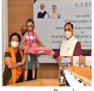
દરમિયાન રાજ્યના ૩ થી ૬ વર્ષના ૧૬ લાખ જેટલા ભૂલકાઓને પોષણશક્તિ આહાર માટે દર અઠવાડિયે ૧ કિલો

આમ સુખી આપવાની પહેલ પણ ગુજરાતે કરી છે. રાજ્યમાં કોરોના સંક્રમણકાળમાં મહિલા બાળ વિકાસ વિભાગ દ્વારા આયોજિત 'હેન્ડ વોશ' કેમ્પોનમાં એક સાથે પાંચ લાખ બહેનોએ પાંચ હજાર સ્થળોએ જોડાઈને નવો વર્લ્ડ રેકોર્ડ બનાવ્યો હતો. આ ગૌરવ સિદ્ધિ માટે વર્લ્ડ બુક ઓફ રેકોર્ડ લંડનનું પ્રમાણ પત્ર તેમના પ્રતિનિધિએ મુખ્યમંત્રીને અર્પણ કર્યું હતું. મુખ્યમંત્રીએ આ ગૌરવ સિદ્ધિ માટે મહિલા અને બાળ કલ્યાણ વિભાગને અભિનંદન આપતા આ પ્રમાણપત્ર વિભાગને એનાયત કર્યું હતું. આ સાથે જ મહિલા અને બાળ કલ્યાણ મંત્રી ગણપતભાઈ વસાવા, રાજ્યમંત્રી વિભાવરીબેન દવે, મહિલા બાળ વિકાસ કમિશનર કે.કે. નિરાલા તેમજ આઈ.સી.ડી.એસ નિયામક ગાંધીનગરમાં મુખ્યમંત્રીશ્રી સાથે આ અવસરે ઉપસ્થિત રહ્યા હતા. રાજ્યના વિવિધ જિલ્લા મથકો-મહાનગરોમાં પદાધિકારીઓ યુનિફોર્મ વિતરણના વર્ચુલ કાર્યક્રમમાં જોડાયા હતા. મુખ્યમંત્રીએ ભૂલકાઓને ગાંધીનગરમાં મુખ્યમંત્રી નિવાસ સ્થાને પ્રતિક રૂપે યુનિફોર્મ વિતરણ કરવા સાથે આગવી સંવેદના દર્શાવતા આ બાળકોને પોતાના તરફથી ભેટ અર્પણ કરી હતી.