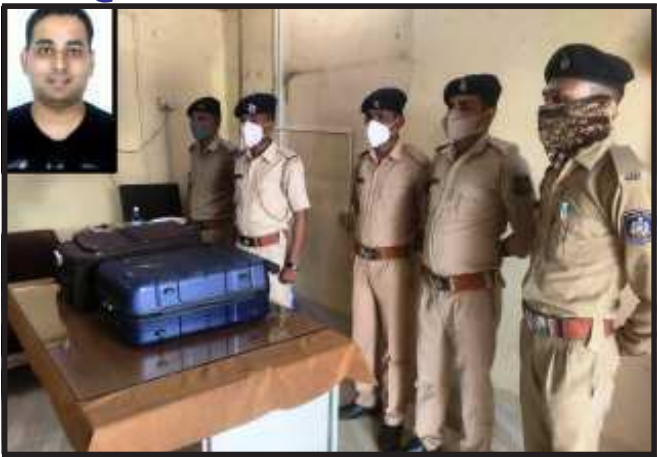
કરી રોકડ તથા સોના-ચાંદીના ક્યાં લઈ જતો હતો. તેની તપાસ દાગીના ક્યાંથી, કોને છે તેમજ રેલ્વે પોલીસ દ્વારા કરવામાં

ગોધરા, ગોધરા શહેરના રેલ્વે મથક ખાતે પશ્ચિમ એક્સપ્રેસ ટ્રેનમાં ગોધરા રેલ્વે પોલીસ દ્વારા હરીયાણાના એક ઈસમને બે ટ્રાવેલીંગ બેગો સાથે ઝડપી પાડવામાં આવ્યો હતો. બેગોની તપાસ કરતાં રોકડા તેમજ સોના-ચાંદીના દાગીના મળી ૧,૧૨,૨૦,૭૫૦ કરોડ રૂપિયાના મુદ્દામાલ સાથે ઝડપી પાડવામાં આવ્યો હતો. પકડાયેલ ઈસમની અટકાયત