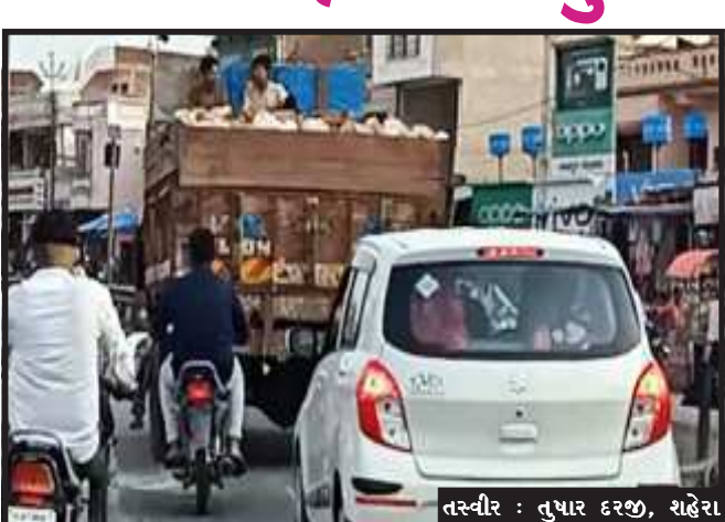
તસ્વીર : તુષાર દરજી, શહેરા

શહેરા, શહેરા તાલુકાના સગરાડા સહિતના ગ્રામીણ વિસ્તારમાં આવેલ જમીનમાં મોટા પ્રમાણમાં સફેદ પથ્થરો આવેલ છે. રોયલ્ટી પાસ વગર અમુક ટ્રકોમાં સફેદ પથ્થરો ઓવર લોડ ભરીને બેરોકટોક હેરાફેરી થઈ રહી છે. તાલુકામાં ખનીજ ચોરી વધતા સરકારી તિજોરીને મસ મોટું નુકશાન જઈ રહ્યું હોવા છતાં ખાણ ખનીજ વિભાગ સહિતનું અન્ય તંત્ર આ સામે કાર્યવાહી કરવામાં ખચકાઈ રહ્યું છે. શહેરા તાલુકા સગરાડા, છોગાળા, શેખપુર સહિતના વિસ્તારમાં આવેલી જમીનમાં મોટા પ્રમાણમાં સફેદ ચમકતા પથ્થરો આવેલ છે. ખનિજ ચોરો હાલ તાલુકા માંથી લીજ ન હોવા છતાં ખનિજ ચોરી કરતા ગભરાતા