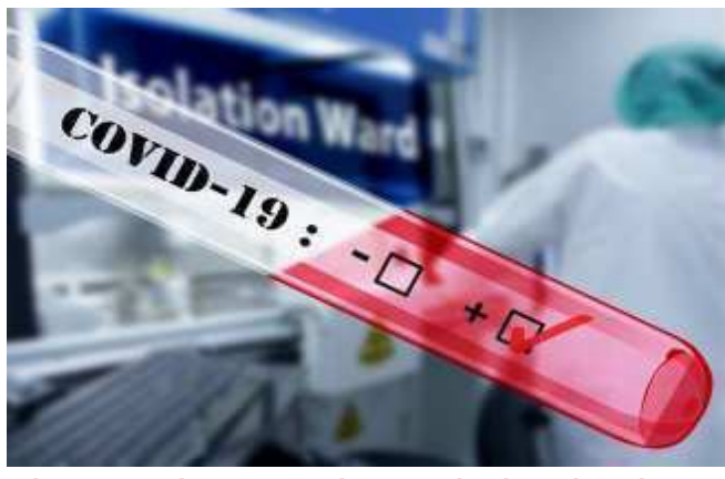
જાહેર કરવામાં આવેલા આંકડા પ્રમાણે સોમવારે દેશમાં કોરોનાના નવા ૪૨,૬૪૦ સંક્રમણ નોંધાયા છે જ્યારે ૧,૧૬૭ લોકોના પાછલા ૨૪ કલાકમાં મોત થયા છે. સતત નવા કેસમાં ઘટાડો થવાની સાથે સાથે થનારા દર્દીઓની સંખ્યા મોટી હોવાથી એક્ટિવ કેસમાં પણ ઝડપથી ઘટાડો નોંધાઈ રહ્યો છે. ૨૪ કલાકમાં નોંધાયેલા કેસ પ્રમાણે નવા કેસની સામે સાથે થનારા દર્દીઓની સંખ્યા લગભગ બમણી છે. ૧૬ જાન્યુઆરીએ ભારતમાં વેક્સીનેશનની શરૂઆત કરવામાં આવી

ન્યુ દિલ્હી, ભારતમાં કોરોનાના કેસમાં સતત ઘટાડો નોંધાઈ રહ્યો છે, આ સાથે સોમવારે નોંધાયેલા નવા કેસની સંખ્યાએ ૯૧ દિવસ પહેલા નોંધાયેલા સૌથી ઓછા કેસ જેટલી નોંધાઈ છે. ભારતમાં ગઈકાલે ૫૩,૨૫૬ કેસ નોંધાયા હતા જેમાં આજે ૧૦,૦૦૦ કરતા વધુનો ઘટાડો નોંધાયો છે. આજે નોંધાયેલા કેસમાં મૃત્યુઆંક પણ ૧૫૦૦ કરતા નીચો જઈને ૧૦૦૦ની નજીક પહોંચ્યો છે. એક તરફ કેસ ઘટતા બજારો અને રસ્તાઓ પર ભીડ વધી રહી છે. આવામાં સામાન્ય બેદરકારી ભારે પડી શકે છે, માટે જ લોકોને માસ્ક અને સોશિયલ ડિસ્ટન્સિંગનું પાલન કરવાની સતત સલાહ આપવામાં આવી રહી છે. કેન્દ્રીય સ્વાસ્થ્ય મંત્રાલય દ્વારા