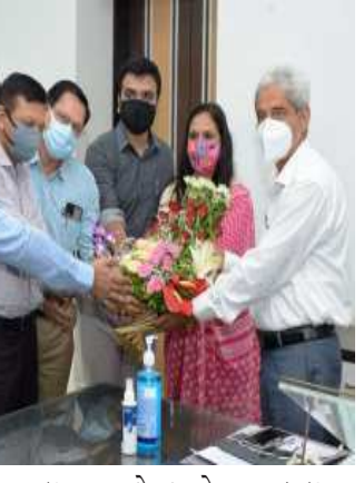
સરળતા રહે અને ભૂતકાળના અનુભવનો વિનિયોગ થાય, ખામીઓ જણાઈ હોય એ સુધારી લેવાય તે રીતે સંભવિત ત્રીજા લહેર સામેની પૂર્વ તૈયારીઓને અગ્રતા આપીશું અને ચોમાસામાં લોકોને સુશકેલી ન પડે તેના માટે યોગ્ય મોનિટરિંગને તેમજ રોજિંદા મહેસૂલી કામોનું સમયબદ્ધ નિરાકરણ અને જિલ્લા વહીવટી તંત્રના તમામ વિભાગો સાથે સંકલનથી લોકલક્ષી વહીવટને અગ્રતા આપીશું.

વડોદરા, નવ નિયુક્ત વડોદરા જિલ્લા કલેક્ટર આર.બી.બારડેને આજે કલેક્ટર કચેરી ખાતે આગમન થતાં નિવાસી અધિક કલેક્ટર દિલીપ પટેલ અને ઉચ્ચ અધિકારીઓએ તેમનું સ્વાગત કર્યું હતું. ત્યારબાદ જિલ્લા કલેક્ટર આર.બી. બારડે ચાર્જ સંભાળ્યો હતો. તેઓ અગાઉ મહિસાગર જિલ્લાના કલેક્ટર તરીકે કાર્યરત હતા અને ભૂતકાળમાં ટીમ વડોદરાનો ભાગ રહી ચૂક્યા છે. વિધિવત્ પદભાર સંભાળ્યા પછી તેમણે જણાવ્યું કે, હાલમાં મહામારીની પરિસ્થિતિ છે, ત્યારે રસીકરણ મૂલ અગત્યનું છે અને રસીકરણ હજી પણ વધુ વેગવાન બને તેવો પ્રયત્ન કરીશું. ભવિષ્યમાં કોઈપણ પરિસ્થિતિને પહોંચી વળવામાં