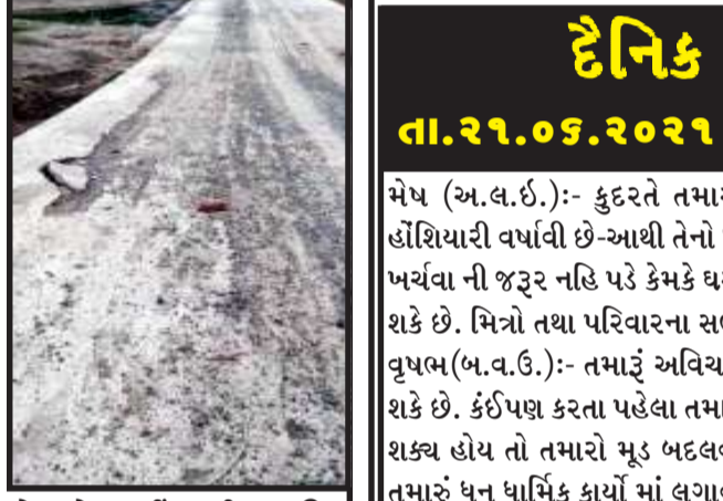
તસ્વીર : અર્ધીયા થી પ્રાથમિક શાળાઓ આંગણવાડી આરોગ્ય માટે સારવાર તમામ કર્મચારી અને ગ્રામજનો અહીંથી પસાર થતા હોય આવતા પહેલા જ તૂટી ગયો હતો.

સંતરામપુર, સંતરામપુર તાલુકાના ગડા ગામની અંદર પસાર થવા માંથી એક જ રસ્તો હતો. વર્ષોથી આ રસ્તો બિસ્માર હાલતમાં જોવા મળેલો છે. દર યોમાસામાં આ રસ્તા પરથી પસાર થઈ શકાતું નથી. કારણકે નદી હોવાના કારણે મોટા ગાબડા પડી ગયા હોય છે અને રસ્તો બંધ થઈ જતો હોય છે. ગ્રામજનો અનેકવાર રજૂઆત કરવા છતાં ત્રણ માસ અગાઉ વર્ષો પછી તેને બનાવવામાં આવ્યું પરંતુ હલકી કચાનો માલસામાન વાપરીને કોન્ક્રીટ દ્વારા તકલાદી કામગીરી હોવાનું ગ્રામજનોની આરોપ કર્યો હતો કે, ત્રણ માસ અગાઉ જે રસ્તો બનાવવામાં આવેલો હતો. અત્યારથી જ ચોમાસા આવતા પહેલા જ તૂટી ગયો હતો. આજ રસ્તા પરથી ગ ડા ગામની અંદર જવા માટે આ એક જ રસ્તો