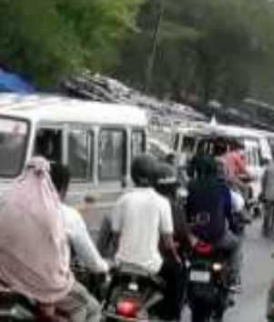
તસ્વીર : નીલેશ જોષી, પાવાગઢ

માંના દર્શનાર્થે માંઈ ભકતો ઉમટી પડ્યા હતા. વરસાદી માહોલ વચ્ચે મહાકાળી માંના દર્શન કરી ભકતો એ ધન્યતા અનુભવે છે. ત્યારે બીજી તરફ એવા દ્રશ્યો પણ સામે આવ્યા. જેમાં લોકો મારુક અને સોશયલ ડિસ્ટન્સનું ભાન ભુલતા હોય તેવું જોવાઈ રહ્યું હતું. કોરોનાની ત્રીજી લહેર લાવવામાં આવા જ લોકોનો સિંહ ફાળો હશે તેવું લાગી રહ્યું છે. હાલમાં પાવાગઢમાં વરસાદી માહોલને લઈ લોકો કોરોનાની ગાઈડ લાઈન ભુલતા હોય તેવું દેખાઈ રહ્યું છે.