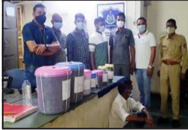
નગરમાં ક્રાંતિકંચન સોસાયટીમાં ગાંજાનું વેચાણ થતું હોવાની પોલીસને બાતમી મળી હતી. તાત્કાલિક પોલીસ

દાહોદ, દાહોદ જિલ્લાના ઝાલોદ તાલુકાના લીમડી નગરમાંથી દાહોદ એલસીબી અને એસઓજી પોલીસને મળેલ બાતમીના આધારે એક સોસાયટી મકાનમાં ગાંજાનું વેચાણ થતું હોવાની બાતમી મળતાં પોલીસે ૦૪.૬૩ કિલો ગ્રામ કિંમત રૂા.૪૬,૩૦૦ ગાંજા સાથે એક ઈસમને ઝડપી પાડ્યાનું જાણવા મળે છે. દાહોદ એલ.સી.બી અને એસ.ઓ.જી પોલીસને મળેલ બાતમીના આધારે ગત રોજ તા.૧૮મી જુનના રોજ ઝાલોદ તાલુકાના નાનકડા ગામ એવા લીમડી