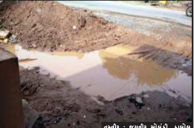
તસ્વીર : જયવીર સોલંકી, કાલોલ

હાલોલ, હાલોલમાં છેલ્લા કેટલાય સમય થી ભુર્ગભ ગટર લાઈનનું કામ ચાલી રહ્યું છે. ત્યારે હાલોલ નગરવાસીઓ આ ભુર્ગભ ગટર લાઈનની કામગીરીથી નારાજ છે. હાલમાં પડેલ પહેલા વરસાદમાં જ રસ્તાઓ પર મસમોટા ભુવાઓથી લોકો પરેશાન થયા છે. ત્યારે તંત્ર દ્વારા કોઈપણ કામગીરી કરવામાં આવતી નથી. હાલોલમાં કંજરી રોડ પર આવેલ અનેક રસ્તામાં ભુવા પડવાથી તેમાં કેટલીય કાર અને બીજા મોટા વાહનો પણ ભુવામાં ખાબકી પડવાના બનાવો બનવા પામ્યા છે. ત્યારે આજે હાલોલ નગર પાલિકાને કેટલાય લોકો દ્વારા રજુઆત કરવામાં આવી હતી. પણ હજુ સુધી તંત્ર દ્વારા ભુર્ગભ ગટરની કામગીરીમાં બરાબર માટી પુરાણ નહીં કરેલ હોવાથી મસમોટા ખાડાઓ પડ્યા છે. જેમાં કેટલાય નાના-મોટા