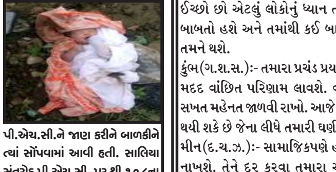
તસ્વીર : આર.સી.ને જાણ કરીને બાળકીને વ્યાં સોંપવામાં આવી હતી. સાલીયા સંતરોડ પી.એચ.સી. પર થી ૧૦૮ના માધ્યમથી સિવિલ હોસ્પિટલ પહોંચાડી હતી. ત્યારબાદ ગોધરા શિશુવિભાગમાં સોંપવામાં આવી હતી.

મોરવા(હ), પંચમહાલ જિલ્લાના મોરવા હડપ તાલુકાના સંતરોડ પાનમ નદીના કિનારે એક નવજાત બાળકી મળી આવી છે. સાલીયા સંતરોડ ગામમાં આવેલી પાનમ નદીમાં રેતી ભરવાનું કામ કરતા મજૂરોને નવજાત શિશુનો અવાજ સંભળાતા તે મજૂરો ગામના જવાબદાર નાગરિકોની જાણ કરી હતી. નાગરિકો ગામની પોલીસ યોદ્ધી પર જાણ કરતા પોલીસ અધિકારી સ્થળ પર પહોંચ્યા હતા. ત્યારબાદ તેઓએ સાલીયા સંતરોડ