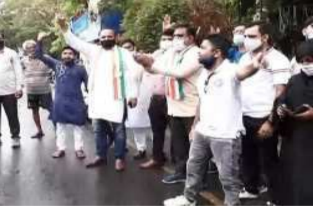
ગાંધીનગર, સમગ્ર દેશમાં પેટ્રોલ-ડિઝલની કિંમતોમાં થઈ રહેલા સતત વધારાને કારણે આમ આદમીની કમર તૂટી જવા પામી છે. ઈંધણના ભાવ ઘટવાનું નામ જ લઈ રહ્યા ન હોવાથી આજે કોંગ્રેસ દ્વારા સમગ્ર ગુજરાત સહિત દેશમાં વિરોધ પ્રદર્શન કરવામાં આવી રહ્યું છે. દરમિયાન આજે રાજકોટના ત્રિકોણ બાગ ચોકમાં શહેર કોંગ્રેસે ધરણા શરૂ કર્યાની મિનિટોમાં જ પોલીસે દોડી જઈને અનેક કોંગ્રેસ કાર્યકરો અને નેતાઓની ઈંગાટોળી કરીને અટકાયત કરી લીધી હતી. આજે રાજકોટ ઉપરાંત સૌરાષ્ટ્રમાં પણ ઠેક-ઠેકાણે કોંગ્રેસ દ્વારા વિરોધ પ્રદર્શન કરવામાં આવ્યું હતું. જો કે આ પ્રદર્શન આગળ વધે તે પહેલાં જ પોલીસ દ્વારા તમામ લોકોની અટકાયત કરી લેવાઈ હતી. અમદાવાદ શહેરમાં પણ કોંગ્રેસે પેટ્રોલ ડિઝલના વધતા ભાવ વધારા સામે વિરોધ પ્રદર્શન કરવામાં આવ્યું છે. સીજી રોડ ખાતે આવેલા પેટ્રોલ પંપ ખાતે શહેર કોંગ્રેસ પ્રમુખ મ્યુનિસિપલ કોર્પોરેટર અને કોંગ્રેસના કાર્યકરોએ વિરોધ કર્યો છે. તેઓ બેનર દર્શાવી પેટ્રોલ ડિઝલના વધતા ભાવ સામે વિરોધ કર્યો છે. પરંતુ પોલીસે મંજૂરી વિના કાર્યક્રમ યોજાયો હતો, જેના કારણે તેમની મુશ્કેલીઓ વેઠવાનો વારો આવ્યો હતો. કોંગ્રેસે માંગ કરી છે કે, પેટ્રોલ ડિઝલનો ભાવ વધારો પાછો ખેંચવામાં આવે.. વડોદરાના પાદરામાં કોંગ્રેસ દ્વારા કોરોનાની મહામારીમાં પણ પેટ્રોલ, ડિઝલ, તેલના ભાવ વધારાને લઈ વિરોધ પ્રદર્શન કાર્યક્રમ યોજાયો છે. વડોદરા જિલ્લા કોંગ્રેસ સમિતિ દ્વારા જિલ્લા કક્ષાનો પ્રોગ્રામ પાદરા મુકામે યોજાયો છે. જેમાં પેટ્રોલ પમ્પ સામે બંસીને ધરણા કર્યા છે. વડોદરા જિલ્લા કોંગ્રેસ પ્રમુખ તેમજ પાદરાના ધારાસભ્ય જસપાલસિંહ સાયકલ પર નીકળી વિરોધ દર્શાવ્યો હતો. કાર્યકરોએ પણ વિવિધ બેનરો સાથે ભાજપા વિરુદ્ધ ભારે સુગ્રોચાર કરી વિરોધ નોંધાવ્યો છે. મામલો વધુ ગંભીર ન બને તે પહેલા પાદરા પોલીસ ઘટના સ્થળેથી ૨૫ જેટલા કોંગ્રેસ આગેવાન હોદ્દાદારો અને કાર્યકરોની અટકાયત કરી છે. એટલું જ નહીં, વડોદરામાં દોરડાથી કાર ખેંચીને કાર્યકરોએ વિરોધ દર્શાવ્યો હતો. જેમાં ભરતસિંહ સોલંકીની આગેવાનીમાં વિરોધ કરાયો છે. ભરતસિંહ સોલંકીએ પ્રમુખની રેસમાં આગળ હોવા મામલે એક નિવેદન પણ આપ્યું હતું. જેમાં તેમણે જણાવ્યું હતું કે, પ્રમુખ કોઈ પણ બેનર પ્રજા હિતનું કામ કરવું જરૂરી સુરતમાં પેટ્રોલ-ડિઝલના