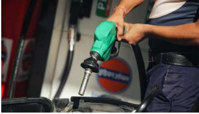
આપને જણાવી દઈએ કે ગુરુવારે ફૂડ ઓઈલના ભાવમાં નરમાશ જોવા મળી હતી, જે પછી આજે એટલે કે ૧૧ જૂને પેટ્રોલ અને ડિઝલની કિંમતમાં ફેરફાર કરવામાં આવ્યો છે. મળતી માહિતી મુજબ, આજે દિલ્હીમાં પેટ્રોલની કિંમત ૯૫.૮૫ રૂપિયા પ્રતિ લિટર થઈ ગઈ છે, જ્યારે ડિઝલની કિંમત પ્રતિ લિટર ૮૬.૭૫ રૂપિયા પર પહોંચી ગઈ છે. મુંબઈમાં પેટ્રોલનો ભાવ ૧૦૨ પ્રતિ લિટરની પાર થઈ ગયો છે. જ્યારે ડિઝલ ૯૪ ઉપર છે. આપને જણાવી દઈએ કે, આ વર્ષે પેટ્રોલની કિંમતમાં લગભગ ૧૪ ટકાનો વધારો થયો છે. વળી પેટ્રોલનાં ભાવમાં ૨૫-૨૯ પૈસા પ્રતિ લિટર અને ડિઝલમાં ૨૭-૩૦ પૈસા પ્રતિ

લિટરનો વધારો થયો છે. માર્ચ એપ્રિલમાં પાંચ રાજ્યોમાં વિધાનસભા ચૂંટણી દરમિયાન પેટ્રોલ ડિઝલની કિંમતમાં મોટો ફેરફાર થયો ન હતો. બે મેના રોજ ચૂંટણીના પરિણામ બાદ ચાર મેથી કિંમત વધવાની શરૂ થઈ ગઈ. મેમાં કુલ ૧૬ વખત પેટ્રોલની કિંમતમાં વધારો થયો. દિલ્હીમાં મે મહિનામાં