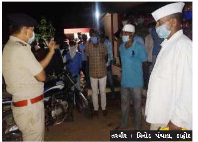
સમયગાળા દરમિયાન મામલતદારની પરવાનગી મેળવ્યા વિના લગ્ન આયોજિત કરી ધાનપુર તાલુકાના કાળિયાવાડ ગામે ૨૦૦ થી વધુ મહેમાનો તથા ભોરવા

દાહોદ, દાહોદ જિલ્લાના ધાનપુર તાલુકાના બે ગામોમાં લગ્ન પ્રસંગોમાં જાહેરનામાનો ભંગ થતો જોવાતાં પોલીસની ટીમના સપાટામાં નિમંત્રકો અને ડી.જે.સંચાલકો વિરૂદ્ધ ગુનો નોંધી પોલીસે કાયદેસરની કાર્યવાહી હાથ ધરી છે. જાણવા મળ્યા અનુસાર, ડી.જે. સંચાલકોના ડી.જે.સિસ્ટમ પણ જમ કરવામાં આવ્યાં છે.