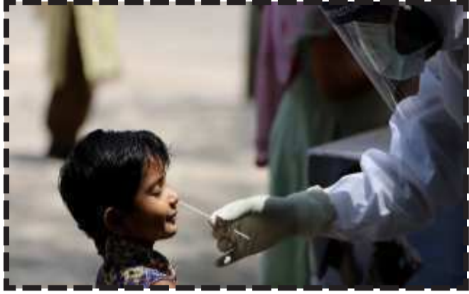
જયપુર, કોરોનાની બીજી લહેર હજુ શમી નથી ત્યાં ત્રીજી લહેરના આગમનથી સ્થિતિ વધુ ભયજનક બની છે. રાજસ્થાનના દોસા ખાતે કોરોનાની ત્રીજી લહેરનું આગમન વર્તાઈ રહ્યું છે. દોસા ખાતે ૩૪૧ બાળકો કોરોનાની લપેટમાં આવ્યા છે, મતલબ કે ૩૪૧ બાળકોમાં કોરોના સંક્રમણની પૃષ્ઠિ થઈ છે. કોરોનાની ત્રીજી લહેરની સંભાવનાને ધ્યાનમાં રાખીને દોસા જિલ્લા પ્રશાસન એલર્ટ થઈ ગયું છે. દોસા ખાતે ૩૪૧ બાળકોને કોરોના થયો છે અને તે તમામની ઉંમર ૦થી ૧૮ વર્ષ સુધીની છે. આ તમામ કેસ એનડીઆરએફની ૬૫ ટીમ તૈનાત યાસનો ખતરો: બંગાળ, ઓડિશા પર ૨૬મીએ વાવાઝોડું ત્રાટકશે

કોઈની સ્થિતિ સીરિયસ નથી. હાલ કોવિડની ત્રીજી લહેરની સંભાવનાને ધ્યાનમાં રાખીને દોસા જિલ્લા હોસ્પિટલને એલર્ટ કરી દેવામાં આવી છે. આ બધા વચ્ચે રાજસ્થાનના ગ્રામીણ વિસ્તારોમાં કોરોના અટકાવવા માટે રાજસ્થાન સરકારે યુદ્ધ સ્તરે તૈયારીઓ શરૂ કરી દીધી છે. તે અંતર્ગત સ્વાસ્થ્ય વિભાગની ટીમ ગામે-ગામ અને ડોર-ટુ-ડોર ફરીને લોકોનો કોવિડ ટેસ્ટ કરશે. ગામોમાં જ કોવિડ સેન્ટર બનાવાશે અને