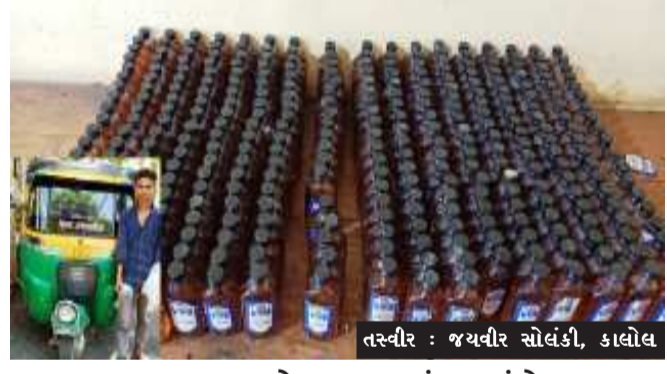
તસ્વીર : જયવીર સોલંકી, કાલોલ

કાલોલ, પંચમહાલ જિલ્લામાં દારૂની અસામાજિક ગોધરા એલ.સી.બી.ને ભાતમી મળી હતી કે, એક સી.એન.જી.રીક્ષા નંબર જી.જે.૦૭.એ.ટી ૩૬૫૨ માં ભારતીય બનાવટનો વિદેશી દારૂ ભરી લઈને રીક્ષાનો ચાલક દામાવાવથી નિકળી વેજલપુર થી આરોપી વિરૂદ્ધ પ્રોહીબીશનની અલગ-અલગ કલમો હેઠળ વેજલપુર પોલીસ સ્ટેશનમાં ગુનો નોંધી કાયદેસરની કાર્યવાહી હાથ ધરી છે.