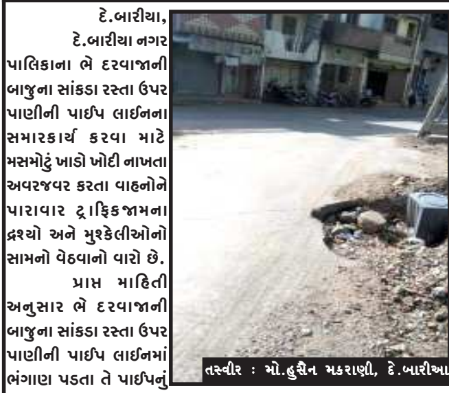
દે.બારીયા, દે.બારીયા નગર પાલિકાના ભે દરવાજાની બાજુના સાંકડા રસ્તા ઉપર પાણીની પાઈપ લાઈનના સમારકામ કરવા માટે મસમોદું ખાડો ખોદી નાખતા અવરજવર કરતા વાહનોને પારાવાર દ્રાફિક જામના દ્રશ્યો અને મુશ્કેલીઓનો સામનો વેઠવાનો વારો છે.

ભે દરવાજા રોડનો ટ્રાફિકનો હાલ છે. જે ખાડો ખોદવામાં આવ્યો હતો. તેનું પુરણકાર્ય અધુરું રાખવામાં આવતાં ટ્રાફિકના દ્રશ્યો જોવા મળે છે. આ રોડ માર્ગ અને મકાનનો ઘોરી માર્ગ છે. જેના દ્વારા પાવાગઢ, વડોદરા તરફ અને છોટાઉદેપુર, બોડેલી તરફ જવા માટે હજારો વાહનો અવરજવર કરતા હોય છે. આ મસમોદું ખાડાના કારણે દ્રાફિક જામ વારંવાર ખોદેલા ખાડાને મેટલ અને માટીના નાખી પુરવામાં આવે આ ખાડાને દસ થી પંદર દિવસ થવા આવ્યા હોવા છતાં પુરવામાં કેમ આવતું નથી. દુર્ઘટના સર્જાયા પહેલા ખાડાનું પૂરણ કરવામાં આવે તેવું વાહન ચાલકો અને રાહદારીઓમાં માંગ ઉઠવા પામી છે.