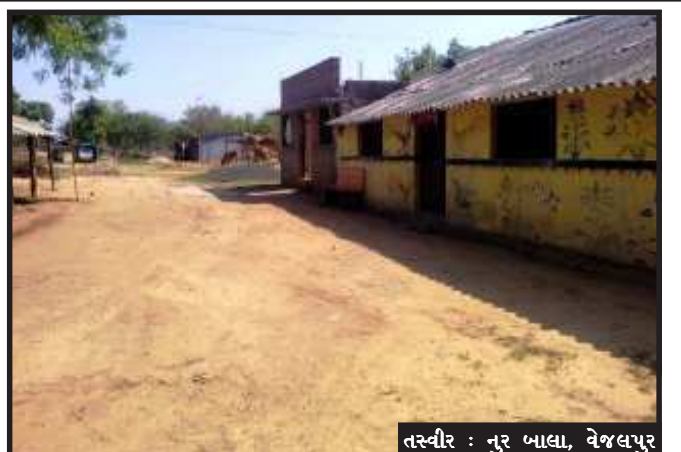
તસ્વીર : નુર બાબા, વેજલપુર

વેજલપુર, કાલોલ તાલુકાના વેજલપુર ગામ વિસ્તારમાં આવેલ જોડિયા કુવામાં અમરસિંહ નાયકના ફળીયામાં સી સી રોડનું કામ મહાત્મા ગાંધી રાષ્ટ્રીય ગ્રામીણ યોજના હેઠળ કામ મંજૂર કરવામાં આવ્યું હતું અને તે સ્થળ ઉપર કામ ચાલુ હોય તેમ ઓનલાઈન બતાવીને કેટલાક જોબકાર્ડ ધારકોના ખાતામાં રૂપિયા નાખી ને ચાલ કરી દીધા હોય તેમ લાગી રહ્યું છે. મનરેગા વિભાગના અધિકારીઓ આંખે પાટા બાંધીને આડેઘડ કામો કરતા હોય તેમ લાગે છે. કારણ કે, કોઈપણ જગ્યા ઉપર પહેલા જીવો ટેક કરવાનું હોય છે અને પછી સ્થળ ઉપર કામ કરવાનું હોય અને કામ પૂર્ણ થયા પછી ફોટોગ્રાફ