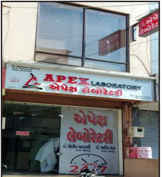
ગોધરા, ગોધરા શહેરના નગર પાલિકા રોડ ઉપર આવેલ એપેક્ષ લેબોરેટરીના ભાવ વધારા વિશે છેલ્લા એક સપ્તાહથી ચર્ચાનો વિષય બન્યો છે. તબીબો દ્વારા