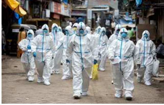
દર્દીઓ સાજા થતા કોરોનાને હરાવીને કુલ સાજા થયેલા દર્દીઓની સંખ્યા ૨,૧૯,૮૬,૩૬૩ પર પહોંચી ગઈ છે. દેશમાં કુલ કોરોનાથી થયેલા મૃત્યુની સંખ્યા ૨,૮૩,૨૪૮ થઈ ગઈ છે.

ન્યુ દિલ્હી, ભારતમાં કોરોના વાયરસના કેસમાં સતત થઈ રહેલો ઘટાડો રાહત આપી રહ્યો છે તો બીજી તરફ વધી રહેલા મૃત્યુઆંક ચિંતાનું કારણ બની રહ્યા છે. ફરી એકવાર દેશમાં કોરોનાના એક દિવસમાં નોંધાતા મૃત્યુઆંકે નવો રેકોર્ડ નોંધાવ્યો છે. એકાદ બે દિવસને બાદ કરતા દેશમાં ૧૨ દિવસથી નવા કેસમાં ઘટાડો નોંધાઈ રહ્યો છે.