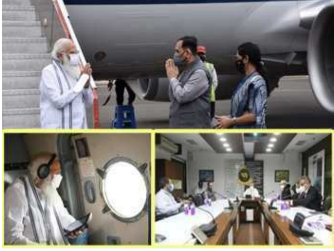
ગાંધીનગર, રાજ્યમાં તાઉ-તે વાવાઝોડાએ વિનાશ વેર્યો છે, ત્યારે વડાપ્રધાન નરેન્દ્ર મોદી એક દિવસીય હવાઈ નિરીક્ષણ માટે આજે ગુજરાતની મુલાકાતે આવ્યા હતા. તેમણે ભાવનગરથી હેલિકોપ્ટરમાં બેસી વાવાઝોડા બાદની સ્થિતિનું નિરીક્ષણ શરૂ કર્યું હતું. વડાપ્રધાન ૧ કલાક ને ૫૦ મિનિટ હવાઈ નિરીક્ષણ કર્યા બાદ અમદાવાદમાં વડાપ્રધાનની મુખ્યમંત્રી વિજય રૂપાણી તેમજ રાજ્યના વરિષ્ઠ સચિવો સાથે સમીક્ષા બેઠક મળી હતી. આ બેઠકમાં મુખ્યમંત્રીના મુખ્ય અગ્ર