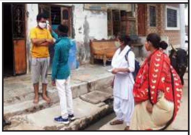
ભીડ વાળી જગ્યાએ જવાનું ટાળવું ૨૫ થી ઉપરના વ્યક્તિને રસી ના ડોઝ લેવાની સલાહ સૂચન આપવામાં આવી.

સંજેલી, સંજેલી નગરના લોકોને કોરોના મહામારી વિશે સમજુતી આપવામાં આવી કોરોના ના લક્ષણો હોય તેમને ટેસ્ટ કરાવી સારવાર લેવા માટે સલાહ સૂચન આપવામાં આવ્યા. જેથી હોસ્પિટલમાં દાખલ થયાથી બચી શકાય શરદી ખાંસી જેવા સામાન્ય લક્ષણો હોય તેમને પ્રાથમિક સારવાર માટે દવાની કીટ આપવામાં આવી આરોગ્ય સેતુ એપ તેમજ અન્ય રોગો જેવાકે ટીબી લેપ્રસી ડાયરીયા જેવા રોગોનું પણ સર્વે આરોગ્ય વિભાગ દ્વારા હાથ ધરવામાં આવી તેમજ જરૂરિયાત સિવાય ઘરની બહાર ન જવા સૂચના આપવામાં આવી માર્સ્ક પહેરવું સેનેટાઈઝર ઉપયોગ કરવો વારંવાર સાબુથી હાથ ધોવા તેમજ