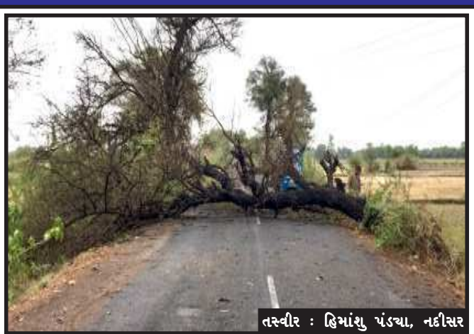
તસ્વીર : હિમાંસુ પંડ્યા, નદીસર

ગોધરા, સમગ્ર રાજ્યમાં વિપરીત અસર કરનાર વાવાઝોડા એ ગોધરા તાલુકાના પશ્ચિમ વિસ્તાર ને પણ મોડી સાંજે બાનમાં લીધો હતો અને ગત સાંજે પાંચ વાગ્યા થી રાત્રીમાં બાર વાગ્યા સુધી ભારે પવન ફૂંકાયો હતો. આશરે ૮૦ કી.મીની ઝડપે પવન અને સાથે વરસાદના કારણે પંથકના નદીસર સહિત આસપાસના ગામોમાં તૈયાર થઈ ને કાપણી રાહ જોતા તલ, બાજરી ના પાક ની વાવાઝોડા એ સોથ વાડી દીધી હતી. જ્યારે ઘણા ખેડૂતો નો પાક ખેતર માં કાપેલી