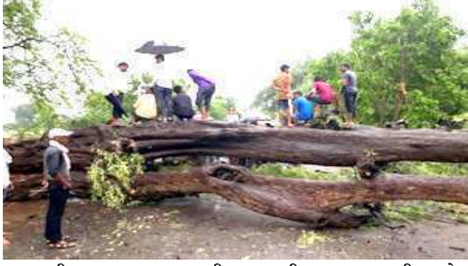
લાગવાથી થયાના સમાચાર મળી રહ્યાં છે. અમરેલીમાં ૧૫ મોત થયા છે. જેમાં મકાન ધસી પડવાથી ૨, દીવાલ પડવાથી ૧૩ લોકોનાં મોત થયા છે. ભાવનગરમાં ૮ મોત નીપજ્યાં છે. જેમાં ૭૫ પડવાથી ૨, મકાન ધસી પડવાથી ૨, દીવાલ પડવાથી ૩, છત પડવાથી ૧ મોત થયા છે. ગીર સોમનાથમાં ૮ મોત નીપજ્યાં છે. જેમાં ૭૫ પડવાથી ૨, મકાન ધસી પડવાથી ૧, દીવાલ

જવાથી, વલસાડમાં ૧ મૃત્યુ દીવાલ પડવાથી, રાજકોટમાં ૧ મૃત્યુ દીવાલ પડવાથી, નવસારીમાં ૧ મૃત્યુ છત પડવાથી, પંચમહાલમાં ૧ મૃત્યુ ઝાડ પડી જવાથી થયું છે. સોમવારે ૮.૩૦ કલાકની આસપાસ દીવ નજીક ત્રાટકેલા વાવાઝોડાએ મંગળવારે રાતે આશરે ૧.૧૦ કલાકે ગુજરાતમાંથી વિદિય લઈને રાજસ્થાન પહોંચ્યું હતું. રાજ્યમાં આવ્યું ત્યારે તે વેરી સિવિયર સાયક્લોનિક સ્ટ્રોમ હતું અને ગુણવત્તા ડીપ ડિપ્રેશનમાં ફેરવાઈને ગયું છે. વાવાઝોડાએ સૌપ્રથમ સૌરાષ્ટ્રમાં તારાજ સર્જ્યા બાદ દક્ષિણ ગુજરાત, ત્યારબાદ અમદાવાદ અને ઉત્તર ગુજરાતમાં તારાજ સર્જી છે. કેટલીક જગ્યાએ ઘરોના પતરા-નળીયા નીકળી ગયા તે ક્યાંક ઝાડ અને વીજપોલ પડી ગયા.