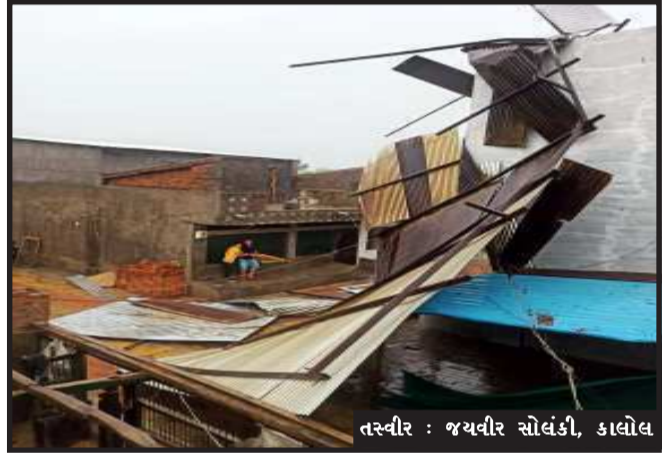
એન્ડ બી ના ઈલેક્ટ્રીકલ એન્જિનિયરને એલર્ટ પર રાખવામાં આવ્યા છે. આ ઉપરાંત, તમામ નગરપાલિકા વિસ્તારો અને ગ્રામ્ય વિસ્તારોમાં પણ ભારે પવન કે વરસાદના કારણે પડી જઈ ભયજનક બની શકતા હોર્ડિંગ્સ, થાંભલા ઉતારી લેવામાં આવ્યા છે. ગ્રામ્ય વિસ્તારોમાં સરપંચ, તલાટીના

કાલોલ, અરબ સમુદ્રમાં ઉદભવેલા તાઉ-તે ચક્રવાતના પગલે પંચમહાલ જિલ્લામાં કલેક્ટર અમિત અરોરાના માર્ગદર્શન હેઠળ વહીવટી તંત્ર દ્વારા સલામતીના આગોતરા પગલા હાથ ધરવામાં આવ્યા છે. હાલની સ્થિતિએ જિલ્લામાં આ ચક્રવાતના પગલે કોઈગંભીર અસરની આગાહી ન હતી. પરંતુ કોઈપણ સંભવિત વિપરીત પરિસ્થિતિને પહોંચી વળવા જિલ્લા વહીવટીતંત્ર દ્વારા મહત્વપૂર્ણ સેવાઓ ખોરવાઈ નહીં તે સુનિશ્ચિત કરવા સહિતની કામગીરી હાથ ધરવામાં આવી છે. આ પૂર્વ તૈયારીઓની સમીક્ષા હાથ ધરતા જિલ્લા કલેક્ટર અમિત અરોરાએ ભારે પવનો કે વરસાદની સ્થિતિમાં વીજપુરવઠાને લગતા પ્રશ્નો હોસ્પિટલ્સ સહિતના અગત્યના સ્થળોએ ન સર્જાય તે માટે ઉર્જ વિભાગના તેમજ અર