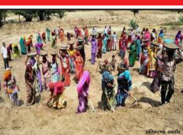
ભ્રષ્ટાચારમાં વગોવાચલી મનરેગા કોરોના કાળમાં શ્રમિકોને તારણ હાર થશે ખરી ?

વેજલપુર, કાલોલ તાલુકાના વેજલપુર ગામમાં મનરેગામાં અનેક કામો ભ્રષ્ટાચારની બુમો ઉઠી છે. ત્યારે વાત કરીએ તો કાલોલ તાલુકાની મોટી ગ્રામ પંચાયત એટલે વેજલપુર ગ્રામ પંચાયત હોવા છતાં વેજલપુર ગામમાં મનરેગાના કામોમાં માત્ર કાગળ ઉપર બતાવીને અનેક વિસ્તારના કામોમાં ભ્રષ્ટાચાર આચરીને અનેક અધિકારીઓએ પોતાના વિકાસના કાર્યો કર્યા હોય તેવા અનેક વિસ્તારના કામો માત્રને માત્ર કાગળ ઉપર બતાવીને વેજલપુર ગામની ભોળી જનતાને આવા ભ્રષ્ટ અધિકારીઓએ મૂર્ખ બનાવીને લાખો રૂપિયા બનાવી લીધા હોય તેમ લાગી રહ્યું છે અને