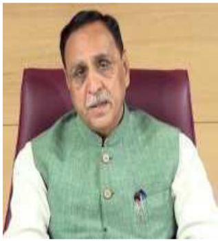
ગાંધીનગર, ગુજરાતમાં તોફાન મચાવી વાવાઝોડું તોફાને આગળ વધી રહ્યું છે. આપત્તીકાલે સવાળ સુધીમાં ગુજરાતમાંથી તોફાન પસાર થઈ જશે. મુખ્યમંત્રી વિજય રૂપાણીએ પત્રકાર પરિષદ યોજી આ માહિતી આપી છે. રાજ્યમાં વાવાઝોડાને કારણે ખુબ નુકસાન પડા થયું છે. આ દરમિયાન ૧૩ લોકોના મૃત્યુ પડા થયા છે. અનેક વૃક્ષો

તોફાને વાવાઝોડાએ નુકસાન કર્યું છે. આ દરમિયાન ૧૩ લોકોના મૃત્યુ થયા છે. તો અનેક જગ્યાએ વાવાઝોડાને કારણે ઝાડ ઘરાશાયી થઈ ગયા છે. લાઈટોને નુકસાન પહોંચ્યું છે. રાજ્યભરમાં ૫૯૫૧ ગામમાં વીજ પુરવઠો ખોરવાયો હતો. જેમાંથી ૨૧૦૧ ગામમાં શરૂ કરી દેવામાં આવ્યો છે. ૧૬૫ સબસ્ટેશનને નુકસાન પહોંચ્યું છે. ૯૫૦ ટુકડીઓ ઈલેક્ટ્રિસિટી