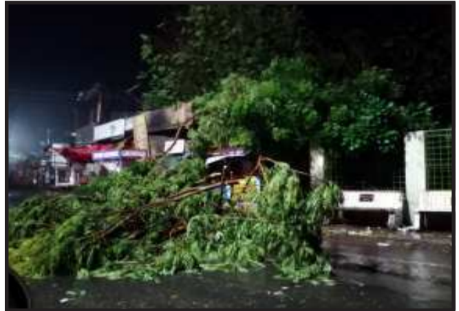
જીલ્લામાં જોવા મળી છે. અને ઘોઘમાર વરસાદ વરસી રહ્યો છે. પવનના સુસવાડી સાથે વરસાદ વરસાદને લઈ વાતાવરણમાં ઠંડક પ્રસરી જવા પામી છે. ગુજરાતના સૌરાષ્ટ્રના રાણપુલા, ઉના, ગીર સોમનાથ વચ્ચે દરિયા કિનારે ટકરાયું હતું. ૧૭૦

ગોધરા, પંચમહાલ જીલ્લામાં તાઉ તે વાવાઝોડાની અસર જોવા મળી છે. વાવાઝોડું દરિયા કિનારે ત્રાટક્યું તે પહેલા ધીમીધારે વરસાદ અને પવન ફુંકાવવાનું ચાલુ રહ્યું હતું. તોડી રાત્રીએ તાઉ તે વાવાઝોડું, સૌરાષ્ટ્રના દરિયા કાંઠે ટકરાતા તબાહી મચાવીને આગળ વધ્યું છે. વાવાઝોડાની અસર રાજ્યભરમાં જોવા મળી છે. પંચમહાલ જીલ્લામાં વહેલી સવાર થી ધીમીધારે તો કોઈ તાલુકામાં ધમાકેદાર રીતે વરસાદ જોવા મળ્યો છે. જીલ્લા વહીવટી તંત્ર દ્વારા તાઉ તે વાવાઝોડાની અસરને પહોંચી વળવા માટે સર્તક બન્યું છે. આજે સમી સાંજે ઉત્તર ગુજરાતમાં ૬૦ થી ૭૦ કિલોમીટરની ઝડપી પવન ફુંકાતા તેની અસર પંચમહાલ