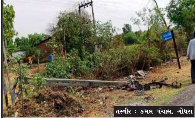
પંચમહાલ જીલ્લામાં તાઉ તે વાવાઝોડાની અસરને લઈ છેલ્લા ૨૪ કલાકમાં ૭૫ હાઈટેન્શન લાઈનના વીજ પોલ તેમજ ૨૭ સાદી લાઈનના વીજપોલ ધરાશાયીની ઘટના બનવા પામી છે. વાવાઝોડામાં ગોધરા સર્કલના ૬૨ ગામોમાં વીજ પુરવઠો ખોરવાતા વીજ કંપનીને વીજ પુરવઠો શરૂ કર્યો હતો.