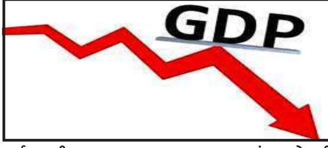
માર્ગ પર હતી. નાણાકીય વર્ષ ૨૦૨૦-૨૧માં દેશની અર્થવ્યવસ્થામાં ઘટાડો થવાનું

ન્યુ દિલ્હી, નાણાકીય વર્ષ ૨૦૨૦-૨૧માં દેશનો GDP ૭.૩ ટકાનો ઘટાડો થયો છે. જોકે, ગયા નાણાકીય વર્ષના ચોથા ક્વાર્ટરમાં GDPમાં ૧.૬ ટકાનો વધારો થયો છે. આ સૂચવે છે કે કોરોનાની બીજી લહેર પહેલા દેશની અર્થવ્યવસ્થા રિકવરીમાં