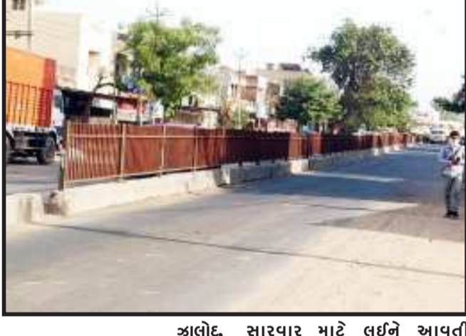
ઝાલોદ, ઝાલોદ નગરમાં પાલિકા દ્વારા બસ સ્ટેશનથી લઈને ફુલીકંકાસીયા ચોકડી સુધી હાઈવેના રસ્તા પર કિવાઈડર ઉભા કરવામાં આવ્યા હતા. પાલિકા દ્વારા હાઈવેને અડીને આવેલા રાધિકા હોસ્પિટલ, ઘૂલ હોસ્પિટલ અને સંજીવની હોસ્પિટલ આગળના કિવાઈડરમાં કટ મુકવા બાબતે જવાબદાર વિભાગોને લેખિતમાં રજુઆતો કરવા છતાં કોઈ કાર્યવાહી કરવામાં આવી ન હતી. ત્યારે હાલમાં કોરોના મહામારીના સમયમાં જિલ્લા વહીવટી તંત્ર દ્વારા મંજૂરી આપવામાં આવતા ઝાલોદની હોસ્પિટલોમાં કોવીડની સારવાર શરૂ કરાઈ હતી. પરંતુ રાધિકા હોસ્પિટલ, ઘૂલ હોસ્પિટલ અને સંજીવની કોવીડ હોસ્પિટલો આગળના કિવાઈડરમાં કટ ન હોવાના કારણે દર્દીઓને ભારે હાલાકી ભોગવવી પડી રહી છે. કિવાઈડરમાં કટના અભાવે