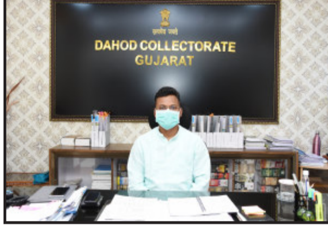
DAHOD COLLECTORATE GUJARAT