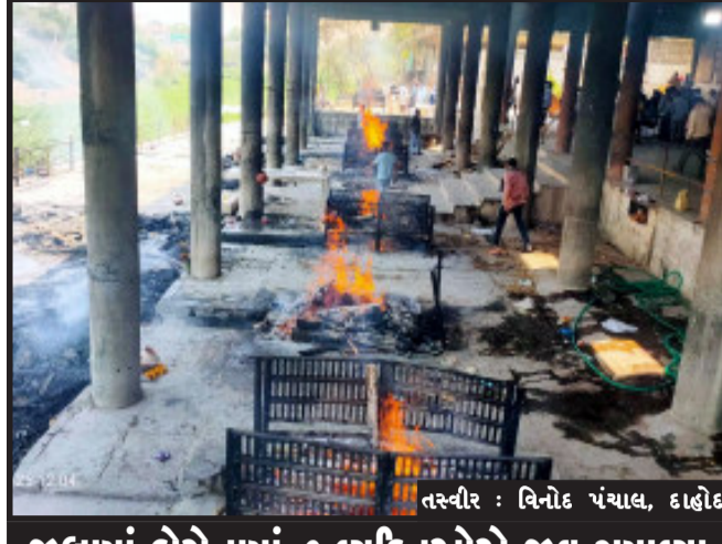
જીલ્લામાં કોરોનામાં ૭ વ્યક્તિઓએ જીવ ગુમાવ્યા

દાહોદ, દાહોદ જિલ્લામાં આજે વધુ ૧૧૫ કોરોના પોઝીટીવ કેસો નોંધાયા છે. આ ૧૧૫ પૈકી દાહોદ અર્બન વિસ્તારમાંથી ૨૫ કેસો સૌથી વધુ સમાવેશ થયો છે. દાહોદ ગ્રામ્ય વિસ્તાર સાથે સાથે હવે કોરોનાથી ફરીવાર શહેરી વિસ્તારોમાં માથું ઉચક્યું છે. દાહોદ શહેરી વિસ્તારમાં છેલ્લા એક - બે દિવસથી કોરોનાના કેસોમાં વધારો જોવા મળી રહ્યો છે. જે ચિંતાનો વિષય સમાન છે. આજે કોરોનાથી વધુ ૦૭ લોકોએ જીવ ગુમાવ્યાં છે પરંતુ દાહોદના સ્મશાન ગૃહમાં રોજેરોજ આના કરતાં પણ વધારો મૃતદેહોની કોરોના ગાઈડ લાઈન પ્રમાણે અંતિમ સંસ્કાર કરવામાં આવી રહ્યાં છે.