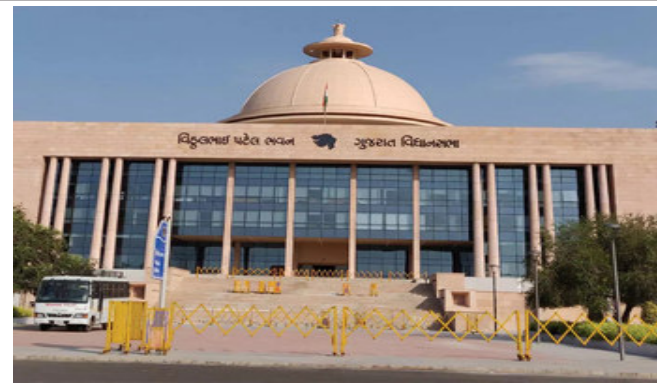
કરી હતી. ગુજરાત વિધાનસભામાં વિપક્ષના નેતા પરેશ ધાનાણીએ નિવેદન આપતાં કહ્યું હતું કે હું નખશીખ હિન્દુ છું અને હિન્દુ હોવાનું મને ગૌરવ છે. હિન્દુ ધર્મમાં ૩૩ કરોડ દેવી દેવતાઓ છે. પરંતુ મુઠ્ઠી ભર લોકો અયોધ્યામાં તમે માથું નમાવો તો જ હિન્દુ હોવાનું સર્ટીફિકેટ વહેંચવા નીકળ્યા છે. અમને તેનો વિરોધ છે. વિધાનસભામાં લવ જેહાદ પર બોલતા પરેશ ધાનાણી મુખ્યમંત્રી સુધી પહોંચ્યા હતાં. ધાનાણીએ મુખ્યમંત્રીને અભિનંદન આપતાં

ગાંધીનગર, ગુજરાત વિધાનસભામાં આજે ગૃહરાજ્યમંત્રી પ્રદિપસિંહ જાડેજાએ લવ જેહાદના કાયદાનું બિલ રજૂ કર્યું હતું. જેને અયોગ્ય