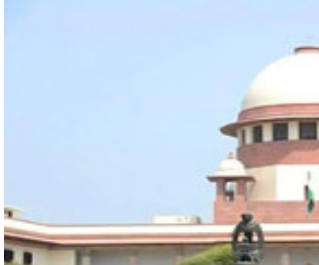
રોહિંગ્ટન એફ નરીમાનના વડપણ હેઠળની ત્રણ સભ્યોની ખંડપીઠે આ અંગે સુનાવણી કરતા ભાડુઆત દિનેશને કોર્ટ જ રાહત આપવાનો ઈકાર કર્યો હતો. સાથે જ આદેશ કર્યો કે તેણે પરિસર ખાલી કરવું જ પડશે. આ સાથે જ સુપ્રીમ કોર્ટે ભાડુઆત

ન્યુ દિલ્હી, મકાન ખાલી કરવા માટે આનાકાની કરનારા એક ભાડુઆતને સુપ્રીમ કોર્ટે રાહત આપવાનો ઈકાર કરી દીધો છે. સાથે જ સુપ્રીમ કોર્ટે ટિપ્પણી કરે છે કે જેમના પોતાના ઘર કાચના હોય તેઓ બીજાના ઘરે પર પથ્થર નથી ફેંકતા. સુપ્રીમ કોર્ટના આ નિર્ણય બાદ ફરી એક વખત સ્થિતિ થઈ ગયું છે કે મકાન માલિક જ કોઈ મકાનનો અસલી માલિક હોય છે.