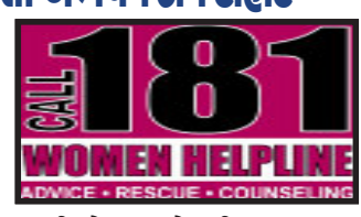
પરથી તે મધ્યપ્રદેશની જણાઈ. વધુ વાતચીતમાં કેટલાંક મધ્યપ્રદેશના ગામનો ઉલ્લેખ થતાં મહિલા અભયમ ટીમ દાહોદ પોલીસને સાથ લઈ મધ્યપ્રદેશ ઉપડી. થોડીક વધુ માહિતી મળતાં જે ગામનો મહિલા ઉલ્લેખ કરતી હતી. ત્યાંની પોલીસ અને સરપંચની મદદથી મહિલાના પરિવારજનો સુધી પહોંચી શકાયું.

દાહોદ, હેલ્થ મહિલા અભયમ હેલ્પલાઇન. અહીં એક મહિલા લોકોને પથ્થર મારે છે, ઘરમાં ઘૂસી જાય છે. દાહોદના ગરબાડાના એક અંતરિયાળ ગામમાંથી આવેલી એક મહિલાને અભયમ ટીમ તુરંત જ સ્થળ પર પહોંચી. માનસિક રીતે અસ્વસ્થ મહિલા ખેતરમાં આળોટી રહી હતી અને તેના એક હાથમાં પથ્થર હતો. પરિસ્થિતિની ગંભીરતા જોતા મહિલા અભયમ ટીમે ખૂબ ઝૂંઘેલા કામ લેવાનું હતું. કારણ કે આ મહિલા પોતાને પણ કંઈ કરી બેસે એવી મનોદશામાં હતી.