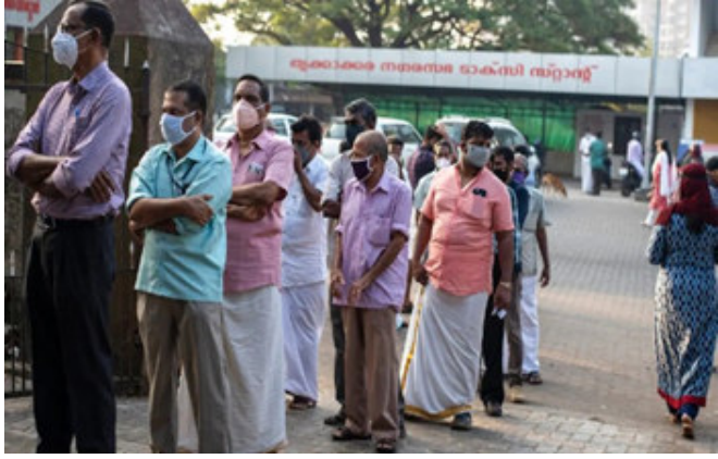
દેવામાં આવી રહ્યા. મમતાએ વડાપ્રધાન નરેન્દ્ર મોદી અને ગૃહમંત્રી અમિત શાહ પર આરોપ લગાવ્યા છે. તેમણે કહ્યું કે વડાપ્રધાન મોદી યૂંટણીના દિવસે બંગાળમાં યૂંટણી પ્રચાર કરી રીતે

કરી શકે છે? મમતાએ આરોપ લગાવ્યા હતા કે અમિત શાહ સીધા જ કેન્દ્રથી મોકલવામાં આવેલા સુરક્ષકર્મીઓને આદેશ આપી રહ્યા છે. આ યૂંટણી આચાર સંહિતાનું ઉલ્લંઘન છે.