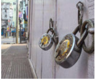
સુધી આણંદના મલાતજ અને પણસોરામાં લોકડાઉન જાહેર કરવામાં આવ્યું છે. કોરોનાનું સંક્રમણ વધતા ૧૫ દિવસ લોકડાઉન જાહેર થતાં લોકોમાં કચવાટ પણ જોવા મળી

આણંદ, ગુજરાતમાં કોરોના વાયરસનો હાહાકાર મચ્યો છે, જેમાં અમદાવાદ અને સુરતમાં દરરોજ સૌથી હાઈએસ્ટ કેસ નોંધાઈ રહ્યા છે. બીજી બાજુ એક મહત્વપૂર્ણ સમાચાર મળી રહ્યા છે. આણંદના મલાતજ અને પણસોરામાં કોરોના વાયરસથી સંક્રમિત લોકોની સંખ્યા વધી રહી છે. જેના કારણે ગ્રામ પંચાયત દ્વારા એક મહત્વપૂર્ણ નિર્ણય લેવામાં આવ્યો છે. તારીખ ૧થી ૧૫ એપ્રિલ