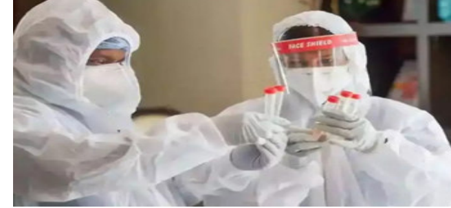
ગુરુવારે સ્વાસ્થ્ય મંત્રાલય દ્વારા રજૂ કરવામાં આવેલા આંકડા પ્રમાણે દેશમાં ૨૪ કલાકમાં કોરોનાના નવા ૭૨,૩૩૦ કેસ

ન્યુ દિલ્હી, ભારતમાં ૨૪ કલાકમાં નોંધાતા કોરોનાના કેસમાં બહુ મોટો ઉછાળો આવ્યો છે. મંગળવારે જેટલા કેસ નોંધાયા હતા તેની સરખામણીમાં બુધવારે ૧૮,૦૦૦ જેટલા વધુ કેસ નોંધાયા છે. આ સાથે મૃત્યુઆંક પર સાડા ૪૦૦ને પાર થઈ ગયો છે. ભારતમાં જે રીતે કોરોનાના કેસ વધી રહ્યા હતા તેની સાથે એક્ટિવ કેસ અને મૃત્યુઆંક પણ મોટા થઈ રહ્યા છે.