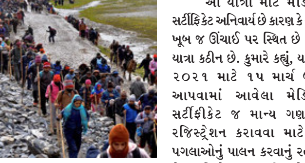
પહલગામ અને બાલટાલ માર્ગોથી ૨૮ જૂને શરૂ થશે અને ૨૨ ઓગસ્ટે સમાપ્ત થશે. આ મહિનાની શરૂઆતમાં આયોજિત એક બેઠકમાં અધિકારીઓએ કહ્યું હતું કે તમામ કોવિડ-૧૯ પ્રોટોકોલ લાગુ છે અને સરકાર દ્વારા જાહેર માપદંડોનું સંચાલન પ્રક્રિયામાં પાલન કરવામાં આવશે.