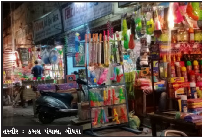
તસ્વીર : કમલ પંચાલ, ગોધરા