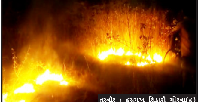
તસ્વીર : હસમુખ શિકારી મોરવા(હ)

મોરવા(હ), મોરવા(હ) તાલુકાના મેત્રાલ ગામે ખેતરમાં આગ લાગતાં દોડધામ મચી જવા પામી છે. ફાયર ટીમે પાણીનો છંટકાવ કરીને આગ ઉપર કાબુ મેળવવામાં આવ્યો છે. પ્રાપ્ત વિગતો પ્રમાણે મોરવા(હ) તાલુકાના મેત્રાલ ગામે રોડ સાઈડમાં આવેલ