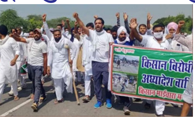
કારણે સામાન્ય જીવનમાં વધારે તકલીફ પડી ન હતી. ખેડૂત સંગઠનોના જણાવ્યા મુજબ, ૧૨ કલાકના બંધ દરમિયાન તમામ પ્રકારની દુકાનો અને વ્યવસાયિક મથકો બંધ રહેશે.

ન્યુ દિલ્હી, નવા કૃષિ કાયદા સંદર્ભે ખેડૂતોનું આંદોલન ચાલુ છે. આ આંદોલન ૨૮ નવેમ્બરથી શરૂ થઈ હતી, તેથી ૧૨૦ માર્ચે તેના ૧૨૦ દિવસ પૂરા થશે. જેના પર યુનાઈટેડ કિસાન મોરચાએ ભારત બંધની હાકલ કરી છે. આ બંધ સવારે ૬ થી સાંજના ૬ સુધી એટલે કે ૧૨ કલાક સુધી રહેશે. આ બંધ દરમિયાન ખેડૂત સંગઠનો વિવિધ સ્થળોએ રજૂઆત કરશે. તે જ સમયે, નવા કૃષિ કાયદા અને સરકારનું પુતળું દહન કરવામાં આવશે. છેલ્લી વખત, ભારત ફક્ત ત્રણ કલાક માટે બંધ રહ્યું હતું, જેના