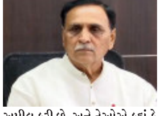
મુખ્યમંત્રી રૂપાણીએ કહ્યું કે આ અઠવાડિયું કેસ વધશે અને પછી ઘટશે તેવી ધારણા છે. પણ ગભરાવાની જરૂર નથી, સાવધાની જરૂરી છે. માસ્ક પહેરવા અને રસી લેવા મુખ્યમંત્રી રૂપાણીએ લોકોને

ગાંધીનગર, રાજ્યમાં કોરોના સંક્રમણ વધતાં ચાર મહાનગરોમાં નાઈટ કરફ્યુ સહિતના પ્રતિબંધો લગાવી દેવામાં આવ્યા છે. તેવામાં હાલમાં વિધાનસભા સત્રમાં ધારાસભ્યો અને તેમના સ્ટાફ કોરોનાથી સંક્રમિત થયા છે. તેમ છતાં સીએમ રૂપાણીએ કહ્યું છે કે વિધાનસભાનું સત્ર ટૂંકાવવામાં આવશે નહીં. કેમ કે હજુ મહત્વના બિલો પાસ થવાના બાકી છે.