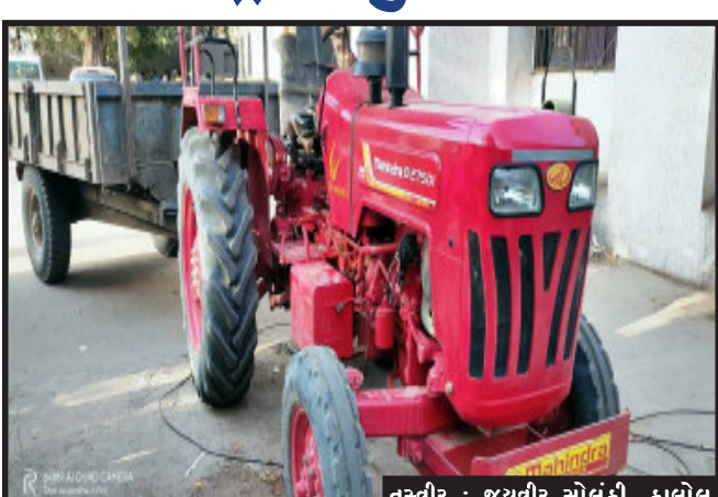
તસ્વીર : જયવીર સોલંકી, કાલોલ

કાલોલના અગાસીની મુવાડી પાસે આવેલ ગોમા નદીમાં ગેરકાયદેસર રેતી ખનન કરતા ખનિજ માફિયાઓ પર છાપો મારવા ગયેલી કાલોલ મામલતદારની ટીમ પર ખનન માફિયાઓના મળતિયા માથાભારે લોકોએ કર્યો હુમલો.