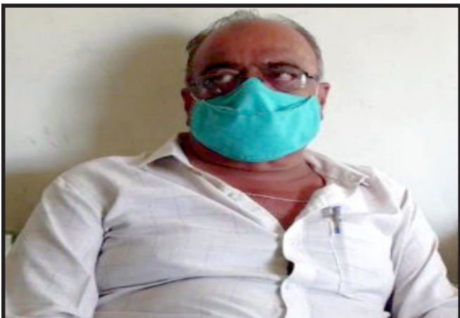
મહિસાગર એસીબી વિભાગે ટ્રેપ મકાન ભાડા પેટેની એક ભાડાની રકમ ૩૨,૦૦૦/- રૂપિયાની

હાલોલ પંચકમાં કન્યા છાત્રાલય માટે ભાડે આપનાર મકાન માલિક પાસેથી જીલ્લા આદિજાતિ વિકાસ મદદનિશ કમિશ્નર દ્વારા અરજદાર પાસેથી બે ભાડાની રકમ લાંચમાં માંગતા હોય અરજદાર લાંચની રકમ આપવા ન માંગતા હોય જેને લઈ અરજદારે લાંચ રૂપવત વિભાગના ટોલ ફ્રી નંબર ઉપર ફરિયાદ કરી હતી. જેને આધારે