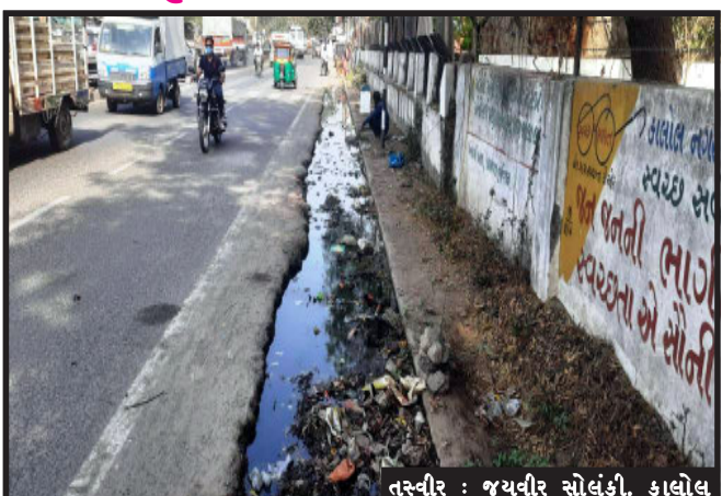
તસ્વીર : જયવીર સોલંકી, કાલોલ

કાલોલ, નગરમાંથી પસાર થતી ગટરો કાલોલ નગરમાં ફરી કાલોલ નગરમાં આવેલ કોરોનાનો કેર વકરી રહ્યો છે. ત્યારે કાલોલ નગરમાં આવેલ MGVCCL નાં કોટની પાસેથી પસાર થતા કાલોલ-હાલોલ રોડ પાસેથી પસાર થતી ગટરો લાઈન સાફસફાઈ થતાં ગટર ઊભરાઈ આવી છે. હાલ કાલોલ