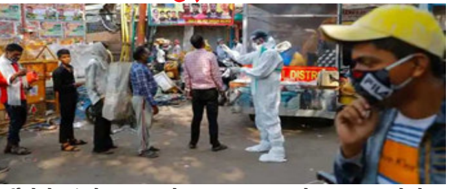
દર્દીઓનો આંકડો ૫૦ હજારને પાર પહોંચી ગયો છે જે ખરેખર ડરામણો છે. સાથે જ કોરોના વેક્સીનેશન પણ પોતાની ગતિએ ચાલી રહ્યું છે. છેલ્લા ૨ મહિનામાં

ન્યુ દિલ્હી, ભારતમાં કોરોના વાયરસ ફરી એકવાર બેકાબુ બન્યો હોય તેવી સ્થિતિ ઉભી થઈ છે. કોરોના વાયરસના કેસ વધતા રોજ નવા રેકોર્ડ બની રહ્યા છે. છેલ્લા ૨૪ કલાકમાં દરેક એકવાર ૫૩ હજારથી વધારે લોકો કોરોના પોઝિટિવ જણાયા છે. લગભગ ૫ મહિના બાદ ભારતમાં કોરોનાના