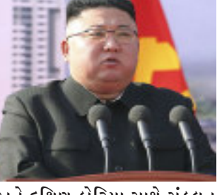
અને દક્ષિણ કોરિયા સાથે સંકલન જાળવી રાખશે. દક્ષિણ કોરિયાના જોઈન્ટ ચીફ ઓફ સ્ટાફે જણાવ્યું કે, સવારે ૭:૦૬ કલાકે અને ૭:૨૫ કલાકે ઉત્તર કોરિયાના પૂર્વીય તટ પર મિસાઈલ લોન્ચ થઈ હતી. આ મિસાઈલોએ સમુદ્રમાં પડતા પહેલા ૪૫૦ કિમીનું અંતર કાપ્યું હતું. અમેરિકા હિંદ-પ્રશાંત કમાનના પ્રવક્તા કેપ્ટન માર્ક

સિયોલ, અમેરિકામાં રાષ્ટ્રપતિ જો બાઈડેને પદભાર સંભાળ્યો ત્યાર બાદ ગુરુવારે પ્રથમ વખત ઉત્તર કોરિયાએ બેલેસ્ટિક મિસાઈલનું પરીક્ષણ કર્યું હતું. અમેરિકા સાથેની કૂટનીતિમાં ઘર્ષણ બાદ ઉત્તર કોરિયાનું આ પગલું જો બાઈડેન પ્રશાસન પર દબાણ બનાવવા અને પોતાની સૈન્ય ક્ષમતામાં વધારો કરવા ફરી પરીક્ષણ શરૂ કરવાનો સંકેત આપે છે. જાપાનના વડાપ્રધાન યોશિહિદે સુગાએ કહ્યું કે, આ પરીક્ષણ "જાપાન તથા ક્ષેત્રમાં શાંતિ અને સુરક્ષા" માટે જોખમી છે તથા ટોક્યો ઉત્તર કોરિયાની ગતિવિધિઓ મામલે અમેરિકા