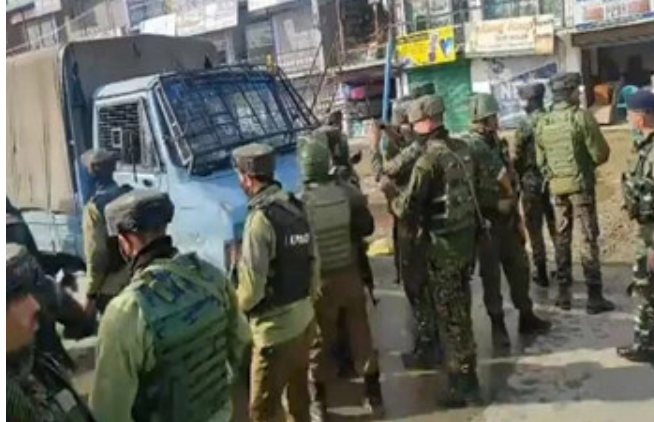
કહ્યું કે આ હુમલામાં સીઆરપીએફના બે જવાન શહીદ થઈ ગયા અને બે જવાન ઘાયલ થયા છે.

શ્રીનગર, શ્રીનગરમાં સીઆરપીએફની પેટ્રોલિંગ પાર્ટી પર આતંકી હુમલો થયો છે. આ હુમલો લાવાપોરા વિસ્તારમાં થયો છે. સીઆરપીએફ પાર્ટી પર હુમલામાં બે જવાન શહીદ થયા જ્યારે બે જવાન ઘાયલ પણ થયા. ઘાયલ જવાનોને હોસ્પિટલમાં દાખલ કરાયા છે.