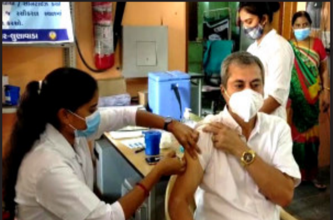
આ અંતર્ગત જિલ્લા ડિસ્ટ્રિક્ટ અને સેશન્સ જજ એચ એ દવે અને તેમની પત્ની સાથે કોરોના વેકસીન લેવાની તસવીર

લુણાવાડા, રાજ્યભરમાં કોરોના વેકસીનેશનનું કામ પુરજોશમાં ચાલી રહ્યું છે. ત્યારે મહીસાગર જિલ્લામાં પણ કોરોના પ્રતિરોધક રસીકરણની કામગીરીને ઝુંબેશ રૂપે ઉપાડવામાં આવી છે. જે અન્વયે જિલ્લા ડિસ્ટ્રિક્ટ અને સેશન્સ જજ એચ એ દવે તેમની પત્ની સાથે લુણાવાડા અર્બન હેલ્થ સેન્ટર ખાતે જઈ કોરોના વેકસીનનો પ્રથમ ડોઝ લઈ અભ્યંતરે પ્રેરણા પૂરી પાડી હતી. આ પ્રસંગે જિલ્લા ડિસ્ટ્રિક્ટ અને સેશન્સ જજ એચ એ દવે એ આમ લોકોને સંદેશો પાઠવતા જણાવ્યું હતું કે, કોરોનાની રસી મુકાવી ખૂબ જ જરૂરી છે, રસીની કોઈ આડઅસર થતી નથી. મે અને મારી પત્નીએ એક સાથે કોરોનાની રસી મુકાવી છે, અને અમે બંને સંપૂર્ણ સ્વસ્થ છીએ, રસીની કોઈ જ આડઅસર નથી. કોરોનાની રસી મુકાવ્યા પછી પણ અમે મારસ્ક પહેરવું, સામાજિક અંતર જાળવવું જેવી આરોગ્ય વિભાગની સૂચનાનું સુસ્ત રીતે પાલન કરવું જોઈએ તો જ અસરો ઓછી થાય છે. અમે આપણી રસી મુકાવી છે અને અમે બંને સંપૂર્ણ સ્વસ્થ છીએ.