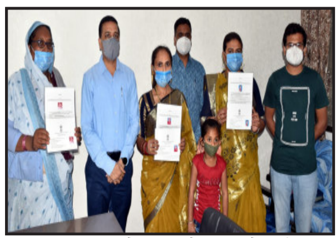
ગોધરા, સમાજમાં સ્ત્રી પુરૂષ વચ્ચે વસવાટ કરતા ટ્રાન્સજેન્ડર પણ સૌ લોકો વચ્ચે જોડાઈ શકે, તેઓને પણ સમાન અધિકાર મળી શકે તે માટે રાજ્યસરકાર દ્વારા ટ્રાન્સજેન્ડર એક્ટ પ્રોટેક્શન ઓફ ડાઈવર્સ-૨૦૧૯ બહાર પાડવામાં આવ્યો હતો. આ કાયદા અંતર્ગત રાજ્યમાં વસતા ટ્રાન્સજેન્ડરના હકો અને અધિકારોનું રક્ષણ કરવાનો મૂળ ઉદ્દેશ્ય હતો. આ કાયદા અન્વયે ટ્રાન્સજેન્ડરને તેઓનું જાતિ અંગેનું વિશેષ ઓળખપત્ર જિલ્લા કલેક્ટર દ્વારા ઇસ્તુ કરવામાં આવે છે. જેને લઈને આ વર્ષ પણ સરકારનું મહત્વની યોજનાઓનો લાભ મેળવી શકે. ત્યારે પંચમહાલ જિલ્લામાં આ કાયદા હેઠળ ગોધરા શહેરમાં વસતા છ જેટલા ટ્રાન્સજેન્ડરને જિલ્લા સમાજ સુરક્ષા અધિકારીની કચેરી ખાતે ગોધરા પ્રાંત અધિકારી વી.આર. સક્સેનાના હસ્તે ઓળખપત્ર એનાયત કરવામાં આવ્યા હતા. આ ઓળખપત્ર દ્વારા મહત્વના એવા આધારકાર્ડ, ચૂંટણીકાર્ડ સહિતના અન્ય દસ્તાવેજો સરળતાથી મેળવી શકાશે, પંચમહાલ જિલ્લામાં સૌ પ્રથમ છે. જેટલા ટ્રાન્સજેન્ડરને આ પ્રકારના ઓળખપત્ર ઇસ્તુ કરવામાં આવ્યા છે. જિલ્લામાં જે પ્રમાણે અરજી મળશે તેમ આ પ્રકારના વિશેષ ઓળખપત્ર ઇસ્તુ કરવામાં આવશે.