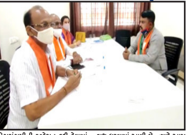
પેટાચૂંટણીની જાહેરાત કરી દેવામાં આવી છે. ત્યારે ભાજપ દ્વારા પણ ઉમેદવારની પસંદગીને લઈને કવાચત

મોરવા(હ), મોરવા(હ) વિધાનસભાની ચૂંટણીનું બચુગલ ફુંકાઈ ગયું છે. જેને લઈ ભાજપ દ્વારા ઉમેદવારની પસંદગી પ્રક્રિયા હાથ ધરવા અંગેની બેઠક ગોધરા ખાતે આયોજન કરવામાં આવી હતી. જેમાં ત્રણ જેટલા પ્રદેશ નિરીક્ષકોએ અપેક્ષિત કાર્યકર્તાઓને સાંભળ્યા હતા. મોડીસાંજ સુધી ઉમેદવારની પસંદગીને લઈને કાર્યકર્તાઓ પાસેથી સેન્સ લેવામાં આવ્યા હતા. દરમિયાન મોટી સંખ્યામાં ભાજપી કાર્યકરો હાજર રહ્યા હતા.