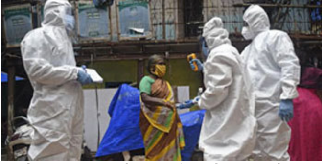
આંકડો ૨ લાખ ૧૦ હજારને પાર પહોંચી ગયો છે. કોરોનાના કેસ કાબૂમાં લાવવા માટે મહારાષ્ટ્ર

સહિતના કેટલાક રાજ્યોમાં કડક પગલા ભરવાનું શરૂ કરવામાં આવ્યું છે.