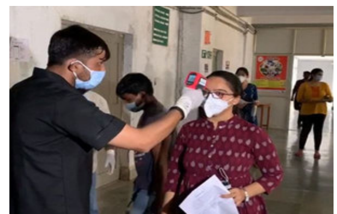
શાળાઓ શરૂ થઈ ગઈ છે. જોકે વિદ્યાર્થી તેમજ શિક્ષકો માટે સ્કૂલમાં પ્રવેશતાં જ સરકારી ગાર્ડલાઈન-સનું પાલન કરવું ફરજિયાત છે, જેમ કે એક બેન્ચ

અમદાવાદ, આગામી ૪ મેથી ધોરણ-૧૦ અને ૧૨ની બોર્ડ પરીક્ષા શરૂ થશે, જેને લઈને શિક્ષણ વિભાગ તેમજ તંત્ર સજ્જ થઈ રહ્યાં છે. કોરોના વચ્ચે પરીક્ષા લેવામાં આવતાં વિદ્યાર્થીઓની સુરક્ષા માટે કેટલાક નિયમો બનાવવામાં આવ્યા છે, જેમાંથી એક છે કે પરીક્ષા સમયે ક્લાસરૂમમાં બેસતાં પહેલાં વિદ્યાર્થીઓનું ટેમ્પરેચર ચેક કરવામાં આવશે અને જે વિદ્યાર્થીઓનું ટેમ્પરેચર વધારે જણાશે તો તેને અલગ રૂમમાં બેસાડીને પરીક્ષા આપવાની રહેશે. રાજ્યની મોટા ભાગની