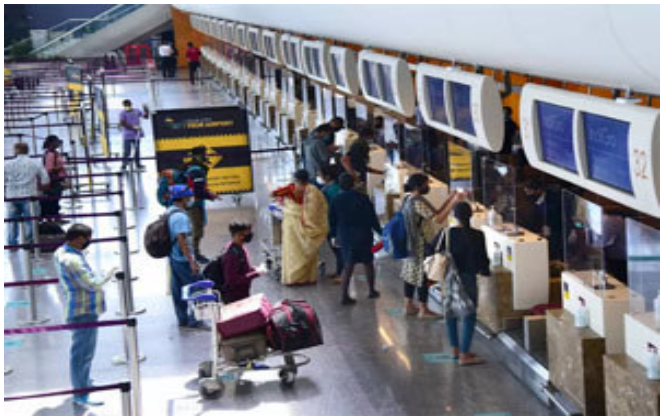
સરકારે ખાનગીકરણ માટે વધુ ૧૩ એરપોર્ટની પસંદગી કરી છે. ૨.૫ લાખ કરોડની મૂડી ભેગી કરવા માટે સરકારે એરપોર્ટના ખાનગીકરણનો નિર્ણય કર્યો હોવાનું જાણવા મળ્યું છે.

નાગરિક ઉડ્ડયન મંત્રાલય દિલ્હી, મુંબઈ, બેંગલુરુ અને હૈદરાબાદ એરપોર્ટમાં એરપોર્ટ ઓથોરિટીની હિસ્સેદારી વેચવા કેબિનેટની મંજૂરી લેશે. ટૂંક સમયમાં કેબિનેટમાં આ મુજબનો પ્રસ્તાવ લાવવાની પણ વાત ચાલી રહી છે. આ ચાર એરપોર્ટનું સંચાલન ખાનગી સેક્ટરની સાથે જોઈન્ટ વેન્યુરમાં કરાઈ રહ્યું છે. સુગોના જણાવ્યાનુસાર જે ૧૩ એરપોર્ટને ખાનગીકરણ માટે પસંદ કરાયા છે તેમાંથી નફાકારક અને બિન નફાકારકવાળા