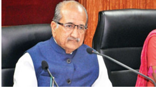
વિદ્યાર્થીઓ અને શિક્ષકોને કોરોના થવા પર તાત્કાલિક સારવાર મળી રહે તેવી વ્યવસ્થા કરાવી કરાઈ હોવાનું જણાવ્યું હતું. શિક્ષણ મંત્રીએ આ મામલે પ્રતિક્રિયા આપતા કહ્યું કે, સ્કૂલોમાં કોરોનાના કેસ મળી આવતા શિક્ષણ વિભાગ સક્રિય થયું છે અને સ્કૂલોમાં કોરોનાનું સંક્રમણ ન ફેલાય તે માટે કોવિડ સંદર્ભની એસઓપીનું ચૂસ્ત પાલન થાય તે માટે આદેશ આપવામાં આવ્યો છે. સાથે જ જે બાળકો અને શિક્ષકો સંક્રમિત થયા તેમને તાત્કાલિક સારવાર મળે તેવી વ્યવસ્થા કરાવામાં આવી રહી છે. ઉપરાંત ભવિષ્યમાં કોરોના સંક્રમણ ન ફેલાય, તે માટે શિક્ષણ અને આરોગ્ય વિભાગ સંકલનમાં હોવાનો દાવો તેમણે કર્યો અને સંક્રમણ શૂન્ય થાય તેવા પ્રયાસ કરી રહ્યા હોવાનું જણાવ્યું હતું.

ગાંધીનગર, કોરોના વાયરસના કેસો ઓછા થતા રાજ્યમાં જન્યુઆરી મહિનામાં ધોરણ ૧૦ અને ૧૨ના વિદ્યાર્થીઓ માટે સ્કૂલોમાં શૈક્ષણિક કાર્ય શરૂ કરાયું હતું. આ બાદ તબક્કાવાર અન્ય ધોરણના ક્લાસ શરૂ થયા. જોકે મહાનગરપાલિકા અને સ્થાનિક સ્વરાજ્યની ચૂંટણી પૂરી થયા બાદ રાજ્યના અલગ-અલગ શહેરો અને જિલ્લાઓમાં કોરોનાના કેસોમાં ઉછાળો જોવા મળી રહ્યો છે. જેને લઈને વાલીઓ, વિદ્યાર્થીઓની તથા શિક્ષણ જગતમાં પણ ચિંતાનું મોજું ફરી વળ્યું છે. ત્યારે પહેલીવાર શિક્ષણ મંત્રી તરફથી શાળામાં કોરોનાનું સંક્રમણ ફેલાવવા બાબતે એસઓપીનું ચૂસ્ત પાલન કરાવવા તથા