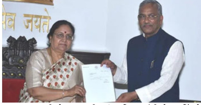
ધારાસભ્ય દળની બેઠક આવતી કાલે સવારે ૧૧ વાગ્યે મળશે. ધનસિંહ રાવત વર્તમાન સરકારમાં

દહેરાદૂન, ઉત્તરાખંડમાં છેલ્લાં સપ્તાહથી રાજકીય ઉથલપાથલ જોવા મળી રહી છે, જે બાદ મુખ્યમંત્રી ત્રિવેન્દ્રસિંહ રાવતે રાજીનામું આપી દીધું છે. તેઓએ થોડાં સમય પહેલાં જ રાજભવન પહોંચીને રાજ્યપાલ બેબી રાની મોર્ય સાથે મુલાકાત કરી જ્યાં તેઓએ પોતાનું રાજીનામું આપી દિધું છે. ઉચ્ચ શિક્ષણ મંત્રી ધનસિંહ રાવતને નવા મુખ્યમંત્રી બનાવવામાં આવી શકે છે. પાર્ટીના