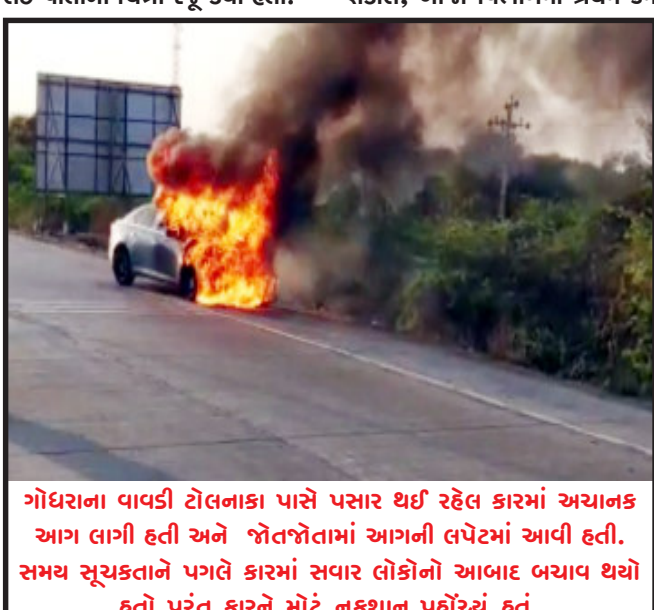
ગોધરાના વાવડી ટોલનાકા પાસે પસાર થઈ રહેલ કારમાં અચાનક આગ લાગી હતી અને જોતજોતામાં આગની લપેટમાં આવી હતી. સમય સૂચકતાને પગલે કારમાં સવાર લોકોનો આબાદ બચાવ થયો હતો પરંતુ કારને મોટું નુકશાન પહોંચ્યું હતું.