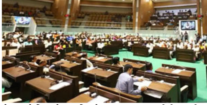
કોન્ટ્રાક્ટ કે ફિક્સ પે આધારિત છે અને સરકાર સીધી ભરતી કરવાથી દૂર ભાગી રહી છે. રૂપાણી સરકારમાં ૬.૫ લાખથી વધુ કર્મચારીઓ ફિક્સ પે, આઉટસોર્સિંગ કે કોન્ટ્રાક્ટ આધારિત કામ કરતા હોવાનો વિપક્ષ નેતાનો દાવો.

ગાંધીનગર, રાજ્ય સરકારની મહત્વની સેવાઓ ફિક્સ પે અને કોન્ટ્રાક્ટ આધારિત હોવાથી યુવાનોને અન્યાય થયાનો વિપક્ષ નેતાનો આરોપ. વિધાનસભાના બજેટ સત્રના પ્રશ્નોત્તરી કાળ દરમિયાન વિપક્ષ નેતા પરેશ ધાનાણીએ આઉટસોર્સિંગ મુદ્દે સરકારની કામગીરી પર સવાલો ઉઠાવ્યા હતા. જિલ્લાઓમાં સરકારી હોસ્પિટલોમાં ખાલી જગ્યાઓ મામલે સરકારના જવાબ બાદ વિપક્ષ નેતા પરેશ ધાનાણીએ આરોપ લગાવ્યો હતો કે સરકારની મોટાભાગની સેવાઓમાં કર્મચારીઓ આઉટસોર્સિંગ,