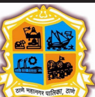
લગાવવાનો નિર્ણય લેવામાં આવ્યો છે. મુખ્યમંત્રી ઉદ્ધવ ઠાકરેએ પરિસ્થિતિની સમીક્ષા કર્યા પછી વહીવટી તંત્રએ નિર્ણય લીધો કે ૧૫ માર્ચથી જિલ્લામાં લગ્નના કાર્યક્રમોની મંજૂરી આપવામાં આવશે નહીં. જેમને પહેલાંથી જ ૧૫ માર્ચ

સુધી પરવાનગી મળી ચૂકી છે, માત્ર તેમને મંજૂરી આપવામાં આવશે. જ્યારે થાણે શહેરના ૧૧ હોટસ્પોટ પર ૧૧ માર્ચથી ૩૧ માર્ચ સુધી લોકડાઉન લાગુ કરવામાં આવ્યું છે. મહારાષ્ટ્રના ઘણા શહેરોમાં જાહેર જનતા માટે અવર-જવર પર