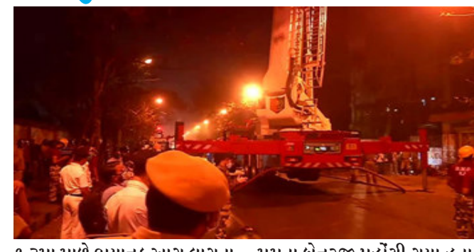
૧૩મા માળે ભયાનક આગ લાગતા ૯ લોકોનાં મોત નિપજ્યા છે. આ ઈમારતમાં પૂર્વ અને દક્ષિણ પૂર્વ રેલવેની ઓફિસ પણ આવેલી છે. ઈમારતના ગ્રાઉન્ડ ફ્લોર પર રેલવેનું કમ્પ્યુટરાઈઝ્ડ સિસ્ટમ સેન્ટર પણ આવેલું છે. ઘટનાસ્થળે ૧૫ ફાયર ટેન્ડર રવાના કરવામાં આવ્યા હતાં.

કોલકાતા, પશ્ચિમ બંગાળની રાજધાની કોલકાતામાં એક બહુમાળી ઈમારતમાં ભીષણ આગ લાગી હતી. જેમાં ૯ લોકોના મોત નિપજ્યા છે. જો કે હાલ આગ પર કાબૂ મેળવી લેવાયો છે. પશ્ચિમ બંગાળમાં એક તરફ વિધાનસભા ચૂંટણીઓનો ગરમાવો છે. ત્યાં બીજી બાજુ આગની આ ઘટનાથી આસપાસના લોકોમાં ફફડાટ ફેલાયો હતો.