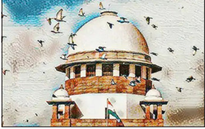
શું મરાઠા અનામત પર આ ગયા વર્ષે ૮ ડિસેમ્બરે સુનાવણીને ૧૫ માર્ચ સુધી સુપ્રિમ કોર્ટે કહ્યું હતું કે મહારાષ્ટ્રના ટાણવામાં આવી છે.

મુદ્દાઓ પર ત્વરિત સુનાવણી કરવી જરૂરી છે કારણ કે કાયદો સ્થગિત છે અને લોકો સુધી તેનો ફાયદો પહોંચી નથી રહ્યો. નોંધનીય છે કે નોંકરીઓ અને એડમિશનમાં મરાઠા સમુદાયના લોકોને અનામત આપવા માટે સામાજિક અને શૈક્ષણિક રીતે પછાત વર્ગ (એસઈબીસી) કાયદો ૨૦૧૮ને લાગુ કરવામાં આવ્યો હતો. સોમવારે મામલાની સુનાવણી દરમિયાન વકીલ મુકુલ રોહતગીએ કહ્યું કે આ મામલામાં આર્ટિકલ ૩૪૨Aની વ્યાખ્યા પણ