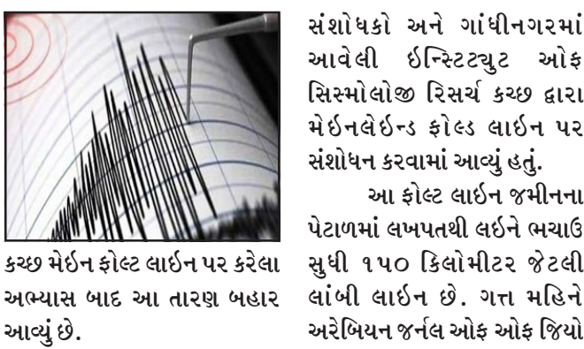
કચ્છ, કચ્છમાં આજે વહેલી સવારે ૭.૨ મિનિટે ૩.૨ તીવ્રતાનો ભૂકંપનો આંચકો અનુભવાયો હતો. જેનું કેન્દ્રબિંદુ દુધઈથી ૧૮ કિલોમીટર દુર છે. વહેલી સવારે ભૂકંપનો આવતા લોકોની હરામ થઈ ગઈ હતી અને સુતા લોકો ઝટાતે ઘરની બહાર દોડી આવ્યા હતા. અત્રે ઉલ્લેખનીય છે કે, ભૂકંપ કચ્છમાં અવારનવાર આવ્યા કરે છે. આ ફોલ્ટ લાઈન પર છેલ્લા ૧ હજાર વર્ષથી મોટા ભૂકંપ આવ્યો ન હોવાથી જમીન ઉર્જા વધી રહી છે. જે ગમે ત્યારે બહાર આવવા માટે મોટો ભૂકંપ આવી શકે છે. જેમાં કચ્છના અંજાર અને ગાંધીધામની સાથે અમદાવાદમાં પણ ભયાનક નુકસાન થવાનો અંદાજ છે. નોંધનીય છે કે, કચ્છ યુનિવર્સિટી

સંશોધકો અને ગાંધીનગરમાં આવેલી ઈન્સ્ટિટ્યુટ ઓફ સિસ્મોલોજી રિસર્ચ કચ્છ દ્વારા મેઈનલેઈન્ડ ફોલ્ટ લાઈન પર સંશોધન કરવામાં આવ્યું હતું. આ ફોલ્ટ લાઈન જમીનના પેટાળમાં લખપતથી લઈને ભચાઈ સુધી ૧૫૦ કિલોમીટર જેટલી લાંબી લાઈન છે. ગત મહિને અરેબિયન જર્નલ ઓફ ઓફ જિયો સાયન્સમાં આ અંગેનો અભ્યાસ લેખ પ્રસ્તુત કરવામાં આવ્યો હતો. આ ફોલ્ટ લાઈનમાં ક્યારે ભૂકંપના આંચકા આવ્યા તે જણાવવાનો પ્રયાસ કરાયો હતો. જેમાં આ લાઈનમાં ૫૬૦૦ વર્ષથી છેલ્લે ૧૦૦૦ વર્ષ વચ્ચે ચાર મોટા ભૂકંપના આવ્યા હોવાનું તપાસ બાદ બહાર આવ્યું હતું.