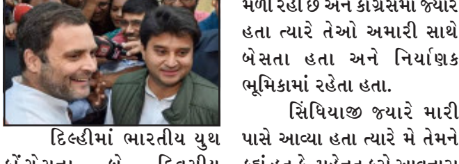
ન્યુ દિલ્હી, કોંગ્રેસના પૂર્વ નેતા જ્યોતિરાદિત્ય સિંધિયાને પાર્ટી છોડ્યે ભલે ઘણો સમય પસાર થઈ ગયો હોય, પરંતુ તેમને લઈને કોંગ્રેસના પૂર્વ અધ્યક્ષ રાહુલ ગાંધીનું નિવેદન અવારનવાર આવતુ રહે છે. રાહુલ ગાંધીએ યૂથ કોંગ્રેસના કાર્યક્રમમાં કહ્યું કે, સિંધિયા જે કોંગ્રેસમાં નિર્ણાયક ભૂમિકામાં હતા, બીજેપીમાં પાછળની સીટ પર બેઠા છે. રાહુલે કહ્યું કે, લખીને લઈલો, બીજેપીમાં સીએમ નહીં બની શકો. પાછું આવવું પડશે.

મળી રહી છે અને કોંગ્રેસમાં જ્યારે હતા ત્યારે તેઓ અમારી સાથે બેસતા હતા અને નિર્ણાયક ભૂમિકામાં રહેતા હતા. સિંધિયાજી જ્યારે મારી પાસે આવ્યા હતા ત્યારે મે તેમને કહ્યું હતું કે, મહેનત કરો આવનારા સમયમાં મુખ્યમંત્રી હશે. સૂત્રોના જણાવ્યા પ્રમાણે, રાહુલ ગાંધીએ કહ્યું કે, કોંગ્રેસ દરિયો છે. સૌ માટે દરવાજા ખુલ્લા છે અને કોઈને પાર્ટીમાં આવવાથી કોઈ નહીં રોકે અને જેઓ કોંગ્રેસની વિચારધારા સાથે મતલબ નથી રાખતા તેમને જતા પણ કોઈ નહીં રોકે.