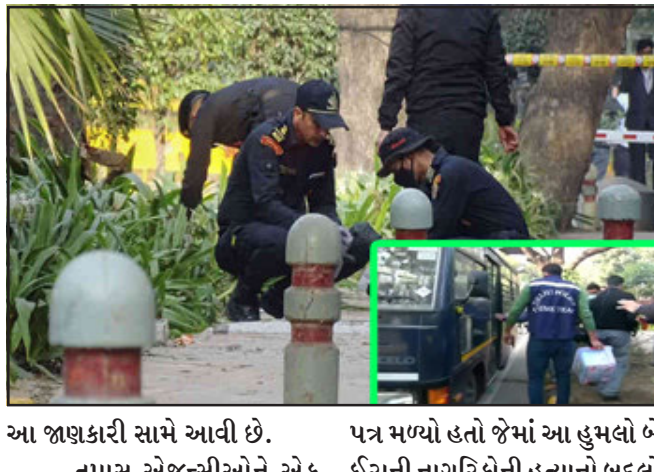
આ જાણકારી સામે આવી છે. તપાસ એજન્સીઓને એક પત્ર મળ્યો હતો જેમાં આ હુમલો બે ઈરાની નાગરિકોની હત્યાનો બદલો

લેવા કરવામાં આવ્યો હોવાનું લખેલું હતું. ત્યાર બાદ તપાસ એજન્સીઓએ અનેક એન્ગલથી આ કેસની તપાસ શરૂ કરી દીધી હતી જેમાં ઈરાનની કુદ્દસ ફોર્સે આ હુમલો કરાવ્યો હોવાનો ખુલાસો થયો હતો. એક અહેવાલ પ્રમાણે બોમ્બ વિસ્ફોટ પાછળ ઈરાનની કુદ્દસ ફોર્સેનો હાથ હતો પરંતુ તે બોમ્બ એક સ્થાનિક ભારતીય શિયા મોડ્યુલે પ્લાન્ટ કર્યો હતો. એટલું જ નહીં, જાણી જોઈને એવા પુરાવા