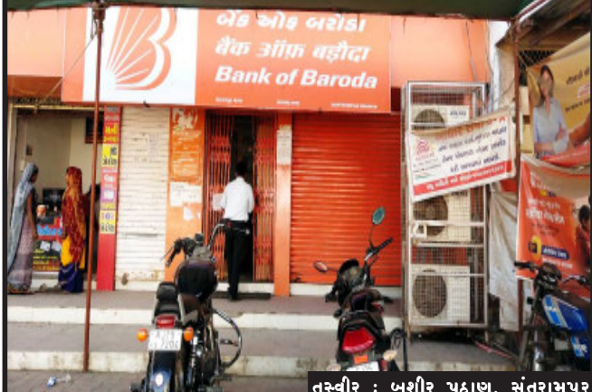
સરકારની ગાર્ડ લાઇન મુજબ સોશિયલ ડિસ્ટન્સનું પાલન કરવામાં આવતું નથી. હવે દરેક જગ્યાએ જાહેર ઓફિસમાં બસ સ્ટેશન એસટી વિભાગ ખાનગી વાહનો દુકાનો હોટલો દરેક જગ્યાએ ભીડ અને ટોળાઓ જોવા મળી રહ્યા છે. હવે સરકારી તંત્ર દ્વારા કડક વલણથી નિયમનું પાલન કરવામાં આવે તે જરૂરી બન્યું છે.

સંતરામપુર, સંતરામપુર નગરમાં બેન્ક ઓફ બરોડામાં સંતરામપુર શાખામાં છેલ્લા ઈ માસમાં બેન્કના ચોથી વાર કોરોના પોઝીટીવ આવતા તંત્ર એકશનમાં આવ્યું. સંતરામપુર બેન્ક ઓફ બરોડામાં તમામ કર્મચારીઓની કોરોના ટેસ્ટ કરવામાં આવેલા હતા. બેન્ક મેનેજરને પોઝિટિવ કેસ આવતા આજે બેન્કની સંપૂર્ણ કામગીરી બંધ રાખવામાં આવેલી હતી. વારંવાર બેન્ક ઓફ બરોડામાં કોરોનાના કેસ પોઝીટીવ આવતા ભારે ફફડાટ અને ડર જોવાયો છે. બેન્કમાં ખાતેદારો આવતા ગભરાતા હોય છે, હવે ઘરે ઘરે પૂર્ણા કેસો સંતરામપુર નગરમાં પ્રમાણ વધી રહ્યું છે.