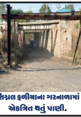
સિગ્નલ ફળીયાના ગરનાનામાં એકત્રિત થતું પાણી.

ગોધરા, લોક પ્રશ્નોને જાણવાના વિનમ્ર પ્રયાસ સાથે બિનરાજકીય નિષ્પક્ષપણે રજુ કરતી શ્રેણીના ભાગરૂપ ગોધરા પાલિકાના વોર્ડ નં.૬ની મુલાકાત લેતાં લોકોએ પોતાની લાગણી વ્યક્ત કરી હતી. આ વોર્ડમાં જહુરપુરા, ગોઠા મહોદ્દા, શિકારી મહોદ્દા, વાલી ફળીયા ૧,૨,અને૩, પોલનબજાર, દડી પ્લોટ, રાંટા પ્લોટ, મહમંદી મહોદ્દા સહિતના લઘુમતી સમાજના લોકો રહે છે. અહીં મુખ્યત્વે રસ્તાના પ્રશ્નો છે. એશિયા ખંડમાં સૌથી મોટી કબ્રસ્તાન ધરાવતો ગોધરાનો પોલનબજાર થી મજાવર રોડ સુધી સમાવેશ પામે છે. આ મહત્વનો અને જાહેર રસ્તો હોવાના કારણે વેજલપુર રોડ, વચલા ઓઢા, રાંટા પ્લોટ, પટેલ મીલ સહિતના વિસ્તારોમાંથી વાહન ચાલકો રાત-દિવસ અહીંથી પસાર થાય છે. વર્ષો પૂર્વે બનાવવામાં આવેલ રસ્તાઓની ગુણવત્તા જાળવવામાં નહીં આવતાં તથા સતત અવરજવરના કારણે આ રસ્તાની સામગ્રી બહાર આવીને તૂટકુટ