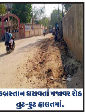
કબ્રસ્તાન ધરાવતાં મજાવર રોડ તુડ-તુડ હાલતમાં.