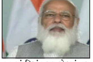
૬૬ માં દિશાંત સમારોહમાં વડા પ્રધાન નરેન્દ્ર મોદીએ વિદ્યાર્થીઓને જણાવ્યું હતું કે આ દિવસ માત્ર આઈઆઈટી ખડગપુરના ડિઝી મેળવનારા વિદ્યાર્થીઓ માટે જ મહત્વપૂર્ણ નથી પરંતુ નવા ભારત મહત્વપૂર્ણ છે. તેમણે કહ્યું કે જીવનના માર્ગ પર હવે તમે આગળ વધી રહ્યા છો, ચોક્કસ તમને પણ

ન્યુ દિલ્હી, વડા પ્રધાન નરેન્દ્ર મોદીએ આજે આઈઆઈટી ખડગપુરમાં ડો.શ્યામા પ્રસાદ મુખર્જી ઈન્સ્ટિટ્યૂટ ઓફ મેડિકલ સાયન્સ અને રિસર્ચનું ઉદ્ઘાટન કર્યું હતું અને વીડિયો કોન્ફરન્સિંગ દ્વારા આઈઆઈટી ખડગપુરના ૬૬ માં દિશાંત સમારોહને પણ સંબોધન કર્યું હતું. આ પ્રસંગે પશ્ચિમ બંગાળના રાજ્યપાલ જગદીપ ધનખાર, કેન્દ્રીય શિક્ષણ પ્રધાન રમેશ નિશંક પોખરીયલ અને કેન્દ્રીય શિક્ષણ રાજ્યમંત્રી સંજય ધોંગી અને રાજ્યના શિક્ષણ પ્રધાન ઉપસ્થિત રહ્યા છે. આઈઆઈટી ખડગપુરના