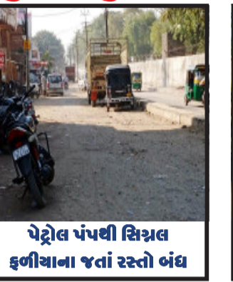
પેટ્રોલ પંપથી સિગ્નલ ફળીયાના જતાં રસ્તો બંધ