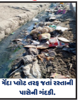
મેંદા પ્લોટ તરફ જતાં રસ્તાની પાસેની ગંદકી.