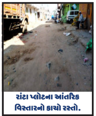
રાંટા પ્લોટના આંતરિક વિસ્તારનો કાચો રસ્તો.