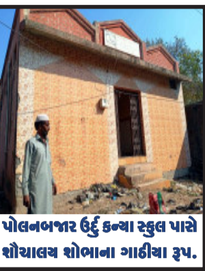
પોલનબજાર ઉદ્ધે કન્યા સ્કૂલ પાસે શૌચાલય સોભાના ગાદીયા રૂપ.