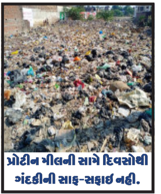
પ્રોટીન મીલની સામે દિવસોથી ગંદકીની સાફ-સફાઈ નહીં.