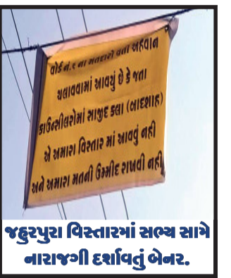
જહુરપુરા વિસ્તારમાં સભ્ય સામે નારાજગી દર્શાવતું બેનર.