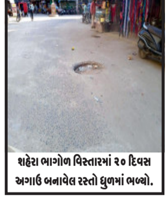
શહેરા ભાગોળ વિસ્તારમાં ૨૦ દિવસ અગાઉ બનાવેલ રસ્તો ઘુભંગ બન્યો.