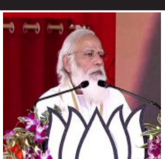
મદદ કરી, ત્યાં આ એક પ્રકારથી પરિવર્તનનું મોટું કારણ બન્યું. આપણા દેશમાં પણ આ કામ દશકાઓ પહેલા થવું જોઈતું હતું, પરંતુ ના થયું.

હુગલી, પશ્ચિમ બંગાળમાં એપ્રિલ-મેના મહિનામાં વિધાનસભા ચૂંટણી થવા જઈ રહી છે. ચૂંટણી તૈયારીઓને લઈને ભારતીય જનતા પાર્ટીએ કમર કસી લીધી છે. પ્રધાનમંત્રી મોદી સોમવારના એકવાર ફરી પશ્ચિમ બંગાળના પ્રવાસે પહોંચ્યા હતા. તેઓ બંગાળના હુગલીમાં જનસભા સંબોધિત કરવાની સાથે કોલકાતા મેટ્રોના વિસ્તારનું ઉદ્ઘાટન કરશે. એક મહિનાની અંદર પીએમ મોદીનો આ ત્રીજો બંગાળ પ્રવાસ છે. આ દરમિયાન પીએમ મોદીએ કહ્યું કે, આધુનિક ઇન્ફ્રાસ્ટ્રક્ચર, આધુનિક રેલવે, આધુનિક એરવે, આ દેશના ઈન્ફ્રાસ્ટ્રક્ચર, આ દેશને આધુનિક બનાવવામાં