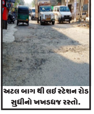
અટલ ભાગ થી લઈ સ્ટેશન રોડ સુધીનો ખખડધજ રસ્તો.