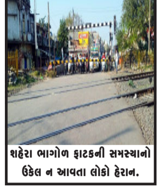
શહેરા ભાગોળ ફાટકની સમસ્યાનો ઉકેલ ન આવતા લોકો હેરાન.