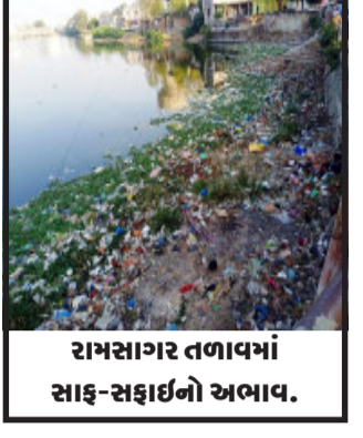
રામસાગર તળાવમાં સાફ-સફાઈનો અભાવ.