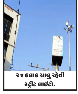
૨૪ કલાક ચાલુ રહેતી સ્ટ્રીટ લાઈટો.