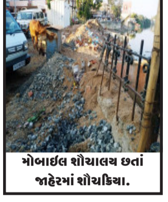
મોબાઈલ શૌચાલય છતાં જાહેરમાં શૌચક્રિયા.