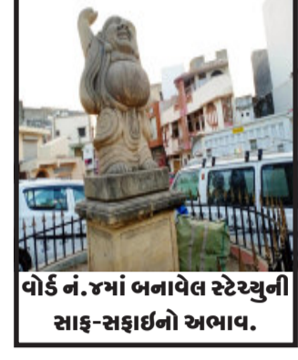
વોર્ડ નં.૪માં બનાવેલ સ્ટેચ્યુની સાફ-સફાઈનો અભાવ.