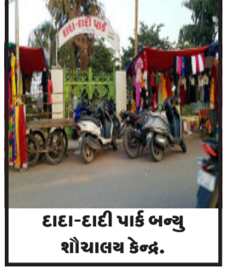
દાદા-દાદી પાર્ક બન્યું શૌચાલય કેન્દ્ર.