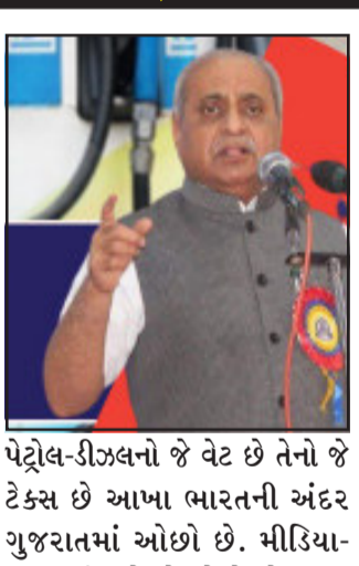
પેટ્રોલ-ડિઝલના વધતા ભાવ અંગે નીતિન પટેલે કહ્યું કે, સૌથી પહેલા ગુજરાત સરકાર તરીકે, ગુજરાતના નાણા પ્રધાન તરીકે હું કહીશ કે આખા દેશની અંદર અત્યારે

ગાંધીનગર, દેશભરમાં પેટ્રોલ-ડિઝલના ભાવ વધતા નાયબ મુખ્યમંત્રી નીતિન પટેલે પોતાની પ્રતિક્રિયા આપી હતી. નીતિન પટેલે પેટ્રોલ-ડિઝલના ભાવ વધવા અંગે કહ્યું કે, રાજ્યમાં વેટ ઓછો હોવાને કારણે ગુજરાતની પ્રજાને અમે ભાર પડવા દીધો નથી.