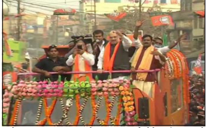
માટે ભાજપ સરકાર એક કમિટીની રચના કરશે. અમિત શાહે કહ્યું કે, બંગાળમાં જે રાજકીય હિંસાઓ થાય છે તેમાં ભાજપના ૧૩૦ કાર્યકરો માર્યા ગયા. મમતા દીદી એવું વિચારે છે કે, કોઈને મારી નાખવાથી ભાજપ અટકી જશે. હું તેમને કહેવા માંગુ છું કે, મમતા દીદી તૃણમૂલ કોંગ્રેસના ગુંડાઓએ અમારા

કોલકાતા, કેન્દ્રીય ગૃહમંત્રી અમિત શાહે ગુરૂવારે દક્ષિણ ૨૪ પરગણા જિલ્લાના કાકદ્વીપ ખાતે ભાજપની પમી પરિવર્તન રેલીને લીલી ઝંડી દેખાડી હતી. ત્યાર બાદ તેમણે દક્ષિણ ૨૪ પરગણા જિલ્લામાં એક રેલીને સંબોધિત કરી હતી અને મમતા બેનર્જીને પશ્ચિમ બંગાળમાંથી તૃણમૂલ કોંગ્રેસને ઉખાડી ફેંકવામાં આવશે તેવો પડકાર ફેંક્યો હતો.