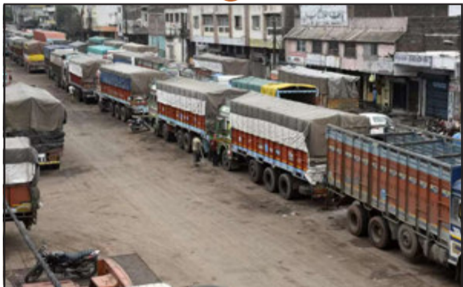
કેફેડરેશન ઓફ ઓલ ઈન્ડિયા ટ્રાન્સપોર્ટ્સ અને ઓલ ઈન્ડિયા ટ્રાન્સપોર્ટ્સ વેલફેર

ન્યુ દિલ્હી, ડિઝલના ભડકે બળતા ભાવો, ઈ-વે બિલ સંબંધિત મુદ્દાઓ અને સ્કેપિંગ પોલિસી વગેરે બાબતે ટ્રાન્સપોર્ટર્સની હડતાળ વચ્ચે હવે આ મામલો બે ભાગોમાં વહેંચાઈ રહેલો જણાઈ રહ્યો છે. એક તરફ ધ ઓલ ઈન્ડિયા મોટર ટ્રાન્સપોર્ટર્સ કોંગ્રેસએ પહેલા પોતાની વિવિધ માંગણીઓને લઈ સરકારને ૧૪ દિવસનો સમય આપ્યો હતો અને દેશવ્યાપી હડતાળ પર ઉતરવાની જાહેરાત કરી હતી.