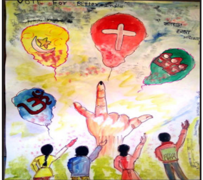
લાઈનને અનુસરીને બાકોર-પાંડરવાડાની કે. એમ. દોશી હાઈસ્કૂલ ખાતે ચિત્ર સ્પર્ધાનું આયોજન કરવામાં આવ્યું હતું. આ સ્પર્ધામાં શાળાના ૨૪ વિદ્યાર્થીની-વિદ્યાર્થીઓએ ઉત્સાહભરે ભાગ લઈને મતદાન જાગૃતિ અંગેનો સંદેશો આપતાં વિવિધ પ્રકારના ચિત્રો દોરીને

લુણાવાડા, મહિસાગર જિલ્લામાં આગામી ૨૮મી ફેબ્રુઆરી-૨૦૨૧માં જિલ્લા પંચાયતની ૨૮ બેઠકો અને જિલ્લામાં સમાવિષ્ટ છ તાલુકા પંચાયતની ૧૨૬ બેઠકોની સામાન્ય ચૂંટણી યોજાવાની છે. ત્યારે આપણા સૌનો એક જ નિર્ધાર બાકી ન રહે કોઈ મતદાર... આ હેતુને સાકાર કરવા અને સૌ ટકા મતદાન થાય અને લોકો પોતાના મતાધિકારનો ઉપયોગ કરી લોકશાહીને વધુ મજબૂત બનાવે તે માટે મહિસાગર-લુણાવાડાના જિલ્લા ચૂંટણી અધિકારી અને કલેક્ટર આર. બી. બારડના માર્ગદર્શન હેઠળ જિલ્લા પહીવટીતંત્ર દ્વારા મતદાન જાગૃતિ માટે વિવિધ કાર્યક્રમોનું આયોજન કરવામાં આવી રહ્યું છે.