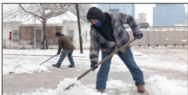
ન્યૂયોર્ક, અમેરિકાના ટેક્સાસ અને મેક્સિકોમાં ખતરનાક બર્ફીલા તોફાનના કારણે સ્થિતિ ખૂબ જ ગંભીર બની ગઈ છે. સતત થઈ રહેલી ડિમવર્ષાના કારણે અત્યારસુધીમાં ૨૧ લોકોના મોત થયા છે. ટેક્સાસમાં ૪૪ લાખ લોકો વીજળીની સુવિધા વગર ઘરોમાં પુરાઈ રહેવા મજબૂર બન્યા છે. ટેક્સાસની ૧૦૦થી વધારે કાઉન્ટીમાં વીજળી અને પાણીના પુરવઠાને વિકટ પ્રભાવ પડ્યો છે. લોકોને ઉકાળેલું પાણી પીવા માટે સલાહ આપવામાં આવી રહી છે અને ૨૦૦થી વધારે રસ્તાઓ બ્લોક થઈ ગયા છે. હાલ તે વિસ્તારના એક્સિસેનશન સેન્ટર બંધ કરી દેવામાં આવ્યા છે અને વૃદ્ધોને બચાવવા માટે નેશનલ ગાર્ડ્સ તૈનાત કરવામાં આવ્યા છે. તે સિવાય ટેક્સાસ અને હ્યુસ્ટનમાં વિમાની સેવાઓ બંધ કરી દેવામાં આવી છે.

તોફાનોના કારણે ઓહાઇયોથી લઈને રિયો ગ્રેડો સુધીનું સંપૂર્ણ ક્ષેત્ર બરફની ચાદરમાં ઢંકાઈ ગયું છે. લિંકન અને નેબરાસ્કા શહેરનું તાપમાન માર્નનસ ૩૧ ડિગ્રીથી પણ નીચું જતું રહ્યું છે. ટેક્સાસ ઉપરાંત મેક્સિકોની સ્થિતિ પણ વણસેલી છે. ઉત્તરી મેક્સિકોમાં બ્લેકઆઉટના કારણે એક જ દિવસમાં ફેક્ટરીઓને ૨.૭ બિલિયન ડોલર (આશરે ૧૯,૦૦૦ કરોડ કરતા વધારે)નું નુકસાન થયું છે. બર્ફીલા તોફાનોના કારણે ઉદ્યોગ-ધંધાને સૌથી વધારે નુકસાન પહોંચ્યું છે. ઉત્પાદન ક્ષેત્રે સંકળાયેલી ફેક્ટરીઓની સંસ્થાએ ૨,૬૦૦ ઉદ્યોગો તોફાનથી પ્રભાવિત થયા હોવાનો અહેવાલ આપ્યો હતો.