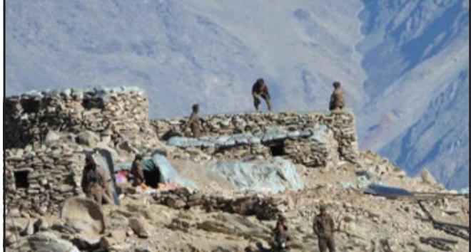
ચરણની ઉચ્ચ સ્તરીય સૈન્ય મંત્રણા બાદ ગત સપ્તાહે અંતિમ રૂપ આપવામાં આવ્યું હતું. રક્ષા મંત્રાલયના સૂત્રોએ જણાવ્યું કે, પેન્ગોગ લેકના ઉત્તર અને દક્ષિણ કિનારાઓથી વાપસીની પ્રક્રિયાને પૂરી થવામાં લગભગ એક સપ્તાહનો સમય લાગશે અને બંને પક્ષ સૈનિકો અને ઉપકરણોની વાપસી પ્રક્રિયાનું

સ્થિતિને લાગુ કરવામાં આવશે, જે નિર્માણ અત્યાર સુધીમાં કરવામાં આવ્યું છે તેને હટાવી દેવામાં આવશે. જે જવાનોએ પોતાના જીવ આ દરમિયાન ગુમાવ્યા છે તેમને દેશ હંમેશા સલામ કરશે. સમગ્ર ગુલ્ડેશની સંપ્રભુતાના મુદ્દે એક સાથે ઊભું છે. રાજ્યસભામાં નિવેદન આપતા રાજનાથ સિંહે કહ્યું હતું કે, ભારતે સ્પષ્ટ કર્યું છે કે LACમાં કોઈ ફેરફાર ન થાય અને બંને દેશોની સેનાઓ પોતપોતાના સ્થળે પહોંચી જાય. આપણે એક ઈચ્છા જમીન પણ કોઈને નહીં લેવા દઈએ. રક્ષા મંત્રીએ કહ્યું કે પેન્ગોગ લેકના ઉત્તર અને દક્ષિણ કિનારાને લઈ બંને દેશો વચ્ચે સમજૂતી થઈ ગઈ છે અને સેનાઓ પાછળ હટશે. ચીન પેન્ગોગ ફિંગર ટ બાદ જ પોતાની સેનાઓ તેનાત કરશે. ૧૦ મહિનાથી ચાલી રહેલા ઘર્ષણને સંસદમાં વાપસી સમજૂતી પર વિસ્તૃત નિવેદન આપ્યું હતું. રાજનાથ સિંહે એલાન કર્યું કે ભારત-ચીનની વચ્ચે પેન્ગોગ લેકની પાસે વિવાદ પર સમજૂતી થઈ ગઈ છે અને બંને દેશની સેનાઓ પોતાના સૈનિકોને પાછળ હટાવશે. રક્ષા મંત્રીએ એલાન કર્યું હતું કે ભારત અને ચીન બંનેએ નક્કી કર્યું છે કે એપ્રિલ ૨૦૨૦ પહેલાની