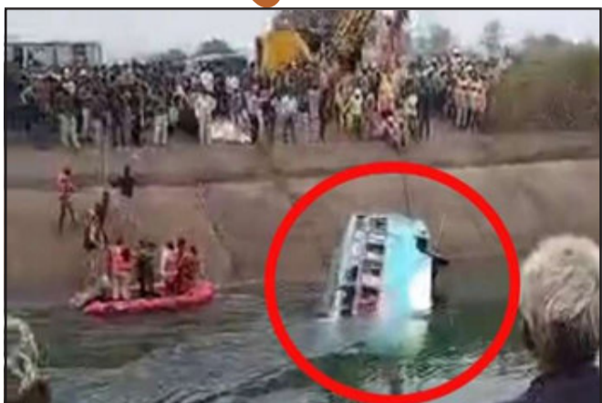
ગઈ છે. એએસપી અંજુલતા પટેલે જણાવ્યું છે કે ૩૭ લાશોને બહાર કઢાઈ છે. બાકીના મુસાફરોની

અને ઝલદીથી રાહત કાર્ય થાય તે માટે ચર્ચા કરી હતી. અમિત શાહે કહ્યું કે સ્થાનિક પ્રશાસન હાલમાં લોકોની મદદ માટે યુદ્ધના ધોરણે કાર્ય કરી રહ્યું છે. આ ઉપરાંત તેમણે મૃતકોના પરિવાર પ્રત્યે સંવેદના વ્યક્ત કરી હતી. મુખ્યમંત્રી શિવરાજ સિંહે સરકાર તરફથી વળતરની જાહેરાત કરી છે.