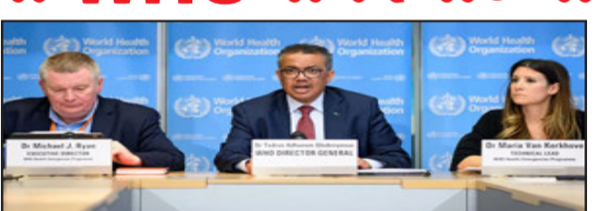
બેન એમ્બાકે એક ઈન્ટરવ્યુમાં જણાવ્યું હતું કે, અમને વુહાનથી જ મોટાપાયે વાઈરસ ફેલાયો હોવાના પૂરાવા અને સંકેતો મળ્યા છે. ફેલાયેલો કોરોના વાઈરસ ચીનના વુહાનથી જ ફેલાયો હતો. ચીને અત્યાર સુધી જેની તપાસ જ કરવા નથી દીધી તેવા ઉજરોબ્લડ સેમ્પલ્સ તત્કાળ ઉપલબ્ધ કરાવવા ચીનનાં સત્તાવાળાઓને તાકીદ કરાઈ છે. હું ટીમનાં મુખ્ય તપાસકર્તા પીટર

આવશે. હું ચીક ટેડોસ ગેબ્રેસિયસે કહ્યું હતું કે, ચીનનાં વુહાન શહેરમાં કરાયેલી તપાસ મહત્વની છે. તમામ સંભાવનાઓ સાથે તપાસ કરાઈ રહી છે. શરૂઆતમાં પ્રારંભિક રિપોર્ટ રજૂ કરાશે અને તે પછી થોડા સમયમાં સંપૂર્ણ તપાસ રિપોર્ટ રજૂ કરાશે. તપાસ ટીમને જાણવા મળ્યું હતું કે ડિસેમ્બર ૨૦૧૯માં એકલા ચીનનાં વુહાનમાં જ કોરોનાનાં ૧૦૦૦ કેસ હતા. મિલાન કેન્સર ઈન્સ્ટિટ્યૂટે જણાવ્યું હતું કે, ઈટાલીમાં ઓક્ટોબર ૨૦૧૯માં જ કોરોના ફેલાવાનું શરૂ થઈ ગયું હતું. વુહાનનાં આરોગ્ય અધિકારીઓએ હુંને તેની જાણ ૩૧ ડિસેમ્બર ૨૦૧૯નાં રોજ કરી હતી. દસ્તાવેજો મુજબ ચીનમાં કોરોનાનો પહેલો કેસ ૧૭ નવેમ્બર ૨૦૧૯નાં રોજ પ્રકાશમાં આવ્યો હતો. ચીનમાં ૩૧ ડિસેમ્બર ૨૦૧૯નાં રોજ કોરોનાનો પહેલો કેસ મળી આવ્યો તે પછી અમેરિકા સહિત આખા વિશ્વમાં તેને ફેલાવવાનાં કાવતરામાં ચીનની ભૂમિકા મહત્વની હતી. ચીનનાં એક વેઈબો યુઝર્સે તે જ દિવસે વોચ આઉટ ફોર અમેરિકન્સ એવો મેસેજ પોસ્ટ કર્યો હતો. બેઈજિંગથી વોશિંગ્ટન અને મોસ્કો તેમજ તહેરાન સુધી તેને ફેલાવવા માટે કાવતરું ઘડવામાં આવ્યું હતું. ચીનની સરકારે શરૂઆતમાં ખાસ્સો એવો ખોટો પ્રચાર કર્યો હતો.