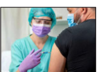
જીનીવા, ભારતમાં સીરમ ઈન્સ્ટિટ્યૂટ ઓફ ઈન્ડિયા દ્વારા બનાવવામાં આવેલી કોરોના રસી કોવિશિલ્ડનો ઉપયોગ હવે વિશ્વભરમાં કરવામાં આવશે. વર્લ્ડ હેલ્થ ઓર્ગેનાઈઝેશનએ ઓકસફર્ડ અને એસ્ટ્રાઝેનેકા દ્વારા વિકસિત કરેલી બે કોવીડ-૧૯ રસીના ઈમરજન્સી ઉપયોગને મંજૂરી આપી છે. તેમાં સીરમ સંસ્થાની રસી ઉપરાંત, દક્ષિણ કોરિયાની એસ્ટ્રાઝેનેકા-એસકેબાયોની રસી સામેલ છે. ડબ્લ્યુએચઓએ જાહેર કરેલા એક નિવેદનમાં જણાવ્યું છે કે, ઓક્સફર્ડ-એસ્ટ્રાઝેનેકાની રસીને ઈમરજન્સી ઉપયોગ માટે મંજૂરી આપી દેવામાં આવી છે જેથી વિશ્વભરમાં રસીકરણને આગળ વધારી શકાય. તેની સાથે હુંના પ્રમુખે એમ

જાઈઝરની રસી કરતા ઘણી સસ્તી છે. ડબ્લ્યુએચઓએ તેના નિવેદનમાં કહ્યું છે કે, ઓક્સફર્ડ-એસ્ટ્રાઝેનેકાની આ બંને કોરોના રસીઓની મંજૂરી આપ્યા બાદ, વિશ્વના ઘણા દેશોમાં કોવેક્સ પ્રોગ્રામ હેઠળ રસીકરણ ઝડપી બનાવવામાં આવશે. ત્યાર બાદ વિશ્વના જે દેશોમાં હજુ કોરોનાની રસી આપવામાં આવી નથી તે દેશોમાં રસીકરણ શરૂ કરવામાં આવશે. જણાવી દઈએ કે, કોવેક્સ પ્રોગ્રામની જેમ, ડબ્લ્યુએચઓ વિશ્વના ગરીબ દેશોમાં કોરોના રસી પહોંચાડવાનો પ્રયાસ કરે છે. આશરે ૪૦ લાખ લોકો વીજળીવિહોણા થઈ ગયા છે. ટેક્સાસમાં લઘુત્તમ તાપમાન ૨૮થી માઈનસ ૮ ડિગ્રી ફેરનહિટ (માઈનસ ૨થી માઈનસ ૨૨ સેલ્સિયસ) જેટલું ભારે બરફ પડતાં વપરાશકારો અસહ્ય બની જતાં પ્રમુખ જો બાઈડેને ઈમરજન્સી ઘોષિત કરી છે. વીજ ઉત્પાદન કરવાની કેટલીક કંપનીઓની ક્ષમતા થીજ જવાથી અંધારપટની સ્થિતિ સર્જાઈ છે.