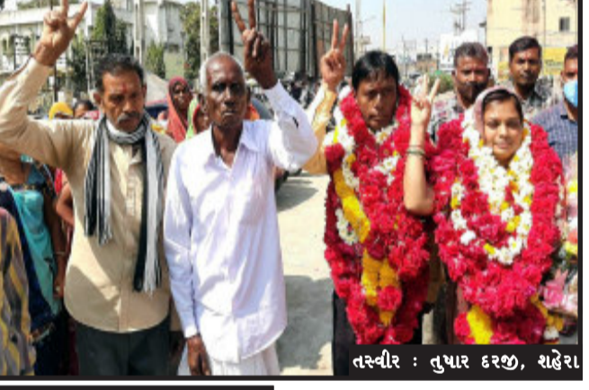
શહેરા નગર પાલિકા

શહેરા, શહેરામાં સ્થાનિક સ્વરાજની ચુંટણીમાં ભાજપને તાલુકા પંચાયતમાં ૧૧ અને જિદા પંચાયતમાં ત્રણ ભાજપના ઉમેદવારો બિન હરીફ થતા ભાજપમાં ખુશી જોવા મળી હતી. નગર પાલિકા, તાલુકા પંચાયત અને જિદા પંચાયતમાં ૬૦થી વધુ ઉમેદવારો ચુંટણી મેદાનમાં રહ્યા હતા.