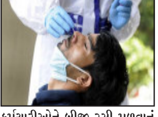
ન્યુદિલ્હી, છેલ્લા બે અઠવાડિયાથી દેશમાં દરરોજ કોરોનાના ૧૫,૦૦૦ થી ઓછા કેસ નોંધાઈ રહ્યા છે. આ સિવાય મોતનો આંકડો પણ છેલ્લા દોઢ મહિનામાં ઘટીને ૨૦૦ થી નીચે આવી ગયો છે. છેલ્લા ૨૪ કલાકમાં કોરોના વાયરસના ૯,૧૨૧ નવા કેસ નોંધાયા છે. તેજ સમયે, ગઈકાલે ૮૧ લોકોનાં મોત થયાં હતાં. આરોગ્ય મંત્રાલયે જણાવ્યું છે કે દેશમાં અત્યાર સુધીમાં ૮૭ લાખથી વધુ લોકોને રસી આપવામાં આવી છે. દેશવ્યાપી રસીકરણ કાર્યક્રમ અંતર્ગત આરોગ્ય

કર્મચારીઓને બીજી રસી મળવાનું શરૂ થયું છે. આરોગ્ય મંત્રાલયે જાહેર કરેલા તાજેતરના આંકડા મુજબ દેશમાં કોરોનાના સકારાત્મક કેસની સંખ્યા ૧,૦૯,૨૫,૭૧૦ પર પહોંચી ગઈ છે. તેમાંથી ૦૧,૫૫,૮૧૩ લોકોનાં મોત નીપજ્યાં છે. દેશમાં