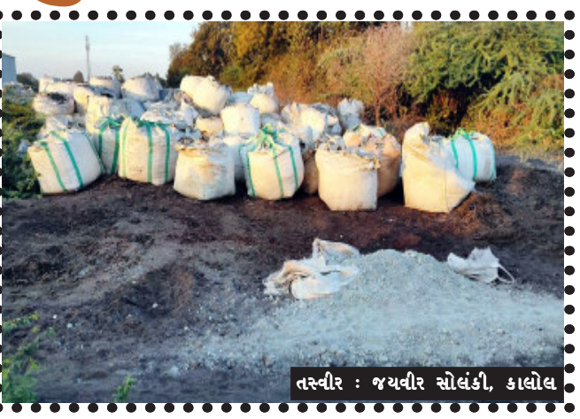
તસ્વીર : જયવીર સોલંકી, કાલોલ

કાલોલ, કાલોલ તાલુકાના અલીન્દ્રા ચોકડી પાસેના એક ખેતરમાં ઔદ્યોગિક વેસ્ટના બોરાં ફેંકી પ્રદુષણ ફેલાવાનો પ્રયત્ન કરવામાં આવતાં રહિશોમાં ભારે નારાજગી જન્મી છે. આ પ્રકારે કિંમતી મીનનો નાશ કરવાનો ધીરેધીરે ઉમેદવારોની કતાર લાગીને ફોર્મ ભરવા માટે બહાર આવનાર છે. ભાજપ અને કોંગ્રેસ માટે ઉમેદવારની પસંદગી માથાનો દુઃખાવો બન્યો છે. જીલ્લાકક્ષા એ પક્ષો માટે પસંદગી કરવી મુંઝવણપૂર્ણ હોવાથી શોર્ટ લીસ્ટ કરાચેલા ઉમેદવારોના નામોને પ્રદેશમાં મોકલવામાં આવ્યા છે. અને રાઉન્ડ ટુ ધ ટેબલ મુજબ બેઠક આયોજીત થઈને જીતી શકે તેવા ઉમેદવારોની પસંદગી થનાર છે. પરંતુ પક્ષો દ્વારા ચુંટણીમાં જોખમ લેવાનું ટાળતા આગામી શુક્રવાર અને શનિવારના રોજ મેન્ડેટ ફાળવીને નામોની જાહેરાત કરવામાં આવનાર છે. ખાસ કરીને ૦૩-૦૩ ટર્મ સુધી સળંગ જીતનાર અને ૬૦ વર્ષની વય મર્યાદા પૂર્ણ થતા ભાજપના ઉમેદવારો કપાય તેવી દહેશત સાથે યુવા ચહેરાઓએ ટીકટની માંગણી કરવામાં આવી છે. ત્યારે ભાજપ દ્વારા આ નિયમનું કેટલા અંશે પાલન કરે છે. તે અગત્યનું બન્યું છે.