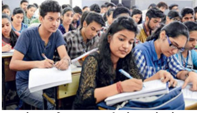
પ્રવાહ, ધોરણ ૧૨ વિજ્ઞાન પ્રવાહ અને ધોરણ ૧૦ની પરીક્ષા ૧૦ મેથી શરૂ થશે. ગુજરાત માધ્યમિક અને ઉચ્ચતર માધ્યમિક શિક્ષણ બોર્ડ દ્વારા ધો-૧૦ની પરીક્ષા માટેના ઓનલાઈન ફોર્મ ભરવાની કાર્યવાહીનો પ્રારંભ કરવામાં આવ્યો છે. બોર્ડની પરીક્ષાને લઈને છેલ્લા કેટલાય સમયથી ચાલતા અસમંજસ વચ્ચે બોર્ડ દ્વારા ધો-૧૨ સાયન્સના ફોર્મ ભરવાની કામગીરી શરૂ કરવામાં આવ્યું હતું. તે વખતે બોર્ડની પરીક્ષા ચાલતી હોઈ પુરતી તકેદારી સાથે

ગાંધીનગર, રાજ્યમાં ધોરણ ૧૦ બોર્ડની મુખ્ય પરીક્ષા પહેલા પ્રાયોગિક પરીક્ષા લેવામાં આવશે. આ પરીક્ષા ૧૦ એપ્રિલથી શરૂ કરવા બોર્ડ દ્વારા ચૂચના આપવામાં આવી છે. જ્યારે મરજિયાત વિષયની પરીક્ષા શાળા ખાતે લેવાશે. મરજિયાત વિષયની પરીક્ષા ૧૫થી ૧૭ એપ્રિલના રોજ લેવાશે. પરીક્ષા પૂર્ણ થયા બાદ બોર્ડની વેબસાઈટ પર વિદ્યાર્થીઓની પરીક્ષાના ગુણ મુકવામાં આવશે. નોંધનીય છે કે ગુજરાત માધ્યમિક અને ઉચ્ચતર માધ્યમિક શિક્ષણ બોર્ડ દ્વારા ધોરણ ૧૦ અને ૧૨ની બોર્ડની પરીક્ષાની તારીખો જાહેર કરી દેવાઈ છે. ધોરણ ૧૦ અને ૧૨ની બોર્ડની પરીક્ષા ૧૦ મેથી તારીખ ૨૫ મે દરમિયાન લેવામાં આવશે. ધોરણ ૧૨ સંસ્કૃત માધ્યમ અને ધોરણ ૧૨ વ્યવસાયલક્ષી પ્રવાહની પરીક્ષા ૧૭ મેથી શરૂ થશે. ધોરણ ૧૨ સામાન્ય