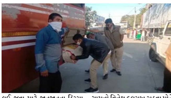
લઈ જવા માટે જાતજાતના કિસ્સા સાંભળ્યા હશે, પણ એસ.ટી. બસમાં ટિકિટ લઈને દાડૂ લઈ જવાની વાત સાંભળી છે? હા આવા જ કિસ્સો છોટા ઉદેપુરના બોડેલીમાં સામે આવ્યો છે. છોટા ઉદેપુરથી અમદાવાદ જતી એસ.ટી. બસમાં લગામી

છોટા ઉદેપુર, અત્યારસુધી તમે દાડૂ ટેકરમાં છૂપાવીને, ટ્રેક્ટરની ટ્રોલીની નીચે છૂપાવીને કે શેરીને બાંધીને તેના ઉપર કપડાં પહેરીને લઈ જવાના કિસ્સા સાંભળ્યા હશે, પરંતુ એસ.ટી. બસમાં લગેજની ટીકીટ લઈને દાડૂ લઈ જવાનો ચોંકાવનારો કિસ્સો છોટા ઉદેપુરના બોડેલીમાં સામે આવ્યો છે. આ વિશે મળતી માહિતી પ્રમાણે ગુજરાતમાં દાડૂ બંધી છે. તેમ છતાં દરરોજ દાડૂ ઝડપાઈ રહ્યો છે. છોટા ઉદેપુર જિલ્લો સરહદી જિલ્લો છે અને બાજુના મધ્ય પ્રદેશ રાજ્યમાથી દાડૂ ઘુસાડવા માટે નીતનવા કિમીયા અજમાવાય છે. અત્યાર સુધી તમે દાડૂ