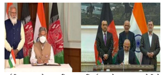
વર્ષથી ભારત અને અફઘાનિસ્તાન વિકાસના પ્રમુખ ભાગીદારો રહ્યા, ખેતી, સ્વાસ્થ્ય, શિક્ષણ જેવા અનેક સેક્ટરમાં અમારી યોજનાઓ ફેલાઈ છે અને અન્ય પરિયોજનાઓથી બંને દેશો વચ્ચે મૈત્રી સંબંધ મજબૂત બન્યો છે. અફઘાનના રાષ્ટ્રપતિ ગનીએ પણ આ સંધિ પર ખુશી જાહેર કરી હતી. તેમણે કોરોના વેક્સીન અને ડેમ

આની પહેલાં આ પેસેન્જરને મિશનને કેરલ મુસ્લિમ કલ્ચરલ સેન્ટર અને અન્ય સામાજિક સંગઠનોની મદદથી યાત્રા માટે ખાસ વ્યવસ્થા કરાવી હતી. પરંતુ હવે અધિકારીઓએ પુષ્ટિ કરી છે કે આવી સુવિધાઓ ફરીથી ઉપલબ્ધ કરાવશે નહીં. સાઉદી અરબ અને કુવૈત બંને ભારતીયો સહિત વિદેશી નાગરિકોની યાત્રા પર પ્રતિબંધ મૂકી દીધો છે.