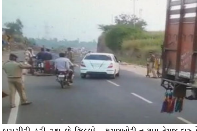
કામગીરી કરી રહ્યું છે. જિલ્લો રાજસ્થાન અને મધ્ય પ્રદેશની સરહદો પર આવેલો હોવાથી હાલમાં બંને સરહદો પર પોલીસ બાજ નજર રાખી રહી છે તેમજ કોઈ પણ પ્રકારની ગુનાઈત

દાહોદ, દાહોદ જિલ્લામાં સ્થાનિક સ્વરાજ્યની ચૂંટણીને લઈને પોલીસ સક્રિય છે. સરહદો પર પોલીસ બાજ નજર રાખી રહી છે ત્યારે ચૂંટણીમાં ગુનાખોરી ડામવા પરવાનેદારોના હથિયારો જમા કરાવવાની કામગીરી ચાલી રહી છે. ઉપરાંત ૧૭ પોલીસ મથકોમાં મળીને ૪૫૦૦ જેટલા અટકાયતી પગલાં લેવામાં આવ્યા છે. તેમજ ગુનાઈત ડુંડળી ધરાવનારાઓ ને સાંજસામાં લેવામાં આવી રહ્યા છે. દાહોદ જિલ્લામાં સ્થાનિક સ્વરાજ્યની ચૂંટણીઓ નિષ્પક્ષ અને શાંતિપૂર્ણ રીતે થાય તેના માટે વહીવટી અને પોલીસ તંત્ર સંપૂર્ણ સજાગતાથી