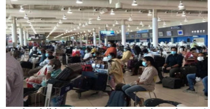
ચાત્રા દિશા-નિર્દેશો અંગે જાણી લો. સાથો સાથ નાગરિકોને આકસ્મિક જરૂરિયાતો પૂરી કરવા માટે પૂરતા પૈસા અને ખાવાની વસ્તુઓ સાથે રાખવાની ભલામણ કરી છે. દૂતાવાસે એ ભારતીય

નાગરિકોને પણ સલાહ આપી છે જે પહેલેથી જ સંયુક્ત અરબ અમીરાતમાં છે અને ત્યાંથી સાઉદી અરબ કે કુવૈત જવાના છે. આ પેસેન્જરને ઘરે પાછા ફરતા અને બાદમાં પ્રતિબંધોમાં ઠીલ આપવા પર જ મુસાફરી કરવા માટે કહ્યું છે. આ એડવાઈઝરી ત્યારે રજૂ કરવામાં આવી છે જ્યારે ભારતીય દૂતાવાસને સાઉદી અરબ અને કુવૈત જતા કેટલાંય ભારતીયોના યુએઈમાં ફસાયાની માહિતી મળી હતી. દૂતાવાસના એક અધિકારીએ ખલીજ ટાઈમ્સને કહ્યું કે ડિસેમ્બર ૨૦૨૦થી જ કમ સે કમ ૬૦૦ ભારતીય યુએઈમાં ફસાયા છે. તેઓ સાઉદી અરબ કે કુવૈતની યાત્રા કરવા માંગતા હતા. અધિકારીએ કહ્યું કે આંતરરાષ્ટ્રીય યાત્રા પ્રોટોકોલમાં ઝડપથી ફેરફાર થવાના લીધે મિશન સાઉદી અરબ અને કુવૈત જવા માટે યુએઈનો ઉપયોગ ના કરવાની સલાહ આપે છે જેથી કરીને તેઓ UAE ફસાય નહીં.