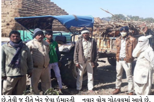
દાહોદ પાસે નવાગામ રાણાપુર પાસે વન વિભાગ દ્વારા ઈમારતી લાકડાઓની ગેરકાયદે હેરાફેરી રોકવા વોચ ગોઠવવામાં આવી હતી. તે દરમિયાન મધ્ય પ્રદેશ તરફથી આવતા ટ્રેક્ટરમાં ગેરકાયદે લઈ જવાતા ખેરના ઈમારતી લાકડાનો જથ્થો ઝડપાઈ જતાં કાયદેસરની કાર્યવાહી હાથ ધરવામાં આવી છે.

દાહોદ, દાહોદ પાસે નવાગામ રાણાપુર પાસે વન વિભાગ દ્વારા ઈમારતી લાકડાઓની ગેરકાયદે હેરાફેરી રોકવા વોચ ગોઠવવામાં આવી હતી. તે દરમિયાન મધ્ય પ્રદેશ તરફથી આવતા ટ્રેક્ટરમાં ગેરકાયદે લઈ જવાતા ખેરના ઈમારતી લાકડાનો જથ્થો ઝડપાઈ જતાં કાયદેસરની કાર્યવાહી હાથ ધરવામાં આવી છે. આગળની તપાસમાં શું બહાર આવે તેના પર આગળની કાર્યવાહીનો આધાર રહેલો છે. પાડોશી રાજ્ય મધ્ય પ્રદેશમાંથી વિદેશી દાહુ તો ઘુસાડવામાં આવે છે ત્યારે ઈમારતી લાકડાની તસ્કરી પણ કરવામાં આવી રહી છે. જો કે આ બાબત એટલી પ્રચલિત નથી તે પણ એટલું જ સત્ય છે.