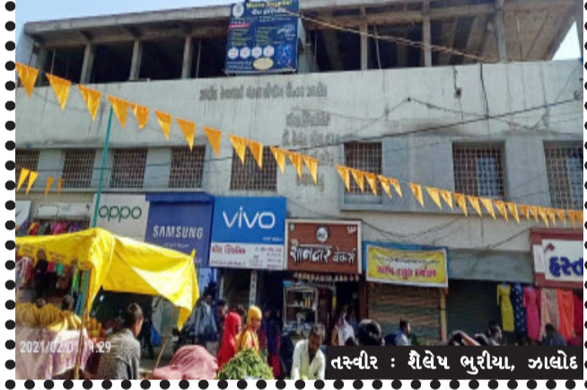
તસ્વીર : શૈલેષ ભુરીયા, ઝાલોદ

ઝાલોદ, ઝાલોદ કેળવણી મંડળ દ્વારા મંડળની માલિકી ના શોપિંગ સેન્ટર નું ધાબુ નિયમો નેવે મૂકી અને ફાળવી દેવામાં આવ્યું હોવાની ચર્ચાઓ એ જોર પકડ્યું છે. જેને લઈને નગરજનો માં કેળવણી મંડળ ની આવા વહીવટ ને લઈને છુપો રોષ પણ જોવા મળી રહ્યો છે.