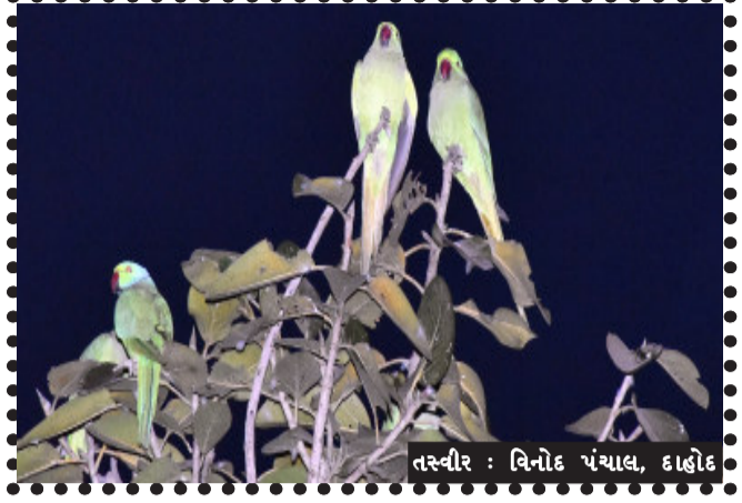
તસ્વીર : વિનોદ પંચાલ, દાહોદ

દાહોદ, દાહોદમાં જાન્યુઆરી મહિનો બેસે ને ફૂલગુલાબી ઠંડીનો માહોલ જામતો જાય તેમ વસંતના વધામણા કરવા જાણે પ્રકૃતિ રોજ નવા શણગાર સજવા લાગે છે. આ કુદરતના કાવ્યમાં પોતાના ગીત ઉમેરવા દાહોદમાં કેટલાંક મહેમાનોનું પણ શિયાળાનો ચાર્તુમાસ ગાળવા આગમન થાય છે. સંઘ્યા સમયે કામની વ્યસતામાંથી પરવારી ઘરે જતા લોકોને પોતાના મીઠા કલબલાટથી ધ્યાન આકર્ષતા સૂડાઓ વૃક્ષોને ડાળે ડાળે જાણે નવા પાન ખીલી ઉઠ્યાં હોય એમ હજારોની સંખ્યામાં જોવા મળે છે.