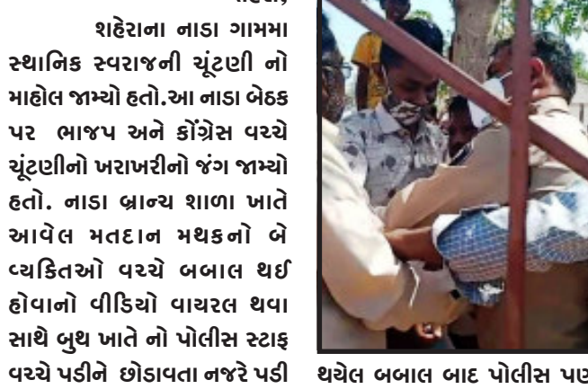
તસ્વીર : શહેરા

શહેરાના નાડા ગામના સ્થાનિક સ્વરાજની ચૂંટણી નો માહોલ જાઓ હતો. આ નાડા બેઠક પર ભાજપ અને કોંગ્રેસ વચ્ચે ચુંટણીનો ખરાખરીનો જંગ જાઓ હતો. નાડા બ્રાન્ચ શાળા ખાતે આવેલ મતદાન મથકનો બે વ્યક્તિઓ વચ્ચે બબાલ થઈ હોવાનો વીડિયો વાયરલ થવા સાથે બુથ ખાતે નો પોલીસ સ્ટાફ વચ્ચે પડીને છોડાવતા નજરે પડી રહ્યા છે.