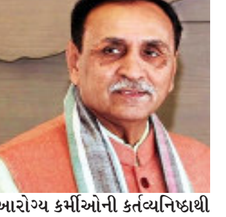
આરોગ્ય કર્મીઓની કર્તવ્યનિષ્ઠાથી કોરોનાનો વ્યાપ વધતો અટકાવવામાં સફળતા મેળવી છે. હવે જ્યારે કોરોના સામે રસીકરણ અભિયાન પણ દેશભરમાં શરૂ થયું છે ત્યારે ગુજરાતના સૌ વરિષ્ઠ નાગરિકોના સહકારથી આપણું રાજ્ય એમાં પણ અગ્રેસર રહેશે તેવો વિશ્વાસ તેમણે વ્યક્ત કર્યો છે.

ગાંધીનગર, રાજ્યમાં કોરોના વેક્સિન વરિષ્ઠ નાગરિકો ૬૦ વર્ષથી ઉપરની વયના વડીલોને આજથી (૧ માર્ચ)થી આપવાનો પ્રારંભ થઈ રહ્યો છે. ત્યારે મુખ્યમંત્રી વિજય રૂપાણીએ ગુજરાતના ૬૦ લાખ જેટલા સૌ વરિષ્ઠ વડીલોને આ રસીકરણ અભિયાનનો લાભ લઈને કોરોના સામેની આપણી લડાઈના આ નિર્ણાયક અંતિમ તબક્કામાં પોતાનું યોગદાન અવશ્ય આપવા અપીલ કરી છે. મુખ્યમંત્રીએ આ અપીલ કરતા સ્પષ્ટપણે જણાવ્યું છે કે, રાજ્ય સરકારે સૌના આરોગ્યની ચિંતા કરીને કોરોના સામે શરૂઆતથી જ લોકસહયોગ અને આરોગ્ય કર્મીઓની કર્તવ્યનિષ્ઠાથી કોરોનાનો વ્યાપ વધતો અટકાવવામાં સફળતા મેળવી છે. હવે જ્યારે કોરોના સામે રસીકરણ અભિયાન પણ દેશભરમાં શરૂ થયું છે ત્યારે ગુજરાતના સૌ વરિષ્ઠ નાગરિકોના સહકારથી આપણું રાજ્ય એમાં પણ અગ્રેસર રહેશે તેવો વિશ્વાસ તેમણે વ્યક્ત કર્યો છે.