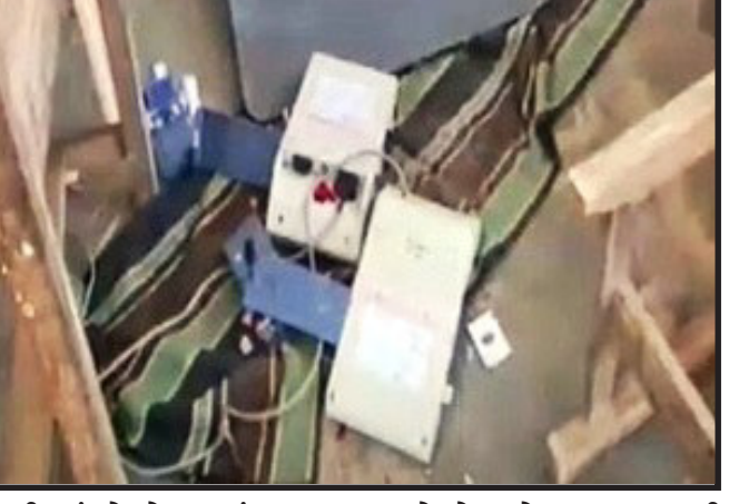
મશીનમાં તોડફોડ કરતાં મતદાન રોકી દેવામાં આવ્યું હતું. આ સમગ્ર ઘટનાને તફરીનો માહોલ પણ સર્જાઈ જવા

ઝાલોદ, દાહોદ જિલ્લામાં સ્થાનિક સ્વરાજની ચૂંટણીમાં કેટલીક હિંસક ઘટનાને બાદ કરતાં ચૂંટણી પર્વ શાંતિ પુર્ણ માહોલમાં પુર્ણ થવા પામ્યો છે. ત્યારે ઝાલોદ તાલુકાના ઘોડીયા પ્રાથમિક શાળા કેન્દ્ર ખાતે આવેલ મતદાન મથક પર સવારથી મતદાન શાંતિ પુર્ણ રીતે ચાલી રહ્યું હતું. ત્યારે બપોર બાદ ત્રણ વ્યક્તિઓ દ્વારા બુથ કેપ્ચરીંગનો પ્રયાસ હાથ ધરી બોગસ મતદાન કરવાના ઇરાદાથી આવેલા ઈસમોએ ઉગ્ર બોલાચાલી બાદ ત્રણેય ચુપકોએ ઈ.વી.એમ.