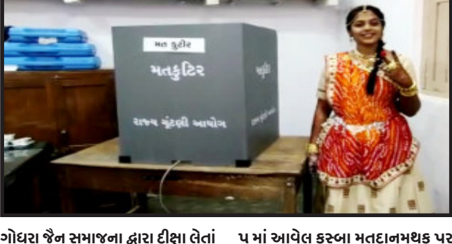
તસ્વીર : ગોધરા

ગોધરા, ગોધરા શહેરની જૈન સંપ્રદાયની દીકરીએ દીક્ષા ગ્રહણ કરીને પવિત્ર પંથ ઉપર પગલાં માંડવા જઈ રહી છે. તેવા સમયે પાલિકાની ચૂંટણીમાં પોતાનો અંતિમ તેવા પવિત્ર મત અધિકારનો ઉપયોગ કરીને એક નવી રાહ દર્શાવી હતી.