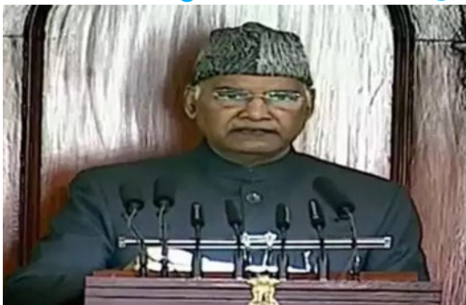
રાષ્ટ્રપતિ પ્રણવ મુખરજીનું નિધન પણ કોરોના કાળમાં થયું. સંસદના ૬ સભ્ય પણ કોરોનાના કારણે કસમયે આપણને છોડીને જતા રહ્યા. હું તમામ પ્રત્યે વિનમ્ર શ્રદ્ધાંજલિ અર્પિત કરું છું. તેમણે વધુમાં કહ્યું કે સરકારે લગભગ ૩૧ હજાર કરોડ રૂપિયા ગરીબ મહિલાઓના જનધન ખાતામાં સીધા સંસ્કર કર્યા. દેશભરમાં ઉજ્જવલા યોજનાના લાભાર્થી ગરીબ મહિલાઓને ૧૪ કરોડથી વધુ મફત ગેસ સિલિન્ડર પણ મળ્યા.

હિતો માટે સરકાર ગંભીર છે. મારી સરકારે સ્વામીનાથન આયોગની ભલામણોને લાગુ કરતા બચ્ચી દોઢ ગણું MSP આપવાનો નિર્ણય લીધો હતો. મારી સરકાર આજે MSP પર રેકોર્ડ માત્રામાં ખરીદી કરી રહી છે અને ખરીદે કેન્દ્રોની સંખ્યા પણ વધારી રહી છે. તેમણે કહ્યું કે સરકારે છેલ્લા ૬ વર્ષમાં બીજાથી લઈને બજાર સુધી દરેક વ્યવસ્થામાં સકારાત્મક પરિવર્તનોનો પ્રયાસ કર્યો છે. જેથી કરીને ભારતીય કૃષિ આધુનિક પણ બને અને કૃષિનો વિસ્તાર પણ થાય. આત્મનિર્ભર ભારત અભિયાન ભારતમાં નિર્માણ સુધી જ સિમિત નથી પરંતુ તે ભારતના દરેક નાગરિકના જીવનસ્તરને ઉપર ઉઠાવવા અને દેશના આત્મવિશ્વાસને વધારવાનું પણ અભિયાન છે.