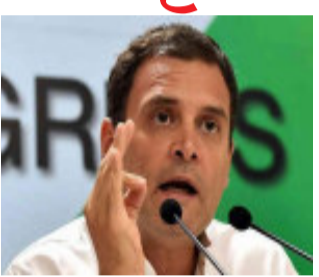
કરવામાં આવ્યો, સરકાર ત્રણેય કૃષિ કાયદાને જલ્દી પરત લે.

ન્યુ દિલ્હી, કૃષિ કાયદાના વિરોધમાં ૨૬ જાન્યુઆરીએ થયેલી હિંસા તેમજ સિંધુ બોર્ડર પર ખેડૂતો પર થયેલા હુમલાને લઈ કોંગ્રેસ નેતા રાહુલ ગાંધીએ પત્રકાર પરિષદ કરી હતી. રાહુલ ગાંધીએ કહ્યું કે, “ખેડૂતો સાથે ગુનેગારો જેવો વ્યવહાર કરવામાં આવ્યો છે, ખેડૂતો વિરુદ્ધ એનઆઈએનો ઉપયોગ