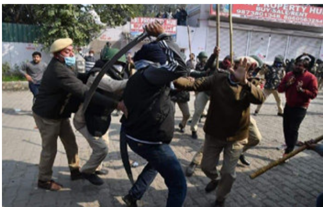
કા અપમાન, નહી સહેગા હિન્દુસ્તાન"ના નારા લાગ્યા અને તરત હાઈવે ખાલી કરવાની માંગ કરી છે.

પણ લાઠીચાર્જ કર્યો છે અને પ્રદર્શનકારીઓને રોકવાનો પ્રયત્ન કર્યો છે. જો કે આ બખાલની વચ્ચે અનેક લોકો ઘાયલ થયા છે અને પોલીસ કર્મચારીઓને પણ ઈજા થઈ હોવાના સમાચાર છે. ઉલ્લેખનીય છે કે શુક્રવારના સવારે જ દિલ્હી સિંધુ બોર્ડર પર મોટી સંખ્યામાં લોકો ખેડૂત પ્રદર્શનકારીઓની વિરુદ્ધ પ્રદર્શન કરવા આવ્યા હતા. ગુરુવારના સ્થાનિક લોકોએ સિંધુ બોર્ડર પર ધરણાની વિરુદ્ધ પ્રદર્શન કર્યું હતુ. આ લોકોએ ખુદને હિંદુ સેનાના ગણાવ્યા હતા અને કહ્યું હતુ કે લાલ કિલ્લા પર