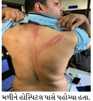
મળીને હોસ્પિટલ પાસે પહોંચ્યા હતા. અને ખાડાને લઈને પોલીસ અને ડોક્ટર વચ્ચે બોલાચાલી તથા ડંડા વાળી થઈ હતી. જે બનાવનો સીસીટીવી ફુટેજનો વિડીયો સોશિયલ મીડીયામાં વાયરલ થયા હતા.

સંતરામપુર, સંતરામપુરમાં માટીના ઢંગલાના મુદ્દે ડોક્ટર અને સંતરામપુર પોલીસ વચ્ચે બોલાચાલી બાદ પોલીસે ડોક્ટરને મારમારતા અને ધરના દરવાજા પર ડંડા મારતો વિડિયો સોશિયલ મીડીયા પર વાયરસ થયો હતો. મહિસાગર પોલીસવડાએ ૧૦ પોલીસ કર્મીઓ પર કાર્યવાહી કરતાં મહિસાગર પોલીસ બેડામાં ચક્રચાર મચી જવા પામ્યો હતો. સંતરામપુર નગરમાં સુરેખા હોસ્પિટલની બાજુ પાડો કરવામાં આવ્યો હતો. આ ખાડાને લીધે સંતરામપુરના પીઆઈ અને ટ્રાફિક જમાદાર તથા પોલીસ સ્ટાફ