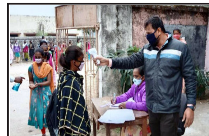
રાજ્યમાં આજ થી દશ મહિના બાદ સ્કૂલ કોલેજ ચાલુ કરવામાં આવી છે. ત્યારે મોરવા હડક ધી કૃષિકાર માધ્યમિક અને ઉચ્ચ માધ્યમિક સ્કૂલ ચાલુ કરવામાં આવી હતી. ધોરણ ૧૦ અને ૧૨ ના વિદ્યાર્થીને વાલીઓને સંમતિ સાથે વિદ્યાર્થી શાળામાં આવી રહ્યા છે. શાળા માં આવતા વિદ્યાર્થીને માર્સ્ક સિનિટાયઝર સોશિયલ ડિસ્ટન્સ જાળવીને વિદ્યાર્થીને શાળામાં આવકાર્ય છે શાળાના આચાર્ય અને શિક્ષકો દ્વારા કોરોના સાવચેતી ની માહિતી આપવામાં આવી છે.

ગોધરા, ગોધરા તાલુકાના છારીયા ગામ રહેણાંક મકાનમાં ઈંગ્લીશ દારૂનો જથ્થો રાખીને વેચાણ કરે છે. તેવી બાતમીના આધારે પોલીસને રેડ કરી હતી. ઈંગ્લીશ દારૂના કચાટરીયા નંગ-૪૬ કિમટ ૮.૯૭૦/- રૂપિયાના મુદામાલ સાથે આરોપીને ઝડપી પાડવામાં આવ્યો. પ્રાસ વિગતો પ્રમાણે ગોધરા તાલુકાના છારીયા નિશાળ