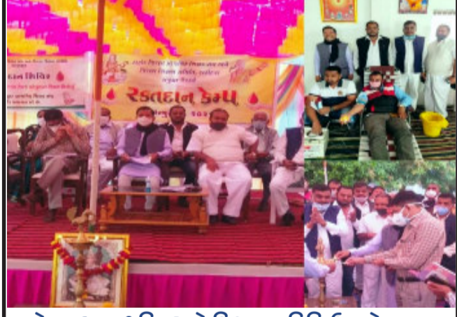
દાહોદ જીલ્લા પ્રાથમિક અને શિક્ષણ સમિતિ ઉપક્રમે રક્તદાન કેમ્પ ફતેપુરા, સંજેલી અને સિંગવડ તાલુકા ખાતે આયોજન કરાયું. જેમાં ૫૮ શિક્ષકો દ્વારા રક્તદાન કરાયું.

ઝાલોદ, ઝાલોદ નગરપાલિકાના સફાઈ કામદારો સાથે ચીફ ઓફિસર સહિત તેમના ફાઈવરો દ્વારા સફાઈ કામદારો તેમજ મહિલાઓ સાથે ઉડતી તેમજ જાતિઅપમાનિત શબ્દો બોલતાં આજરોજ ઝાલોદ નગરપાલિકાના સફાઈ કામદારો દ્વારા ઝાલોદ પ્રાંત અધિકારીને આવેદનપત્ર આપી સાફ સફાઈ કામગીરીથી અળગા રહેવાની ચીમકી ઉચ્ચારી છે. કાલોદ નગરના સફાઈ કામદારો દ્વારા જાણવા મળ્યા અનુસાર, ઈ.પી.એફ. અને કાચમી નોકરીની રજુઆત માટે તેઓ ઝાલોદ પાલિકાના ચીફ ઓફિસર પાસે ગયા હતાં જ્યાં ચીફ ઓફિસર દ્વારા સફાઈ