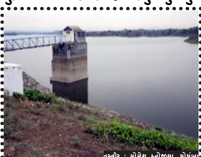
તસ્વીર : ચોગેશ કનોજીયા, ઘોંઘા

ઘોંઘાના કરાડ કેમ સિંચાઈ માટે પાણી છોડવામા નહિ આવતા રવિ પાક મુકાઈ રહ્યો હોવાને લઈ ખેડુતો દ્વારા આત્મવિલોપન કરવાની અરજ આપી હતી. ત્યારે કરાડ કેમ દ્વારા સિંચાઈ માટે પાણી છોડવામાં આવતા ખેડુતોમાં આનંદ જોવા મળ્યો છે.