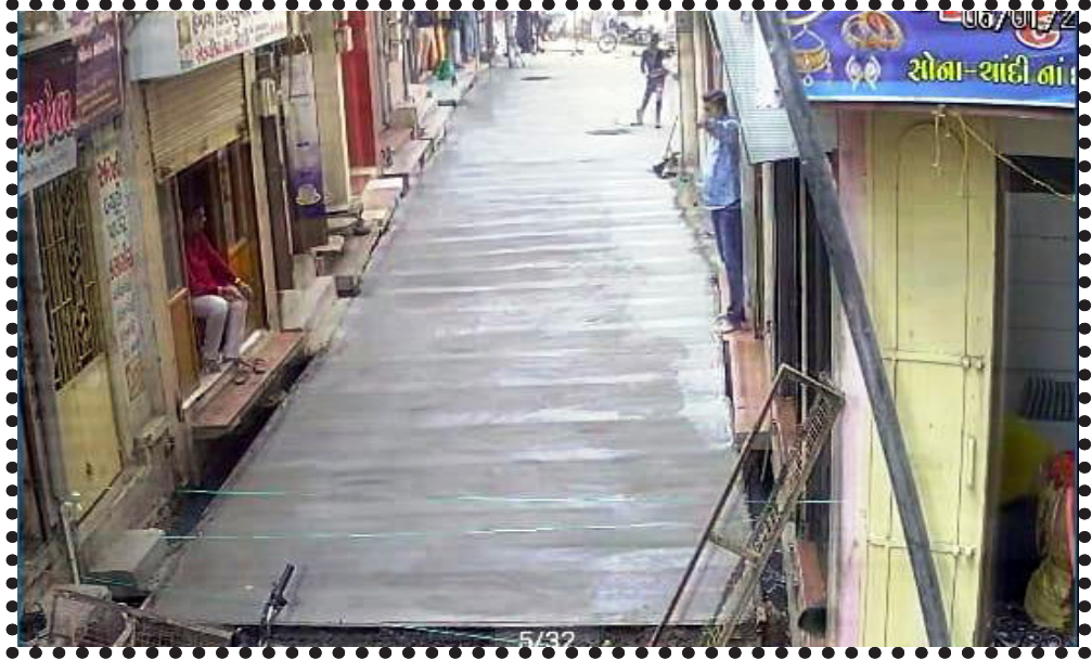
રહિશોને ગંદા પાણીના નિકાલની સમસ્યા ઉભી થવા પામી છે. ગોધરા શહેર પાલિકા વિસ્તારના શેરીઓ મહોદ્દા અને ફળિયાઓના આંતરિક શહેરની શેરી, મહોદ્દા અને

ગોધરા, શહેરા નગરપાલિકા વિસ્તારોમાં આંતરિક રસ્તાઓના નવીનીકરણ કામગીરી ચાલી રહી છે. હાલમાં સોનીવાડ વિસ્તારના વાવડી ફળિયામાં આર.સી.સી.રોડની કામગીરી કરવામાં આવી છે. રસ્તાની કામગીરી સંભાળી રહેલા કોન્ટ્રાક્ટર દ્વારા ફળિયામાં ગંદા પાણીના નિકાલ માટે ભુગર્ભ ગટર લાઈન સાથેની જોડતી પાઈપલાઈન અને ચેમ્બરો બનાવવામાં આવી હતી તેવી પાઈપલાઈન અને ચેમ્બરો તોડીને આર.સી.સી.રોડ બનાવી દેવામાં આવતા આ વિસ્તારના