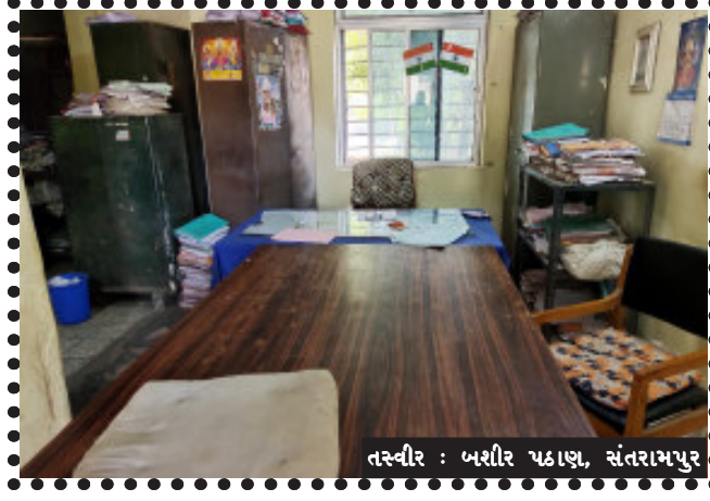
તસ્વીર : બશીર પઠાણ, સંતરામપુર

સંતરામપુર, સંતરામપુરમાં શિક્ષણ ખાતાની ઓફિસ રામ ભરોસે સંતરામપુર નગરમાં તાલુકા પંચાયત કચેરીમાં આવેલી શિક્ષણ શાખા માં આજરોજ ઓફિસની અંદર એક પણ કર્મચારી શિક્ષણ અધિકારી કોઈ પણ જોવા મળ્યા હતા નહીં ઓફિસ ખાલી ખમ જોવા મળી હતી શિક્ષણ ખાતા માં પણ વહીવટ લોલમલોલ પોલંપોલ જોવાઈ રહ્યો છે સંતરામપુર તાલુકાના તમામ શિક્ષકો ના સેવાપોથીઓ અને સંખ્યાબંધ અગત્યના ડોક્યુમેન્ટ અને સરકારી તમામ રેકોર્ડ આ ઓફિસમાં મુકેલો હોય છે પરંતુ શિક્ષણ અધિકારી અને ક્લાર્કની પોતાની બેદરકારી જોડાયેલી છે પોતાની જવાબદારી વિના જ આખી ઓફિસ ખાલી મૂકીને જતા રહ્યા છે ઓફિસની