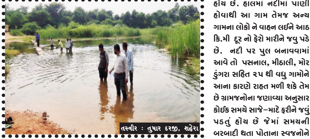
કેપ્ચરી સરપંચ સહિત સ્થાનિકો એ પલા તાલુકા ની લાગતી વળગતી કચેરી સહિત જિલ્લામાં

શહેરા, શહેરા ના પસનાલ થી મીઠાલીની વચ્ચે આવેલ કૂણા નદી પર પુલ બનાવવા મા આવે તો રૂપ થી વધુ ગામો ના લોકો માટે એક ટૂંકો માર્ગ બની શકે તેમ છે. હાલ મા સ્થાનિક ગ્રામજનો ને આઠ કિલો મીટર ફરી ને મીઠાલી જવું પડી રહ્યુ છે. શહેરા તાલુકાના પસનાલ ગામ થી મીઠાલી ને જોડતો કામર માર્ગ નહિ હોવાથી સ્થાનિક ગામ અને આજુબાજુ ના ગામ ના લોકો ને આઠ થી દસ કિમી જેટલું અંતર કાપી બીજા ગામે જવું પડે છે. પસનાલ ગામ થી મીઠાલી ના વચ્ચે કૂણા નદી પર પુલ બનાવવા મા આવે તેવી લોક માંગ ઉઠવા પામી છે. પસનાલ ગામના