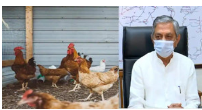
મૃત્યુ અંગે સર્વેક્ષણ કરવું. તો સાથે જ ફોરેસ્ટ વિભાગ સાથે પણ સંકલન રાખવા કહેવાયું છે. જો કેસ પોઝિટિવ આવે તો તેના સંદર્ભે પણ પોલ્ટ્રી ફાર્મને માર્ગદર્શન અપાયું છે.

ગાંધીનગર, દેશના છ રાજ્યોમાં બર્ડ ફ્લૂની દહેશત ફેલાઈ છે. ગુજરાત સહિત છ રાજ્યોમાં પક્ષીઓ મૃત હાલતમાં મળી આવ્યા છે. હજુ સુધી ગુજરાતમાં બર્ડ ફ્લૂનો એક પણ કેસ નોંધાયો નથી. પરંતુ રાજ્યમાં આ માટે જરૂરી પગલા લેવાયા છે. બર્ડ ફ્લૂ ને લઈ રાજ્યના આરોગ્ય વિભાગ તરફથી જિલ્લા અને કોર્પોરેશન આરોગ્ય અધિકારીઓને પત્ર લખાયો છે. શંકાસ્પદ બર્ડ ફ્લૂના સર્વેલન્સ અને અટકાયતી પગલાં લેવા સૂચન કરાયા છે. તો સાથે જ પોલ્ટ્રી ફાર્મમાં કામ કરતા મજૂરોને શરદી ગળું પકડાવવા જેવા શંકાસ્પદ કેસ દેખાય તો ઘનિષ્ઠ સર્વેક્ષણ બનાવવાની સૂચના અપાઈ છે. આરોગ્ય વિભાગ દ્વારા સૂચના અપાઈ કે, પોલ્ટ્રી ફાર્મમાં મરઘાના