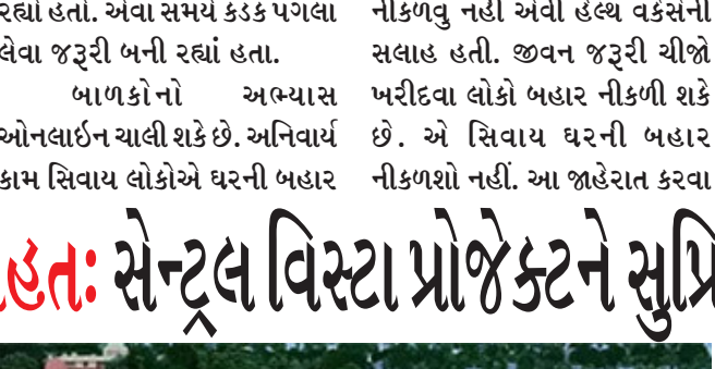
મોટી સરકારને રાહત: સેન્ટ્રલ વિસ્તા પ્રોજેક્ટને સુપ્રીમની 'લીલીઝંડી'

ન્યુ દિલ્હી, સુપ્રીમ કોર્ટેને કેન્દ્રની મોટી સરકારને મોટી રાહત મળી છે. સુપ્રીમ કોર્ટે સેન્ટ્રલ વિસ્તા પ્રોજેક્ટને લીલી ઝંડી આપી દીધી છે. આપને જણાવી દઈએ કે પાછલી સુનવણીમાં સુપ્રીમ કોર્ટે સંસદ ભવનના શિલાન્યાસને મંજૂરી આપી દીધી હતી. જસ્ટિસ એએમ ખાનવિલકર, જસ્ટિસ દિનેશ માહેશ્વરી અને જસ્ટિસ સંજય ખન્નાની બેન્ચે ૨-૧ની બહુમતીથી આ ચુકાદો સંભળાવતા કહ્યું કે તેમની બેન્ચે સરકારને આ યોજના માટે મંજૂરી આપી રહ્યું છે. જસ્ટિસ ખાનવિલકર અને જસ્ટિસ માહેશ્વરીએ ૨-૧ની બહુમતી આપતા ચુકાદામાં કેન્દ્ર સરકારના ડીડીએ એક્ટના અંતર્ગત આ પ્રોજેક્ટને યોગ્ય ગણાવ્યો. તો જસ્ટિસ સંજય ખન્ના બહુમતીથી અલગ રહ્યા. બેન્ચે સાથે સાથ સામાન્ય પ્રવાહમાં પ્રશ્નપત્રોમાં સરકારને પ્રદૂષણને નાથવા માટે સ્મોગ ટાવર લગાવવાનું પણ કહ્યું છે. સોલિસિટર જનરલ તુષાર મહેતાએ કહ્યું હતું કે હાલનું સંસદ ભવન ગંભીર આગની આશંકા અને ઓછી જગ્યાનો સામનો કરી રહ્યું હતું. આ પ્રોજેક્ટ હેઠળ હેરિટેજ બિલ્ડિંગને સંરક્ષિત કરવામાં આવશે. હાલનું સંસદ ભવન ૧૯૨૭માં બનાવવામાં આવ્યું હતું જેનો ઉદ્દેશ્ય વિધાન પરિષદ ભવનના નિર્માણનો હતો ન કે બે સદનનો હતો. પરંતુ જ્યારે લોકસભા અને રાજ્યસભાનું સંયુક્ત સત્ર આયોજિત કરવામાં આવે છે ત્યારે સાંસદો પ્લાસ્ટીકની ખુરશી પર બેસે છે. જેનાથી સંસદની ગરીબા જળવાતી નથી. આપને જણાવી દઈએ કે