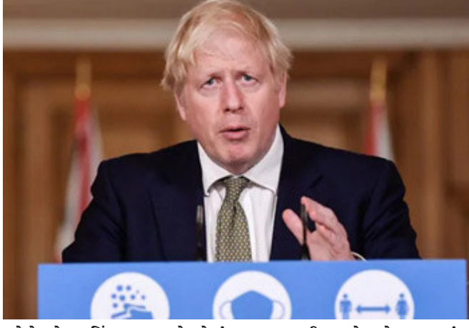
રહેશે. હેર કટિંગ સલૂન, રેસ્ટોરાં વગેરેમાં પણ હાલ કોઈ પ્રવૃત્તિ નહીં થાય. જો કે રેસ્ટોરાં ટેક અવે સેવા ચાલુ રાખી શકશે. સોમવાર સાંજ સુધી ઈંગ્લેંડની હોસ્પિટલોમાં ૨૬, ૬૨૬ દર્દીઓ હતા. ગયા સપ્તાહ કરતાં આ વધારો ૩૦ ટકા જેટલો હતો.

વડા પ્રધાને કહ્યું હતું કે કોરોનાના નવા સ્ટ્રેન સામે અગમચેતી રૂપે દોઢ માસનો લોકડાઉન લાદવાની ફરજ પડી હતી. સ્કૂલ કોલેજના વિદ્યાર્થીઓ પણ ફેબ્રુઆરીના અંત સુધી કેમ્પસમાં પાછાં નહીં ફરી શકે. સોમવારે રાત્રે બોરિસ જોહોન્સને રાષ્ટ્રવ્યાપી પ્રવચન કર્યું હતું અને કહ્યું હતું કે દેશ અત્યારે બહુ મુશ્કેલ સંજોગોમાંથી પસાર થઈ રહ્યો હતો. કોરોનાના નવા સ્ટ્રેન સામે રક્ષણ માટે લોકડાઉન લાદવાની સરકારને ફરજ પડી રહી હતી. લોકો આ મુદ્દો સમજી શકશે અને સરકારના પ્રયાસોમાં સાથ સહકાર આપશે એવી આશા છે. દેશના દરેક વિસ્તારમાં કોરોના ઝડપભેર પ્રસરી રહ્યો હતો. એવા સમયે કડક પગલાં સલાહ હતી. જીવન જરૂરી ચીજો પરીદવા લોકો બહાર નીકળી શકે છે. એ સિવાય ઘરની બહાર નીકળશો નહીં. આ જાહેરાત કરવા અગાઉ વડા પ્રધાને એવા અણસાર આપી દીધો હતો કે કોરોના અને કોરોનાના નવા સ્ટ્રેન સામે કડક પગલાં ભરવા પડશે. એ સિવાય બીજો કોઈ વિકલ્પ રહ્યો નહોતો.