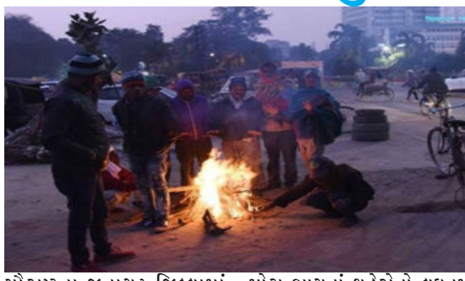
સૌરાષ્ટ્રના જૂનાગઢ જિલ્લામાં અને કચ્છમાં કોલંડવેવની સ્થિતિ રહેશે. આ વિસ્તારોમાં હાડ થિજાવતી ઠંડી પડશે.

રાજકોટ, માઉન્ટ આબુમાં ફરીથી ઠંડીએ જોર પકડ્યું છે. સોમવારે માઈનસ ૦.૫ ડીગ્રી તાપમાન નોંધાયું હતું. માઉન્ટ આબુમાં ફરીથી શીતલહેર પ્રસરતાં ઠંડા પવનના સુસવાટા વચ્ચે માઉન્ટ આબુની ઘાટીઓમાં વાતાવરણ ઠંડુંગાર થઈ જવા પામ્યું છે. સહેલાણીઓ હાડ થિજાવતી ઠંડી વચ્ચે પણ માઉન્ટ આબુના જોવાલાયક સ્થળે ઊમટી રહ્યા છે. માઉન્ટ આબુના સૌથી ઊંચા ગુરુશિખર પર તાપમાનનો પારો માઈનસ બે ડીગ્રી નોંધાયો છે. નવા વર્ષની શરૂઆતમાં જ રાજ્યના વિવિધ ભાગોમાં હવામાનમાં પલટો જોવા મળ્યો છે. રાજ્યમાં ઠંડીનું જોર વધશે એવી હવામાન વિભાગ દ્વારા આગાહી પણ કરવામાં આવી છે. હવામાન ખાતાએ કરેલી આગાહી પ્રમાણે આગામી ત્રણ દિવસ મંગળવાર, બુધવાર અને ગુરુવારે