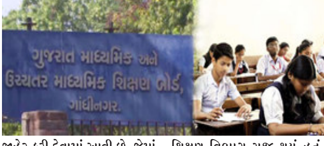
જાહેર કરી દેવામાં આવી છે. જેમાં ધોરણ ૧૦ માટે પરીક્ષા ફી ૩૫૫ રૂપિયા નક્કી કરવામાં આવી છે. જ્યારે ધોરણ ૧૨ સામાન્ય પ્રવાહ માટે ૪૮૦ રૂપિયા તેમજ વિજ્ઞાન પ્રવાહ માટે ૬૦૫ રૂપિયા ફી નક્કી કરાઈ છે.

શરૂ કરવાનો નિર્ણય લેવામાં આવ્યો હતો. કોરોના મહામારીને ધ્યાને રાખીને ગુજરાત સરકારના ગુજરાત માધ્યમિક અને ઉચ્ચતર માધ્યમિક બોર્ડ દ્વારા વિદ્યાર્થીઓના હિતમાં નિર્ણય લેવામાં આવ્યો હતો. જેના હેઠળ ધોરણ ૯થી ૧૨ના અભ્યાસક્રમમાં ૩૦ ટકાના ઘટાડો કરાયો હતો. જ્યારે પરીક્ષા પદ્ધતિમાં પણ માટાપાયે ફેરફાર કરાયો હતો. બોર્ડના નિર્ણય મુજબ ધોરણ-૯, ૧૦, ૧૧ અને ૧૨ સામાન્ય પ્રવાહમાં પ્રશ્નપત્રોમાં હેતુલક્ષી પ્રશ્નો પ્રમાણ વધારીને ૩૦ ટકા કર્યું છે. જે અગાઉ ૨૦ ટકા હતું. કેન્દ્રીય શિક્ષણ પ્રધાન રમેશ પોખરિયાલે થોડા દિવસ પહેલા જ સીબીએસસી બોર્ડની આગામી ૧૦ અને ૧૨માં ધોરણની બોર્ડ પરીક્ષાની તારીખો આજે જાહેર કરી હતી, આ પરીક્ષાઓ અગાઉની એનઈઈટી અને જેઈઈટીની પરીક્ષાઓની જેમ જ ઓફલાઇન મોડમાં લેવામાં આવશે તેવું જણાવ્યું હતું.