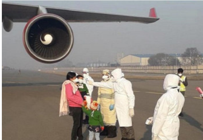
સેમ્પલમાં નવા સ્ટ્રેન જોવા મળ્યા. તેનો રિપોર્ટ મંગળવારે રજૂ કરાયો. યુકેથી આવેલા લોકોના જેમાં અલગ-અલગ લેબમાં ટેસ્ટ કરાયેલા સેંકશન અંગે જણાવ્યું. આ જીનોમ સિક્વેન્સિંગ કરાયા હતા, જેમાં અલગ-અલગ લેબમાં ટેસ્ટ કરાયેલા સેંકશન અંગે જણાવ્યું. આ જીનોમ સિક્વેન્સિંગ કરાયા હતા, જેમાં અલગ-અલગ લેબમાં ટેસ્ટ કરાયેલા સેંકશન અંગે જણાવ્યું. આ

તમામ લોકોને સિંગલ આઈસોલેશન રૂમમાં રખાયા છે. તેમના સંપર્કમાં આવનારા નજીકના લોકોને પણ ક્વારન્ટાઈન કરી દેવાયા છે. આપને જણાવી દઈએ કે ૩૩૦૦૦ પેસેન્જર યુકેથી ભારતના અલગ-અલગ એરપોર્ટ પર ૨૫ નવેમ્બરથી ૨૩ ડિસેમ્બરની વચ્ચે આવ્યા હતા, જેમાંથી અત્યાર સુધીમાં ૧૧૪ કોરોના સંક્રમિત મળ્યા છે. તેમના સેમ્પલને જ્યારે જિનોમ સિક્વેન્સિંગ માટે મોકલ્યા તો છમાં નવા સ્ટ્રેન મળ્યા. ત્યારબાદ આ તમામના સેમ્પલોને દેશની ૧૦ લેબ