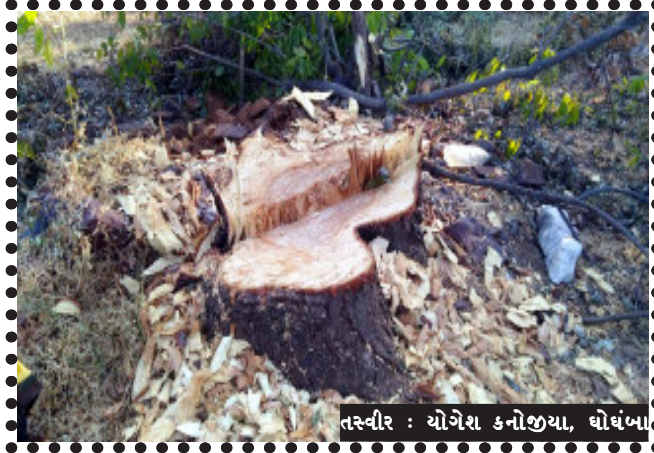
તસ્વીર : ચોગેશ કનોજીયા, ઘોઘંબા

ઘોઘંબા, ઘોઘંબા તાલુકાના પોચલી (સરસવા) ગામે રહેતા ફરિયાદીના રે.સર્વે નંબર ૧૩૦ વાળી જમીનમાં ઉછેરવામાં આવેલ સાગ, સેવન, લીમડા જેવા ઝાડોને ગામના બે ઈસમો દ્વારા રાત્રીના સમયે બારોબાર કાપીને વેચી નાખવામાં આવ્યા હતા અને ઝાડો કાપવાને લઈ ખેતરમાં ઉભા પાકને નુકશાન કરવામાં આવ્યું. આ બાબતે