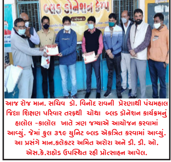
આજ રોજ માન. સચિવ ડો. વિનોદ રાવની પ્રેરણાથી પંચમહાલ જિલ્લા શિક્ષણ પરિવાર તરફથી ચોથા બ્લડ ડોનેશન કાર્યક્રમનું હાલોલ-કાલોલ ખાતે ત્રણ જગ્યાએ આયોજન કરવામાં આવ્યું. જેમાં કુલ ૩૧૯ યુનિટ બ્લડ એકત્રિત કરવામાં આવ્યું. આ પ્રસંગે માન.કલેક્ટર અમિત અરોરા અને ડી. ડી. ઓ. એસ.કે.રાહોડ ઉપસ્થિત રહી પ્રોત્સાહન આપેલ.

કાલોલ, કાલોલ તાલુકાના દેવચોટીયા પંચાયતના ઝીલીયા ગામના વણકારવાસમાં રહેતા સ્થાનિકોએ કાલોલ તાલુકા પંચાયત તરફ આવેલ આપી રજુઆત કરી હતી. આ અસરગ્રસ્તોના રજુઆત મુજબ વણકારવાસમાં જવા-આવવાના મુખ્ય રસ્તા ઉપર સ્થાનિકો દ્વારા દબાણો ઉભા કરી રસ્તાને સાંકળી બનાવી દીધો છે. અસરગ્રસ્તોના જણાવ્યા મુજબ અગાઉ સાત કુટુંબો પહોળો રસ્તો હતો પરંતુ દબાણોને કારણે હવે રિક્ષાઓ પણ માંડ લઈ શકાય એવી