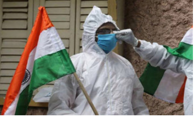
લોકોના મોત થઈ ચૂક્યાં છે. હવે એક્ટિવ દર્દીઓના કેસમાં ભારત હવે દુનિયાનો ૧૦મો દેશ બની ગયો છે. અહીં હવે ૨.૮૦ લાખ એક્ટિવ દર્દી છે.

ન્યુ દિલ્હી, દેશમાં કોરોનાના દર્દી ફક્ત સાજા જ નથી થઈ રહ્યાં, પણ હવે નવા કેસમાં પણ ઘટાડો થઈ રહ્યો છે. શનિવારે માત્ર ૧૮ હજાર ૫૭૫ નવા દર્દી નોંધાયા. ૨૧ હજાર ૪૬૬ સાજા થઈ ગયા, જ્યારે ૨૮૦ લોકોના મોત થઈ ગયા. એક્ટિવ કેસમાં ૩૧૮૧ નો ઘટાડો થયો. એક્ટિવ કેસનો અર્થ જે દર્દીઓની સારવાર ચાલી રહી છે. ડિસેમ્બરમાં ત્રીજી વખત છે, જ્યારે નવા કેસ ૨૦ હજારથી ઓછા નોંધાયા છે. આ પહેલા ૧૬ ડિસેમ્બરે ૧૮ હજાર ૧૭૨ દર્દી મળ્યા, ૨૧ ડિસેમ્બરે ૧૯ હજાર ૧૪૭ અને ૨૬ ડિસેમ્બરે ૧૮ હજાર ૫૭૫ દર્દીઓનો રિપોર્ટ પોઝિટિવ નોંધાયો. આ પહેલા ૧૬ જુલાઈએ ૧૯ હજાર ૪૩૦ કેસ નોંધાયા હતા. પછી ૧૫ ડિસેમ્બર સુધી એક વાર પણ આ આંકડો ૨૦ હજારથી ઓછો નથી થયો. દેશમાં અત્યાર સુધી ૧.૦૧ કરોડ કેસ નોંધાઈ ચૂક્યાં છે. ૯૭.૬૦ લાખ દર્દી સાજા થઈ ચૂક્યાં છે. જ્યારે ૧.૪૭ લાખ