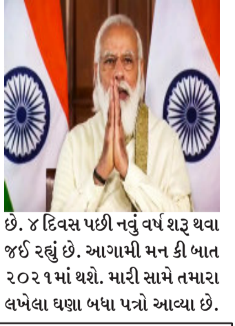
આપ પત્ર દ્વારા સૂચનો મોકલો છો. વેક્ટ ઘણા લોકોએ ફોન પર વાત કરી. મોટાભાગની વાતોમાં પાછલા વર્ષોના અનુભવ અને નવા વર્ષના સંકલ્પો છે. મોદીએ મન કી બાતમાં સંબોધન કરતાં કહ્યું કે, મિત્રો, દેશ પર ઘણું સંકટ આવ્યું, વિશ્વમાં સપલાય ચેઈનમાં અવરોધો પણ આવ્યા, પરંતુ આપણે દરેક કટોકટીનો હિંમતથી સામનો કર્યો છે. દિલ્હીના અભિનવને બાળકોને ગિફ્ટ આપવી હતી તે દિલ્હીના ઝાંડવાલાન માર્કેટમાં ગયા હતા. અભિનવ કહે છે કે ત્યાં દુકાનદારો ત્યાં બોલીને સામાન વેચતા હોય છે કે આ રમકડા ભારતમાં બનાવવામાં આવે છે.

ન્યુ દિલ્હી, વડાપ્રધાન મોદીએ વર્ષ ૨૦૨૦ની અંતિમ મન કી બાત કાર્યક્રમ દ્વારા સંબોધતા લોકોને ફરી વોકલ ફોર લોકલ માટેની વાત કરી. વડાપ્રધાને કાર્યક્રમને સંબોધન કરતાં કહ્યું કે નવું વર્ષ ચાર દિવસ પછી શરૂ થવા જઈ રહ્યું છે. આગામી વર્ષે નવા વર્ષની મન કી બાત થશે. વર્ષ ૨૦૨૦નો આ મોદીનો છેલ્લો 'મન કી બાત' કાર્યક્રમ હતો. આજે ૨૭ ડિસેમ્બર