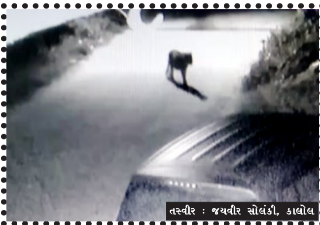
તસ્વીર : જયવીર સોલંકી, કાલોલ

કાલોલ, પંચમહાલ જિલ્લાના ઘોઘંબા તાલુકામાં દિપડાના આંતકને લઈ પન વિભાગ સર્તક બન્યું હતું અને માનવબક્ષી દિપડાને મહામહેનતથી પાંજરે પુરવામાં આવ્યો છે. ત્યારે કાલોલ તાલુકાના રાબોડ ગામમાં છેલ્લા બે દિવસ થી વહેલી સવારે દિપડો આંટા મારતો હોય તેવા સીસીટીવી કેમેરામાં કેદ થતાં ગ્રામજનોમાં ફફડાટ વ્યાપી જવા પામ્યો છે.