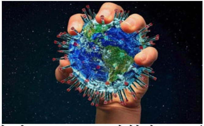
કે તારીખ ૨૭-૧૨-૨૦૨૦ના સાંજના ૪-૩૦ વાગ્યા સુધીમાં ૧૯૨૫ કેસ પોઝિટિવ નોંધાયા છે.