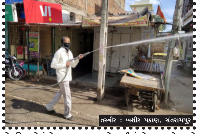
સંતરામપુર નગરપાલિકા દ્વારા આજે નગરના દરેક વિસ્તારોમાં નગરપાલિકાના ચીફ ઓફિસરે સુચના આપેલ છે કે દરેક સરકારી કચેરીમાં અને નગરના દરેક વિસ્તારોમાં સેનીટાઈઝર કરવામાં આવેલું હતું. કોરોના સંખ્યાનું પ્રમાણ ઠીક ઠીક રહેવા માટે આજે સવારથી નગરપાલિકાના કર્મચારીઓએ અને સફાઈ કામદારોએ સફાઈ પાલ કરવામાં આવી હતી અને નગરના