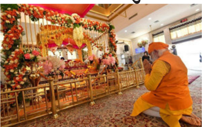
સુરક્ષા વ્યવસ્થા નહોતી. સંસદ ભવન નજીક આવેલું છે. જેનું નિર્માણ સન ૧૭૮૮માં થયું હતું. આ તે જ સ્થળ છે જ્યાં શીખોના નવમાં

ન્યુ દિલ્હી, વડા પ્રધાન નરેન્દ્ર મોદી આજે સવારે દિલ્હી સ્થિત ગુરુદ્વારા રકાબગંજ પહોંચ્યા જ્યાં તેમણે ગુરુ તેગબહાદુરને શ્રદાંજલિ આપી. વડા પ્રધાન નરેન્દ્ર મોદીનો આ પ્રવાસ અચાનક નક્કી થયો હતો. જ્યારે વડા પ્રધાન મોદી અહીં પહોંચ્યા તો કોઈ વિશેષ પોલીસ બંદોબસ્ત નહોતો તેમજ કોઈ પણ પ્રકારનું ટ્રાફિક ડાયવર્ઝન કરવામાં આવ્યું નહોતું. વડા પ્રધાન નરેન્દ્ર મોદીનો આ પ્રવાસ અચાનક નક્કી થયો હોવાથી ગુરુદ્વારાની આસપાસ કોઈ વિશેષ