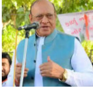
ખેડૂતો મરશે. ખેડૂતોને જીવતા રાખવા હોય તો કૃષિ કાયદાને મારવો પડશે. નવા કૃષિકાયદાના વિરોધમાં છેલ્લા ૨૫ દિવસથી ખેડૂતો આંદોલન પર બેઠા છે તેમ છતાં તેમના પ્રશ્નનું કોઈ સમાધાન નથી આવી રહ્યું છે. ૨૫ ડિસેમ્બર સુધી સરકાર દ્વાર કોઈ કડકડતી ઈંદીમાં સરકાર દ્વાર કોઈ નક્કર પરિણામ ન આવતા આખરે શંકરસિંહ વાઘેલાએ વીડિયો શેર કરીને ચિમકી ઉચ્ચારી હતી.

ગાંધીનગર, ગુજરાતમાં ખેડૂત આંદોલનને ધીરે ધીરે સમર્થન મળી રહ્યું છે ત્યારે પોતાના બેબાક નિવેદનો માટે જાણીતા ગુજરાતના પૂર્વ મુખ્યમંત્રી શંકરસિંહ વાઘેલાનો વીડિયો સામે આવ્યો છે જેમાં તેમણે ખેડૂત આંદોલનને સમર્થન આપ્યું છે. પૂર્વ મુખ્યમંત્રી શંકરસિંહ વાઘેલાની જાહેરાતને પગલે રાજકારણમાં ખળભળાટ મચી ગયો છે. ખેડૂત આંદોલનના સમર્થનમાં શંકરસિંહ વાઘેલાની મોટી જાહેરાત કરી છે. શંકરસિંહ વાઘેલાએ ચિમકી ઉચ્ચારી છે કે, ૨૫ ડિસેમ્બર સુધી સરકાર ખેડૂતોની માંગણી સ્વીકારે જો માંગણી નહીં સ્વીકારાય તો હું દિલ્હી રાજઘાટ ખાતે અનિશ્ચિતકાળ માટે અનશન પર ઉતરીશ જો આ કાયદો રહેશે તો