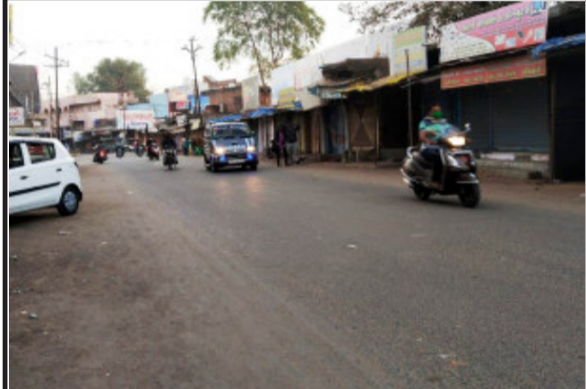
સંતરામપુર નગરમાં ગુમસ્તા ધારાનો અમલ કરવામાં આવ્યો. સંતરામપુર નગરમાં નગરપાલિકા દ્વારા જાહેરાત કરવામાં આવેલી કે રવિવારના રોજ દરેક વેપારીઓએ ધંધા-રોજગાર બંધ રાખીને ગુમસ્તા ધારા નો અમલ કરવામાં આવેલો હતો. સંતરામપુર નગરના દરેક વિસ્તારોમાં સ્વયંબૂ બંધ રહ્યું હતું. કચ્છું જેવો માહોલ જોવાયો હતો. નગરના વેપારીઓએ મતદાનનો અમલ કર્યો હતો.

કોન કરીને આવા લગ્ન થતા અટકાવે છે. જોકે શિક્ષણનો આભાવ અને ઓછી સમજણના કારણે આ પ્રકારના ચાર્જલ્ડ મેરેજના બનાવ વધતા હોય છે. ના માત્ર અભયમ પણ નેશનલ ફેમિલી હેલ્થ સર્વે પ્રમાણે ગુજરાતમાં ૨૧.૮ ટકા મહિલાઓ ૧૮ વર્ષ પહેલા લગ્ન કરે છે. જેમાં શહેરી વિસ્તારમાં ૧૪.૨ ટકા, જ્યારે ગ્રામ્ય વિસ્તારમાં ૨૬.૮ ટકા મહિલાઓના ૧૮ પહેલા જ લગ્ન કરી દેવામાં આવે છે. ખાસ કરીને આશા વર્કર શિક્ષક ખાસ લગ્નને લઈને લોકોમાં જાગૃતતા લવામાટે કામ પણ કરે છે. આમ સમય જતા ટેકનોલોજી અને આપડે સ્માર્ટ ભલે બન્યા હોય પણ હજુ પણ કેટલાક સામાજિક રિવાજો ધર કરીને બેઠા છે. જેના કારણે બાળ લગ્નના બનાવો સામે આવે છે.