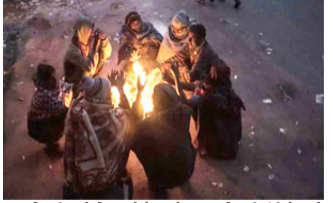
અમદાવાદ, રાજ્યમાં કેટલાક દિવસોથી ઠંડીનું જોર વધી રહ્યું છે. હવામાન વિભાગ દ્વારા ઠંડીને લઈ વધુ એક આગાહી કરવામાં આવી છે. ઉત્તર ભારત તરફથી ફૂંકાતા ઠંડા પવનના કારણે ગુજરાતમાં ઠંડીએ સપાટો બોલાવ્યો છે. ગુજરાતમાં ઠંડીમાં દિવસેને દિવસે વધારો થઈ રહ્યો છે. સતત બીજા દિવસે ૮ શહેરમાં સરેરાશ લઘુત્તમ તાપમાન ૧૨ ડિગ્રીથી નીચે નોંધાયું હતું. નલિયામાં તો પાચો ગગડીને ૩.૮ ડિગ્રી પહોંચી ગયો હતો.