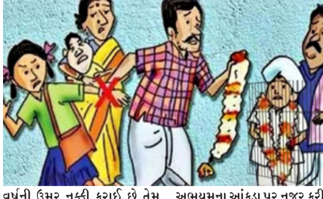
વર્ષની ઉંમર નક્કી કરાઈ છે તેમ છતાં આધુનિક યુગમાં પણ જૂની સામાજિક પરંપરાના કારણે બાળ લગ્નના કેસો ગુજરાતમાં વધી રહ્યા છે. અભયમના આંકડા પર નજર કરીએ તો ગુજરાતમાં દર વર્ષે ૧૭૫ જેટલા બાળ લગ્નના બનાવો સામે આવે છે. આમ ચાર્જલ્ડ મેરેજ ૨૦૧૫ની સરખામણી ૨૦૧૯ મા ૨૫ ટકાનો વધારો થયો છે. એક અંદાજ પ્રમાણે દર ૨ દિવસે ગુજરાતમાં એક બાળ લગ્ન થાય છે. દર વર્ષે ૧૭૫ જેટલા બાળ લગ્ન થાય છે. અનેક કિસ્સાઓમાં તો આશા વર્કર અને શાળાના શિક્ષકો

ગાંધીનગર, રાજ્યમાં વિકાસની વાતો અને મહિલા સશક્તિકરણના દાવા વચ્ચે બાળ લગ્નના બનાવો વધ્યા છે. ૫ વર્ષમાં ૧ હજાર જેટલા બાળ લગ્નના બનાવો સામે આવ્યા છે. આ તો માત્ર સત્તાવાર આંકડો છે કે જે પોલીસ ચોપડે પહોંચ્યા છે. સત્તાવાર આંકડો તો ઘણો ઉંચો છે. રાજકારણથી લઈને બોલીવુડ સુધી તમામ જગ્યાએ મહિલાઓને સ્થાન અને પ્રતિષ્ઠા મળી છે. પણ તેમ છતાં હજુ જૂની સામાજિક પ્રથા અટકી નથી. તેમાની એક છે બાળ લગ્ન. આમ તો મહિલાઓ લગ્ન માટે ૧૮