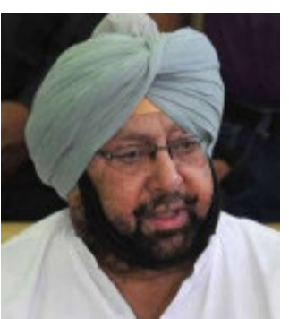
કેન્દ્ર સરકારે હવે સંઘર્ષને નબળો કરવા માટે અઠિતિયાઓને નિશાન બનાવવાનું શરૂ કર્યું છે, જે પ્રથમ દિવસથી જ સંપૂર્ણ સક્રિયતાથી ખેડૂત આંદોલનને સપોર્ટ કરી રહ્યાં છે.

ચંડીગઢ, ઈકમ ટેકસ વિભાગે રવિવારે પંજાબના ૧૦થી વધુ આઠતિયાઓના ઠેકાણા પર રેડ કરી છે. રાજ્યના મુખ્યમંત્રી કેપ્ટન અમરિંદર સિંહે આ વાતની ટીકા કરતા કહ્યું કે આ આંદોલન કરી રહેલા ખેડૂતોને સપોર્ટ કરી રહેલા આઠતિયાઓને ડરાવવા અને ધમકાવવાની કેન્દ્રની ચાલ છે. તેમણે ચેતવણી આપી છે કે આ રીતેથી કેન્દ્રની વિરુદ્ધનો લોકોનો રોષ વધશે.