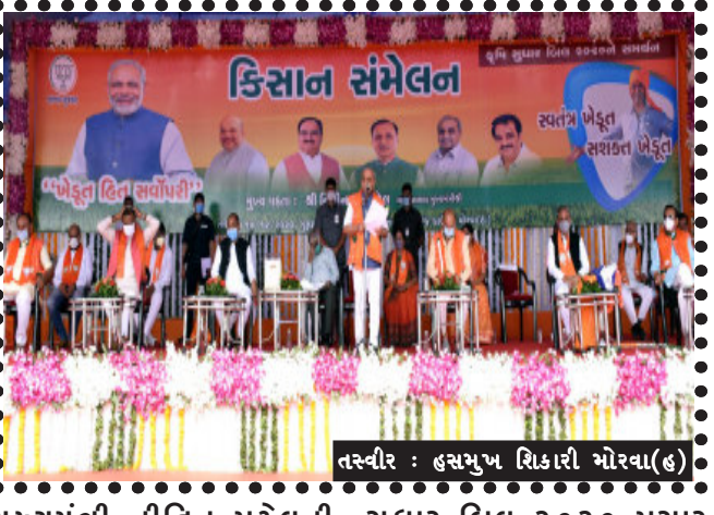
મોરવા(હ)

મોરવા(હ), પંચમહાલ જિલ્લાના મોરવા હડક ખાતે રાજ્યના નાયબ મુખ્યમંત્રી નીતિન પટેલની અધ્યક્ષતામાં પંચમહાલ, મહીસાગર અને દાહોદ જિલ્લાનું સંયુક્ત કિસાન સંમેલન યોજાયું હતું. જેમાં નીતિન પટેલે નવું કૃષિ સુધારા બિલ ૨૦૨૦ દેશના કરોડો ખેડૂતો માટે ફાયદાકારક હોવાનું જણાવ્યું હતું, સરકારની કોવિડ ગાઈડલાઈન્સના પાલન સાથે યોજાયેલા આ કાર્યક્રમમાં મોટી સંખ્યામાં ત્રણેય જિલ્લાના ભાજપના હોદ્દેદારો કાર્યકરો ઉપસ્થિત રહ્યા હતા.