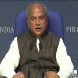
બિલ પસાર થયું. રાજ્યસભામાં ૪ કલાક ચર્ચા ચાલી. તે દિવસે એક અભદ્ર ઘટના પણ વિપક્ષના સભ્યો કરી. આજે ત્રણેય કાયદાઓ લાગુ છે. તેઓએ કહ્યું કે કૃષિ ક્ષેત્રે ખાનગી

ન્યુ દિલ્હી, કૃષિ મંત્રી નરેન્દ્રસિંહ તોમરે ગુરુવારે નવા કૃષિ કાયદા પર કેન્દ્ર સરકારનો પક્ષ રાખ્યો. તેઓએ કહ્યું કે સરકાર સંસદના છેલ્લા સત્રમાં ડી.સી.આર.થી સંસદને બેચી જાણ કરવા માટે આ કાયદા, જેમાં કૃષિ ઉપજનો વેપાર અને વાણિજ્ય, મૂલ્ય અને આસ્વાસન સાથે સંબંધિત છે. આ કાયદાઓ પર લોકસભા અને રાજ્યસભામાં તમામ પક્ષના સાંસદોએ ૪-૪ કલાક સુધી પોતાના વિચારો રજૂ કર્યા. લોકસભામાં આ