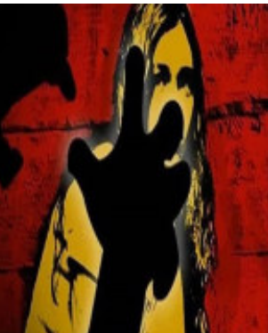
સંડોવાયેલા આરોપીઓને મોડું કયાં વગર પકડવાના નિર્દેશ આપ્યા. તેમણે કહ્યું કે પીડિતાને મેડિકલ તપાસ માટે મોકલી દેવાઈ

રાંચી, ઝારખંડમાં દુમકા જિલ્લાના મુક્તસિલ પોલીસ સ્ટેશનમાં પતિની સાથે મેળો જોઈને ઘરે પાછી આવી રહેલ પાંચ બાળકોની માતા સાથે સામૂહિક દુષ્કર્મ થયાનો કિસ્સો સામે આવ્યો છે. આ ઘટના મંગળવારે મોડી રાત્રે એ સમયે બની જ્યારે મહિલા મેળો જોઈને પાછી આવી રહી હતી. સંશયલની ડીઆઈજી સુદર્શન પ્રસાદ માંડલએ ઘટનાની પુષ્ટિ કરતાં કહ્યું કે પોલીસ કેસની તપાસ કરી રહ્યું છે. સાથો સાથ ઘટનામાં સંડોવાયેલા આરોપીઓની ધરપકડ માટે કાર્યવાહી શરૂ કરી દીધી છે. આની પહેલાં ડીઆઈજીની સાથે પોલીસ અધિક્ષક અંબર લકડાએ ઘટનાની માહિતી મળતા જ પોલીસ અધિકારીઓને મુક્તસિલ પોલીસ સ્ટેશન પહોંચીને ઘટનાના સંબંધમાં માહિતી લીધી અને પીડિત મહિલાના નિવેદનના આધાર પર કેસની તાત્કાલિક તપાસ કરીને