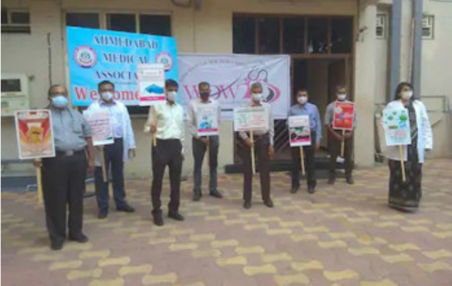
મેડિકલ અસોસિએશન દ્વારા વિરોધ કરવામાં આવ્યો છે અને આ વિરોધ અંતર્ગત આજે મેડિકલ સેવા બંધનું એલાન આપવામાં આવ્યું છે. તમને જણાવી દઈએ કે, આજે ભારતભરના ૩ લાખ ડોક્ટરો

હડતાળ પાડવાના છે. જેમાં ગુજરાતના ૨૮ હજાર અને અમદાવાદના ૧૦ હજાર ડોક્ટરો પણ જોડાશે. ૧૧મી ડિસેમ્બરે ઈમરજન્સી અને કોવિડ ડ્યુટી સિવાય તમામ ઓપીડી બંધ રાખવાનું આહવાન કરવામાં આવ્યું છે. ૮ ડિસેમ્બર એ તબીબોએ મર્યાદિત સંખ્યામાં અલગ-અલગ ડોક્ટરોની જૂથ બનાવી બેનર્સ અને પ્લેકાર્ડ સાથે ડોક્ટરોએ વિરોધ કર્યો હતો. સેન્ટર કાઉન્સિલ ફોર ઈન્ડિયન મેડિસિન દ્વારા એક નોટિફિકેશન બહાર પડ્યું છે જેનો