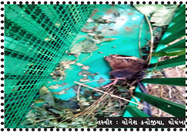
તસ્વીર : યોગેશ કનોજીયા, ઘોંબા

ઘોંબા, ઘોંબા તાલુકાના કાંટાવેડા તેમજ ગોચાસુંડલ ગામોમાં આદમખોર દિપડાના હુમલામાં બે માસૂમ બાળકોના મોતની ઘટના બનવા પામી છે. ત્યારે લાંબા સમયથી લોકોની માંગને અવગણના કરતું ફોરેસ્ટ વિભાગ સફાળું જાગ્યું હોય તેમ લાગ્યું છે. આદમખોર દિપડાને પાંજરે પુરવા માટે ઘટનાવાળા ગામો તેમજ જંગલ વિસ્તારોમાં પાંચ જેટલા પાંજરામાં મારણ