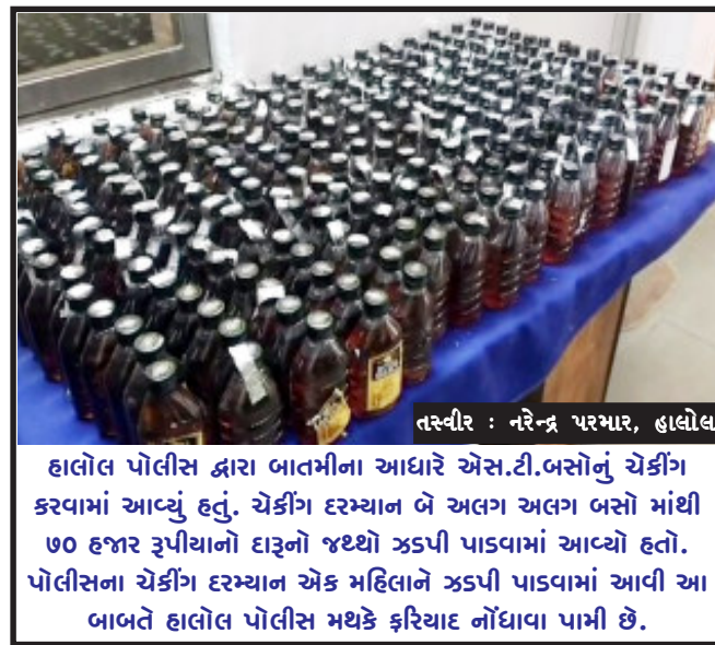
હાલોલ પોલીસ દ્વારા બાતમીના આધારે એસ.ટી.બસનો ચેકિંગ કરવામાં આવ્યું હતું. ચેકિંગ દરમ્યાન બે અલગ અલગ બસો માંથી ૭૦ હજાર રૂપિયાનો દાકનો જથ્થો ઝડપી પાડવામાં આવ્યો હતો. પોલીસના ચેકિંગ દરમ્યાન એક મહિલાને ઝડપી પાડવામાં આવી આ બાબતે હાલોલ પોલીસ મથકે ફરિયાદ નોંધાવા પામી છે.

રફતાર જોવા મળી છે. રાજ્યમાં અત્યાર સુધીમાં કોવિડના કારણે કુલ ૨૨,૨૮૧ દર્દીઓ સંક્રમિત થઈ ચુક્યા છે. આ સાથે જ અમદાવાદમાં કુલ કેસનો આંકડો ૫૦૦૦૦ને પાર થઈ ગયો છે.