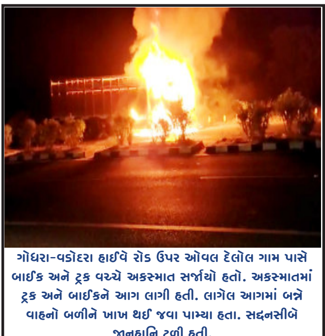
ગોધરા-વડોદરા હાઈવે રોડ ઉપર ઓવલ દેલોલ ગામ પાસે બાઈક અને ટ્રક વચ્ચે અકસ્માત સર્જાઈ હતી. અકસ્માતમાં ટ્રક અને બાઈકને આગ લાગી હતી. લાગેલ આગમાં બંને વાહનો બળીને ખાખ થઈ જવા પામ્યા હતા. સદનસીબે જાનહાનિ ટળી હતી.