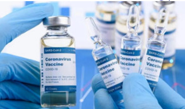
વિભાગને વેક્સિન આપવામાં આવશે. ૨સી આપવા માટે તાલુકા નક્કી કરાયા છે. કોરોનાની રસીકરણની પૂર્વ તૈયારીઓને લઈને વડોદરામાં આજથી ડોઝ ટૂ ડોઝ સર્વે શરૂ કરાયો છે. વડોદરા જિલ્લામાં ૧૩૧૦ ટીમો દ્વારા સર્વેની કામગીરી શરૂ કરવામાં આવી છે. વડોદરા જિલ્લાના ગ્રામ્ય

ગાંધીનગર, અમદાવાદની સોલા સિવિલ હોસ્પિટલમાં કોરોનાની વેક્સિનની ટ્રાયલ ચાલી રહી છે. ત્યારે રાજ્યના તમામ જિલ્લા કલેક્ટર તથા જિલ્લા વિકાસ અધિકારી મારફત ૧૦ ડિસેમ્બર (આજથી) થી ૧૩ ડિસેમ્બર દરમિયાન કરવામાં આવી છે. જેના આધારે આજે વહેલી સવારથી અમદાવાદ, વડોદરા, રાજકોટ, સુરત સહિતના શહેરોમાં સર્વેની કામગીરી શરૂ થઈ ગઈ છે. આ કામગીરી માટે ચૂંટણી દરમિયાન જે રીતે મતદાન મથકદીઠ ટીમની રચના થાય છે, એ રીતે સર્વે ટીમ બનાવીને કામગીરી કરવા જણાવવામાં આવ્યું છે. સૌથી પહેલા આરોગ્ય