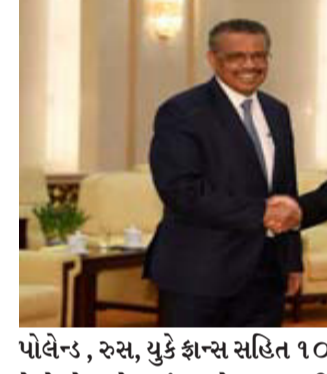
વોહાન મોત થઈ ચૂક્યા છે. દર રોજ થનારી મોતમાં બીજી નંબર પર નોર્થ અમેરિકા અને ત્રીજા નંબર પર એશિયા છે. નોર્થ અમેરિકામાં સુધીમાં સંક્રમણથી ૩.૮૬ લાખ

જિનિવા, વર્લ્ડહેલ્થ ઓર્ગેનાઈઝેશનના ડાયરેક્ટર જનરલ ટેડ્રોસ ઘેબ્રેયસસનું કહેવું છે કે કોરોના વાયરસ ક્યાંથી આવ્યો તે જાણવું જરૂરી છે. આ અંગે ડબલ્યુએચઓનું વલણ બિલકુલ સ્પષ્ટ છે. આમ કરવાથી ભવિષ્યમાં થનારી બિમારીને રોકવામાં મદદ મળી શકે છે. બીજી તરફ સારા સમાચાર એ છે કે અમેરિકન કંપની મોડર્ના પોતાની કોરોનાની રસીના ઈમરજન્સી ઉપયોગ માટે મંજૂરી માટે અમેરિકન અને યુરોપિયન રેગ્યુલેટરને એલાય કર્યું છે. રસીના લાસ્ટ સ્ટેજ ટ્રાયલ બાદ કંપનીએ દાવો કર્યો છે કે આ કોરોનાથી લડવામાં ૯૪ ટકા કારગત છે.