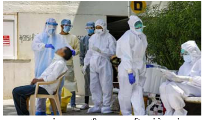
ગુજરાતમાં અત્યાર સુધી કોરોના માટે કરવામાં આવતા RT-PCT ટેસ્ટ માટે જનતા પાર્ટીના લગભગ ૧૫૦૦ થી

રાજ્યમાં RT-PCT ટેસ્ટના ચાર્જને લઈ મોટી જાહેરાત કરી હતી. રાજ્ય સરકારની જાહેરાત બાદ હવેથી કોરોનાના ટેસ્ટ માટે લેબોરેટરીમાં RT-PCR ટેસ્ટના ૮૦૦ રૂપિયા ચાર્જ લેવાશે. નવા ચાર્જનો અમલ શરૂ કરી દેવાયો. કીટની કિંમતમાં ઘટાડો કરવામાં આવ્યો છે. જ્યારે ઘરે જઈને ટેસ્ટ કરવા માટે રૂ. ૧૧૦૦ ચાર્જ રહેશે. આ પહેલા રાજ્યમાં પાનગી લેબમાં RT-PCR ટેસ્ટ કરાવવાનો ખર્ચ ૧૫૦૦-૨૦૦૦ રૂપિયા થતો હતો.