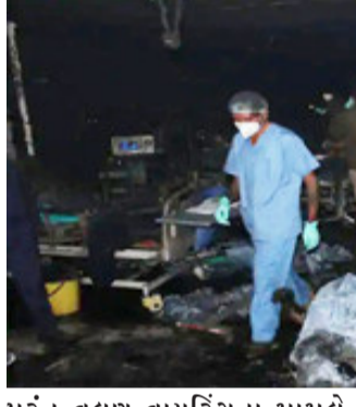
પરંતુ વલણ વાયરિંગના મામલે પોતાના ચીફ ઈલેક્ટ્રિકલ એન્જિનિયરના રિપોર્ટથી વિપરિત છે. તમે માત્ર તપાસ પંચને રચીને પુશો છો.

ન્યુ દિલ્હી, રાજકોટમાં કોવિડ હોસ્પિટલમાં આગ લાગવા સાથે જોડાયેલા કેસમાં સુપ્રીમ કોર્ટે ગુજરાત સરકારની ફરી ઝાટકણી કાઢી છે. સુપ્રીમે કહ્યું કે, સરકાર રાજકોટ આગકાંડ વિશે તથ્યોને ધ્યાનમાં લઈ પ્રયાસ કરી રહી છે. ગુજરાતના જવાબથી નાખુશ સુપ્રીમ કોર્ટે કહ્યું કે રાજ્યને તથ્યોને દબાવવા ન જોઈએ. સાચા તથ્યોની સાથે એક નવું સોગંદનામું દાખલ કરવાનો નિર્દેશ આપવો પડશે. સુપ્રીમ કોર્ટે કહ્યું કે, આપના જણાવ્યા અનુસાર બધું સારું છે,