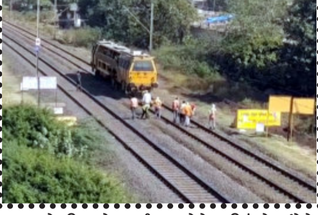
સમય બાદ રેલ વિભાગને સમયની કુરસદ ન હોવાને લીધે મેન્ટેનન્સ હાથ ધરવામાં આવે છે. ત્યારે લાંબા

ગોધરા, ગોધરા અને દાહોદ જિલ્લાને જોડતી રેલ લાઇનને લાંબો સમય બાદ મેન્ટેનન્સ હાથ ધરવામાં આવી હતી. સુરક્ષા તથા સમયસર રેલ વ્યવહારને આપનજાવન સુગમતા રહે તેની તકેદારી રાખવામાં આવી હતી.