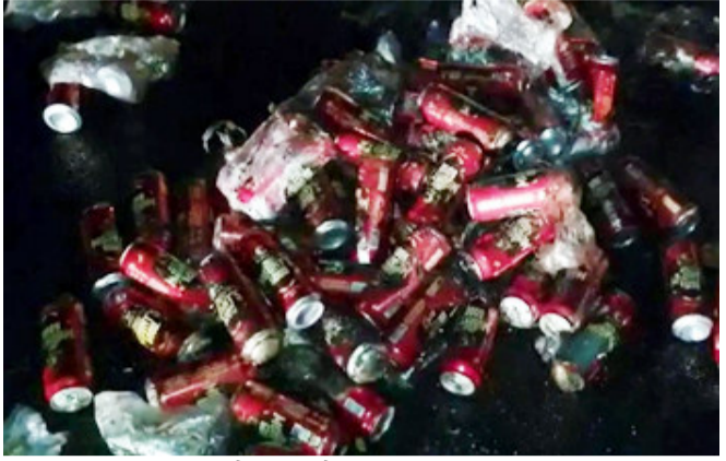
પકડાઈ જવાની બીકે ચાલકે અથવા તો તેના મળતીયાઓ દ્વારા દારૂનો નાશ અને પુરાવાનો નાશ કરવા આ આગને અંજમ આપ્યો હતો. ગતરોજ મોડી રાત્રીના સમયે વરખખેડા ગામેથી હસોહસ દારૂ ભરેલ બોલેરો ફોર વ્હીલર ગાડી પસાર થઈ રહી હતી. રસ્તામાં અકસ્માતે આ દારૂ ભરેલ ગાડીને

દાહોદ, દાહોદ તાલુકાના દેવધા ખાન નદીની નજીક એક દારૂ ભરેલ બોલેરો પીકઅપ ફોર વ્હીલર ગાડી પલ્ટી ખાઈ જતાં જોતજોતામાં આ દારૂ ભરેલ ગાડીમાં આગ લાગી ગઈ હતી. ઘટનાની જાણ ફાયર ફાઈટરોને થતાં તેઓ પણ ઘટના સ્થળે પહોંચી જઈ આગને કાબુમાં લીધી હતી પરંતુ અહીં ચોક્કાપનારી વાત એ જાણવા મળી છે કે, દારૂ ભરેલ આ ગાડી પલ્ટી ખાતાની સાથે જ સ્થાનીકોને આ ઘટનાની જાણ થતાં દારૂની લુંટફાટ કરવા સ્થળ પર લોકોના ઢોળેઢોળા ઉમટી પડ્યા હતા. જાણવા મળ્યા અનુસાર, આ ગાડીમાં આગ લગાડવામાં આવી હતી. પલ્ટી ખાઈ ગયા બાદ તો ગાડીમાં આગ ન હતી લાગી પરંતુ સ્થાનીકોમાં એ પણ ચર્ચા થઈ પામી હતી કે,