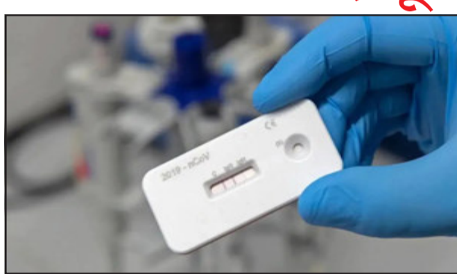
પડશે. સિમ્ટોમેટિક દર્દીના આરટીપીસીઆર અને રેપિડ બંને નેગેટિવ આવે તો સ્વાઈન ફ્લૂનો ટેસ્ટ કરાવવો પડશે. આરોગ્ય વિભાગે જાહેર

ગાંધીનગર, ગુજરાતમાં હવે રેપિડ એન્ટિજન તેમજ આરટીપીસીઆર ટેસ્ટ નેગેટિવ આવે તો સ્વાઈન ફ્લૂનો ફરજિયાત ટેસ્ટ કરાવવો પડશે. ગુજરાતમાં બીજા રાઉન્ડમાં કોરોના કેસ ફેડકેને ભૂસકે વધી રહ્યા છે. જે જોવા બાદ કેન્દ્રમાંથી આવેલી ટીમે કેટલાક સૂચનો કર્યાં છે. જેના અમલરૂપે આરોગ્ય વિભાગ આ નિર્ણય લીધો છે. આ વિશે ગાઈડલાઈન જાહેર કરવામાં આવી છે કે, ગુજરાતમાં હવે રેપિડ નેગેટિવ આવે તો સિમ્ટોમેટિક દર્દીઓને આરટીપીસીઆર ટેસ્ટ કરાવવો