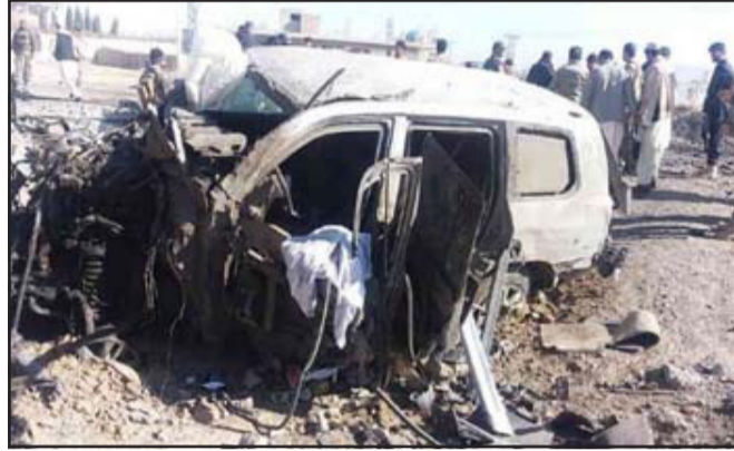
પોલીસ કર્મીઓ પાસે આવીને વિસ્ફોટકો ભરેલી કારને ઉઠાવી આત્મઘાતી હુમલાખોરે દીધી હતી. જેના પગલે ચારે તરફ

કાબૂલ, અફઘાનિસ્તાન ફરી એક વખત આત્મઘાતી હુમલાના પગલે ધ્રુજ ઉઠ્યું છે. મળતી વિગતો પ્રમાણે અફઘાનિસ્તાનના ગજની પ્રાંતમાં આ હુમલો થયો છે અને તેમાં ઓછમાં ઓછા ૨૬ પોલીસ કર્મીઓ માર્યા ગયા હોવાના અહેવાલો મળી રહ્યા છે. અફઘાનિસ્તાનના ગજની પ્રાંતમાં રવિવારે સવાલે પબ્લિક પ્રોટેક્શન યુનિટના