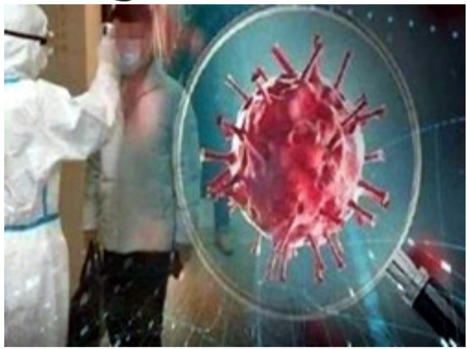
તાલુકાના ૦૩ પુરૂષ, લુણાવાડા તાલુકાની ૦૨ સ્ત્રી, સંતરામપુર તાલુકાના ૦૩ પુરૂષોનો કોરોના રીપોર્ટ પોઝીટીવ આવ્યો છે. આમ, જિલ્લામાં

લુણાવાડા, કોરોના વાયરસની સામે લડવા કેન્દ્ર અને રાજ્ય સરકારે અગમચેતીનાં સંખ્યાબંધ પગલાંઓ લીધા છે. કોરોના સામે લડવા લોકોની જાગૃતિ એટલી જ જરૂરી છે. જાગૃતિ અને સાવધાની એ જ બચાવનું શ્રેષ્ઠ માધ્યમ સાબિત થયા છે. ત્યારે મહિસાગર જિલ્લા કલેક્ટર આર. બી. બારડ અને જિલ્લા વિકાસ અધિકારી નેહા કુમારીના સીધા માર્ગદર્શન હેઠળ જિલ્લા આરોગ્ય તંત્ર દ્વારા અનેકવિધ પગલાંઓ ભરવામાં આવી રહ્યા છે. મહિસાગર જિલ્લામાં આજે બાલાસિનોર તાલુકાની ૦૪ સ્ત્રી, ૦૪ પુરૂષ, ખાનપુર