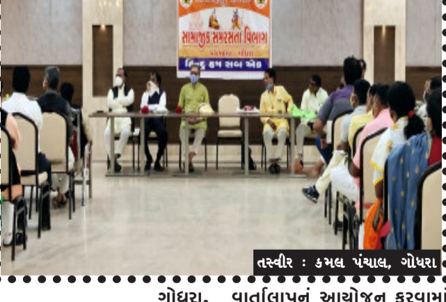
ગોધરા, ગોધરા શહેરમાં આજે વિશ્વ હિન્દુ પરિષદના રાષ્ટ્રીય પ્રવક્તાની ઉપસ્થિતિમાં અને ઉપક્રમે સામાજિક સમરસતા ગોષ્ઠી વાર્તાલાપ યોજવામાં આવ્યો હતો, જેમાં શહેરના વિવિધ સમાજના આગેવાનો અને કાર્યકરોને આમંત્રિત કરવામાં આવ્યા હતા. આ સમરસતા ગોષ્ઠીમાં વિશ્વ હિન્દુ

ઉદભવેલી વિષમતા દૂર કરીને અસર સમાજનું નિર્માણ કરવું, જે સંદર્ભે સમરસતા સમાજ સમર્થ સંગોષ્ઠિ બૌદ્ધિક વાર્તાલાપનું આયોજન કરવામાં આવ્યું હતું, જેમાં વિવિધ સમાજના આગેવાનો સાથે સમાજોમાં રહેલી વિષમતા કેવી રીતે દૂર કરી શકાય, અને સમરસતા કેવી રીતે લાવી શકાય, જેવા વિષયો પર ચર્ચા કરવામાં આવી હતી, આ કાર્યક્રમમાં રાષ્ટ્રીય સ્વયં સેવક સંઘ તેમજ વિશ્વ હિન્દુ પરિષદના હોદ્દેદારો અને કાર્યકરો ઉપસ્થિત રહ્યા હતા.