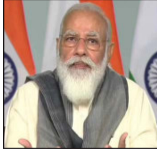
ખેડૂતોના અનેક બંધનોનો અંત આપ્યો એટલું જ નહીં પરંતુ તેમને અધિકારો પણ પ્રાપ્ત થયા છે અને નવી તક પણ ઉપલબ્ધ થઈ છે. આ અધિકારોથી ટૂંક સમયમાં જ ખેડૂતોની મુશ્કેલીઓમાં ઘટાડો થવા

ન્યુ દિલ્હી, વડાપ્રધાન નરેન્દ્ર મોદીએ મન કી બાત રેડિયો કાર્યક્રમમાં નવા કૃષિ કાયદા પર વાત કરી હતી. તેમણે જણાવ્યું કે ભારતમાં કૃષિ અને તેને સંલગ્ન ચીજો સાથે નવો અધ્યાય જોડાઈ રહ્યો છે. વિતેલા દિવસોમાં કૃષિ સુધારાઓએ ખેડૂતો માટે નવી સંભાવનાઓના દરવાજા ખોલ્યા છે. નવી તક પ્રાપ્ત કરાવી છે. વડાપ્રધાને જણાવ્યું કે વિસ્તૃત વિચાર વિમર્શ બાદ ભારતની સંસદે કૃષિ સંશોધનોને કાયદાનું સ્વરૂપ આપ્યું હતું. આ સંશોધનોથી ફક્ત