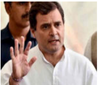
ન્યુ દિલ્હી, દિલ્હી સરહદ પર ઉચ્ચ આંદોલન કરીને સરકાર સામે મોરચો માંડનારા ખેડૂતોના સમર્થનમાં કોંગ્રેસના નેતાઓ પણ પહેલા જ દિવસથી ઉતરી ચૂકેલા છે. કોંગ્રેસના પૂર્વ અધ્યક્ષ રાહુલ ગાંધી નવા કૃષિ કાયદાને લઈને મોદી સરકારને સતત ઘેરી રહ્યા છે. હવે રાહુલ ગાંધીએ સૌશ્યલ મીડિયા પર કહ્યું છે કે, મોદી સરકારે ખેડૂતોની આવક બમણી કરવાનો વાયદો કર્યો હતો પણ ખેડૂતોની જગ્યાએ આ સરકારે અંબાણી અને અદાણીની આવક

બમણી કરી આપી છે. રાહુલ ગાંધીએ ટ્વિટ કરીને કહ્યું હતું કે, જે સરકાર કાળા કૃષિ કાયદાને અત્યાર સુધી યોગ્ય બતાવતી આવી છે તે ખેડૂતોના પક્ષમાં આ સમસ્યાનું સમાધાન કરશે તેવી આશા રાખવી નકામી છે પણ આ દેશમાં હવે ખેડૂતોની વાત થશે.