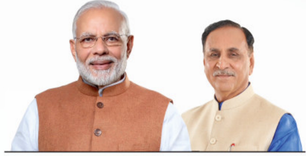
શ્રી નરેન્દ્રભાઈ મોદી પદાધિકારી, ભારત