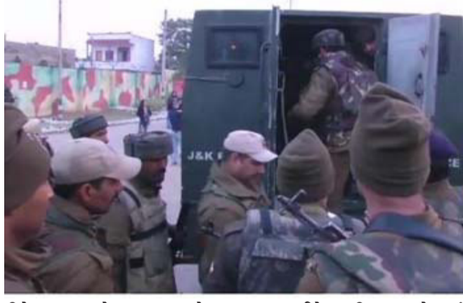
રીતે ઘાયલ થયેલા ૨ જવાનોના મોત થઈ ગયા છે. અત્યાર સુધીની જાણકારી પ્રમાણે આ હુમલામાં જૈશનો હાથ છે. ગોળીબાર બાદ હથિયાર બંધ આતંકવાદી કારમાં સવાર થઈને ભાગી ગયા. કહેવામાં આવે છે કે ત્રણ આતંકવાદીઓમાંથી ૨ પાકિસ્તાનના અને એક સ્થાનિક છે. આ પહેલા ગત શનિવારના પાકિસ્તાન તરફથી સંઘર્ષ વિરામનું

શ્રીનગરના બહારના વિસ્તાર પરિમ્પુરામાં ગુરુવારના કિવક રિસ્પોન્સ ટીમ પર આતંકવાદીઓના હુમલામાં ૨ સુરક્ષાકર્મચારીઓ શહીદ થઈ ગયા છે. પોલીસના એક અધિકારીએ જણાવ્યું કે આતંકવાદીઓએ પરિમ્પુરા વિસ્તારના ખુશીપુરામાં સુરક્ષાદળો પર ગોળીઓ વરસાવી. સુરક્ષાદળોએ વિસ્તારને ઘેરીને આતંકવાદીઓને શોધવા માટે સર્ચ ઓપરેશન શરૂ કરી દીધી છે.