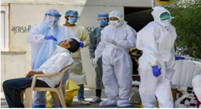
ન્યુ દિલ્હી, દેશના નાગરિકો એક તરફ કોરોનાની વેક્સીનની આતુરતાથી રાહ જોઈ રહ્યા છે, તો બીજી તરફ સંક્રમણ હજુ પણ સતત વધી રહ્યું છે. ભારતમાં કોરોનાથી સંક્રમિત લોકોની સંખ્યા હવે ૮૯ લાખ ૭૯ હજાર ૧૩૮ લોકો સાજા પણ થઈ ચૂક્યા છે. હાલમાં ૪૪,૪૮૮ એક્ટિવ કેસો છે. દેશમાં ૧૮ સામે લડતો પોતાનો જીવ ગુમાવે છે. કેન્દ્રીય સ્વાસ્થ્ય વિભાગ દ્વારા જાહેર કરવામાં આવેલા આંકડાઓ મુજબ, છેલ્લા ૨૪ કલાકમાં ૪૪,૪૮૮ નવા પોઝિટિવ કેસો નોંધાયા છે. આ ઉપરાંત કોવિડ-૧૯ના કારણે ૫૨૪ દર્દીઓએ

૧૩,૫૮,૩૧,૫૪૫ કોરોના સેમ્પલનું ટેસ્ટિંગ કરવામાં આવ્યું છે. નોંધનીય છે કે, બુધવારના ૨૪ કલાકમાં ૧૦,૮૦,૨૩૮ સેમ્પલનું ટેસ્ટિંગ કરવામાં આવ્યું છે.