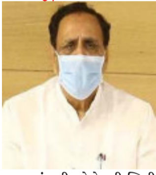
આયોજન થઈ રહ્યું છે. કેન્દ્ર સરકાર નક્કી કરશે તે મુજબ આગળ વધીશુ. હાલ ઉત્પાદન જ તબક્કામાં રસીનું વિતરણ થશે. જેમા ફટ લાઈન વોરિયર્સને પ્રથમ વેક્સીન અપાશે. તે બાદ બીજા તબક્કામાં કોરોના વોરિયર્સ સફાઈ કમદાર રેવન્યુ સ્ટાફ અને પોલીસને અપાશે. ત્રીજા તબક્કામાં ૫૦ વર્ષથી વધુના લોકોને અપાશે, ચોથા તબક્કામાં ૫૦ વર્ષથી નીચેના અને જે કોમોરબીડ હોય તેમને અપાશે. ઉલ્લેખનીય છે કે ગઈ કાલે લોકડાઉન અંગે DYCM નીતિન

વધારે મજબૂત થતી ગઈ, તેના પછી અમને ઘણું શીખવા મળ્યું છે. વડાપ્રધાને જણાવ્યું હતું કે દરેક નાગરિકે બંધારણને સમજવું જોઈએ. વડાપ્રધાને જણાવ્યું હતું કે કોરોના કાળમાં દેશના લોકોને બંધારણ પર વિશ્વાસ હોવાની વાતનું સમર્થન કર્યું છે. સંસદમાં આ વખત નિયત