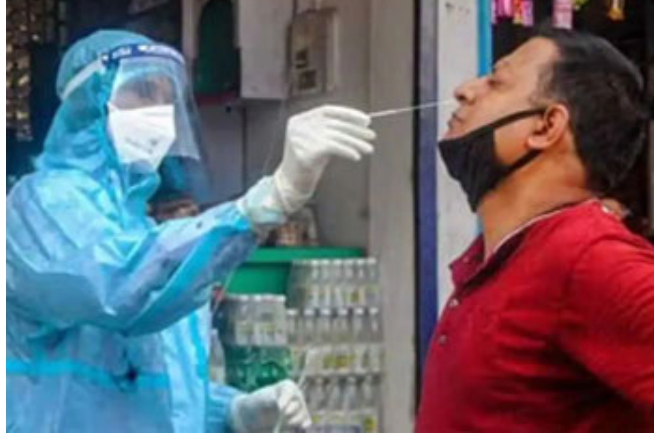
દેશભરમાં કોરોનાથી કુલ ૧ લાખ ૨૪ હજાર ૩૧૫ લોકોના મોત થયા છે. દેશમાં કોરોનાનો રિકવરી

અસરકારક અને સુરક્ષિત હોવી જરૂરી છે. કોવિશીલ્ડ વેક્સિનને લઈને કોઈ જ ચિંતાજનક વાત નથી. ભારતમાં હજારો લોકોને તેના ડોઝ આપવામાં આવી ચૂક્યા છે. જોકે વેક્સિનની લાંબાગાળાની અસરો તપાસવામાં હજી ૨ થી ૩ વર્ષ લાગી શકે છે. સીરમ ઇન્સ્ટિટ્યૂટના સીઈઓના જણાવ્યા પ્રમાણે, કોવિશીલ્ડ વેક્સિન કેટલા સમયમાં મળશે તેને લઈને સરકાર સાથે તેમની વાતચીત ચાલી રહી છે. સાથો સાથ એ પણ સુનિશ્ચિત કરવામાં આવી રહ્યું છે કે, લોકોને આ વેક્સિન પોસાય તેવા ભાવે પુરી પાડવામાં આવે. જોકે અમે પણ એ વાતને લઈને નિશ્ચિત છીએ કે, આ વેક્સિન બધાને જ પરવડશે તેવી હશે.