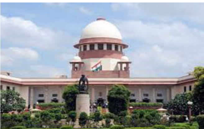
સુપ્રીમ કોર્ટના ન્યાયાધીશો અને ન્યાયાધિકારીઓનો આવા આદમી માટે કાયદા ઘડવાનો અધિકાર મળી શકે નહીં.