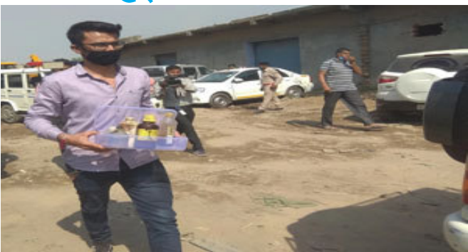
અમદાવાદ, શહેરના પીરાણા પીપળજ રોડ પર કેમિકલ ગોડાઉનમાં સર્જાયેલ અગ્નિકાંડની ઘટનામાં બીજા દિવસે પણ તપાસનો ધમધમાટ ચાલુ રહ્યો.

અમદાવાદ, શહેરના પીરાણા પીપળજ રોડ પર કેમિકલ ગોડાઉનમાં સર્જાયેલ અગ્નિકાંડની ઘટનામાં બીજા દિવસે પણ તપાસનો ધમધમાટ ચાલુ રહ્યો. પોલીસે એફએસએલના અધિકારીઓને સાથે રાખીને ૫ કલાક સુધી તપાસ કરી હતી.