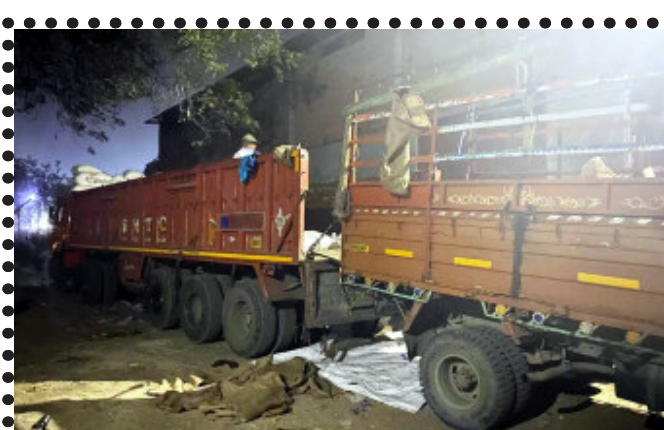
ગોધરા, ગોધરા શહેર કોઠી સ્ટીલની સામે આવેલ પટેલ કંપાઉન્ડમાં ખુદી જગ્યામાં ત્રણ વાહનો શંકાસ્પદ અનાજનો જથ્થો પલટાવી રહ્યા છે. તેવી બાતમીના આધારે બી ડીવીઝન પોલીસે રેડ કરી ૫૦ કિલોની બોરીઓ નંગ-૪૧૪ મળી કુલ કિંમત ૪૧,૪૦૦ રૂપિયા તથા ત્રણ વાહનો મળી ૩૧,૪૬,૫૦૦/- રૂપિયાના મુદ્દામાલ સાથે આઠ ઈસમોએ આચ્છા. આ બાબતે બી ડીવીઝન પોલીસ મથકે ફરિયાદ નોંધાવા પામી છે.