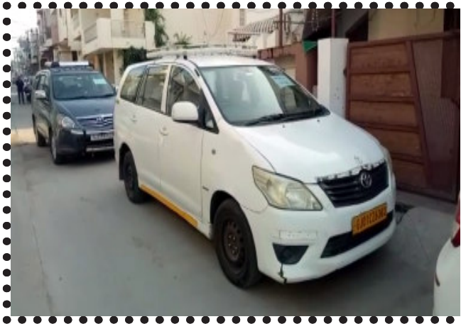
કરાચેલા કેન્દ્ર સરકારના ઈન્કમેટેક્સ તથા અન્ય વેરા ભરવામાં ભારે ઉદાસીનતા સેવાઈ રહી છે. એટલું જ નહિ આવક છુપાવા માટે નિતનવા નિયમોની આંટીઘૂંટી અનુસરીને આવક ભરવા બચવાના પ્રયત્નો કરે છે. અંતે આવક કરતાં ઓછો કર ભરીને કર ચોરી કરાઈ રહી છે. કર ચોરી ઓછી ભરીને સરકારની તિજોરીને નુકશાન પહોંચાડવાની સાથે એક જવાબદાર નાગરિક તરીકેની અદામાં ચૂક કરી રહ્યાનું જાણવા મળે છે. છેલ્લા કેટલાક સમયથી આ પોતાના ઘંઘા વેપારમાં માંધાંતા બનેલા આ વેપારીઓ કરચોરી કરી રહ્યા હોવાની બાતમી ઈન્કમેટેક્સ વિભાગને પ્રાપ્ત થઈ હતી. જેના આધારે વડોદરા સર્કલ વિભાગની ૧૫ જેટલી પસંદગીના અધિકારીઓની ટીમ બનીને ગોધરા તથા વેજલપુર વિસ્તારના આ લક્ષ્યાંક ધરાવતા વેપારીઓના પેઢી તથા ઘરે વહેલી સવારે દરોડો પાડ્યો હતો. હજુ તો સૂર્યનારાયણના દર્શન નહીં થઈને

ગોધરા, ગુરુવારે એકાએક વહેલી સવારે ૪ કલાકે ગોધરા તથા વેજલપુરના ૨૦ વેપારીઓને ત્યાં ઈન્કમેટેક્સ વિભાગની ૧૫ જેટલી ટીમ ત્રાટકી હતી. મોડી સાંજ સુધી હાથ ધરાયેલ સર્વેમાં બેનામી સંપત્તિ શોધીને કાયદાકીય સંક્રાંતિ લેવાની તૈયારીઓ હાથ ધરવામાં આવતા વેપારીઓમાં દોડધામ સાથે ફફડાટની લાગણી વ્યાપી ગઈ છે. મોડી રાત સુધી સર્વે ચાલતા હજુ બેહિસાબી સ્પષ્ટ આંકડો બહાર આવ્યો નથી. ત્યારે સંભવતઃ ચોંકાવનારો હશે.