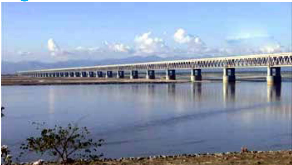
તિબેટ સ્વાયત્ત રાજ્ય દ્વારા દેશની સરહદમાં વિસ્તારમાંથી નીકળતી બ્રહ્મપુત્ર નદી ભારતના અરુણાચલ પ્રદેશ ત્યારબાદ આ નદી અસમ પહોંચે છે ત્યારે તેને બ્રહ્મપુત્ર કહેવામાં આવે છે. અસમથી થઈને

બ્રહ્મપુત્ર બાંગ્લાદેશમાં પ્રવેશ કરે છે. બ્રહ્મપુત્રને ભારતના પૂર્વોત્તર રાજ્યો અને બાંગ્લાદેશની જીવનદોરી માનવામાં આવે છે અને લાખો લોકોની આજીવિકા તેના પર નિર્ભર છે. ચીનના સરકારી અખબાર ગ્લોબલ ટાઈમ્સે સંકેત આપ્યા છે કે આ કેમ તિબેટના મેડોગ કાઉન્ટીમાં બનાવી શકે છે જે ભારતના અરુણાચલ પ્રદેશની સરહદની ખૂબ જ નજીક છે. ચીન પહેલાં જ બ્રહ્મપુત્ર નદી પર અનેક નાના નાના કેમ બનાવી ચૂક્યું છે. જો કે નવા કેમના આકારમાં મહાકાય થવા જઈ રહ્યો છે. આ નવો કેમ મોટો હશે કે ચીનમાં બનેલા બીજા દુનિયાના સૌથી મોટા કેમ થી જોઈને સરખામણીએ આ ત્રણ ગણી ઊંચાઈ પાવર પેદા કરી શકે છે. કહેવાય છે કે આ નવા કેમને ચીનની નેશનલ સિક્યોરિટીને ધ્યાનમાં રાખીને બનાવવામાં આવી રહ્યો છે. ચીનના પાવર કંસ્ટ્રક્શન કોર્પોરેશનના ચેરમેન અને પાર્ટીના સેક્રેટરી યાન ઝિયોંગ એ કહ્યું કે તાજી પંચવર્ષીય યોજનાની અંતર્ગત આ કેમને બાંધવામાં આવશે. આ યોજના ૨૦૨૨ સુધી ચાલશે. તેમણે કહ્યું કે અત્યાર સુધીના ઇતિહાસમાં પહેલા આવી