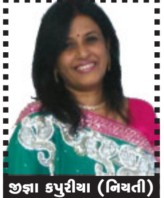
જ્ઞા કપુરીયા (નિયતી)

જરા વિચારી જોજો કે રામને સાથ આપવાં કેકેચીએ પોતાને કલંકિત કરી નાંખી અને કલંક પણ કેવું? પતિહત્યાનો દોષ એને લાગ્યો અને ત્યાં સુધી કે એનો પુત્ર ભરત પણ એનું મોઢું ફેરવી લીધું ત્યારે આ માતાની હાલત કેવી થઈ હશે? આ માતાએ કેટલી હદે લોકોનો તિરસ્કારનો સામનો કર્યો હશે? એક જ રાતનાં એવું તે શું થઈ ગયું? રાત સુધી તો કેકેચી રાજ્યાભિષેકની તૈયારી ચાલતી હતી ત્યારે પ્રભુરામ માતાકેકેચીને રાતનાં મળવાં ગયાં હતાં અને એમણે પોતાનો અવતારકાર્ય પૂર્ણ કરવાં માતા કેકેચીની મદદ માંગી હતી કારણ માનવકલ્યાણ માટે એમને દાનવરાજ રાવણનો સંહાર કરવો હતો. માતા કેકેચી તો નિમિત્ત