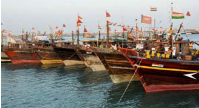
અમદાવાદ, પાકિસ્તાન મરીન સિક્યોરિટીએ તેની અવળચંડાઈ જારી રાખી છે. તેણે ભારતના અને તેમા પણ ખાસ કરીને ગુજરાતના ૧૮ માછીમારોનું અપહરણ કર્યું છે. તેમા પોરબંદરની બે અને ઓખાની એક બોટ હતી. બંને બોટમાં થઈને કુલ ૧૮ માછીમારો હતો. તેઓ રાખેતા મુજબ જ દરિયો ખેડવા નીકળ્યા હતા અને પાકિસ્તાન મરીન સિક્યોરિટીએ તેમને ચેતવણી આપવાના બદલે તેમનું અપહરણ કર્યું છે.

વટાવી દે છે, પરંતુ તેમનો કંઈ બીજા દેશની સરહદમાં ઘૂસવાનો ઇરાદો હોતો નથી. ભારતીય લશ્કરને સરહદ પર જવાબ આપવામાં નિષ્ફળ ગયા પછી પાકિસ્તાની લશ્કર આ પ્રકારની હીન હરકતો કરીને આત્મસંતોષ મનાવે છે. તે નાગરિકોને હેરાન કરે છે અને પછી આ પકડેલા નાગરિકોને વાટાઘાટ માટેનું શસ્ત્ર બનાવે છે. પાકિસ્તાનની જેલમાં ભારતના આવા કેટલાય નિર્દોષ માછીમારો છે.