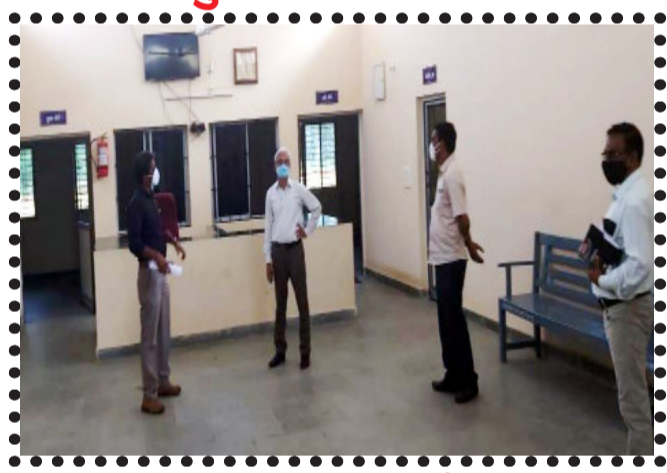
જિલ્લા કલેક્ટર આર. બી. બારડે ખાનપુર તાલુકાના પાંડરવાડા પ્રાથમિક આરોગ્ય કેન્દ્રની મુલાકાત લીધી હતી.

જિલ્લા કલેક્ટર આર. બી. બારડે તેમની આ મુલાકાત દરમિયાન પ્રાથમિક આરોગ્ય કેન્દ્રનું નિરીક્ષણ કરી કેન્દ્રના તબીબ સાથે કેન્દ્રના આધુનિકરણ તથા જરૂરી સાધન-સામગ્રી બાબતે ચર્ચા કરી હતી.