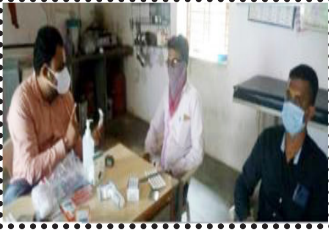
આરોગ્યની ટીમ દ્વારા નાગરિકોની રોગપ્રતિકારક શક્તિમાં વધારો થાય તે માટે હોમિયોપેથિક આર્સેનિક આલ્બમની ગોળીઓનું વિતરણ કરવામાં આવ્યું હતું તેમજ પાંચ બ્લોક સેમ્પલની સ્લાઈડ અને ત્રણ સ્પુટમ સેમ્પલ લેવામાં આવ્યા હતા. આમ, જિલ્લાના આરોગ્ય તંત્રના તમામ આરોગ્ય કર્મીઓ જિલ્લામાં કોરોનાના સંક્રમણને ફેલાવવા માટે અવિરતપણે તેઓની ફરજો અદા કરવાની સાથે તમામને હું માસ્ક પહેચાવવા વિના ઘરની બહાર નહીં નીકળવું, દરેકથી ઓછામાં ઓછું ૬ ફૂટનું અંતર જાળવીશ, વારંવાર સાબુથી હાથ ધોઈશ કે સેનેટાઈઝરનો ઉપયોગ કરવો રહીશ, મારી તથા મારા