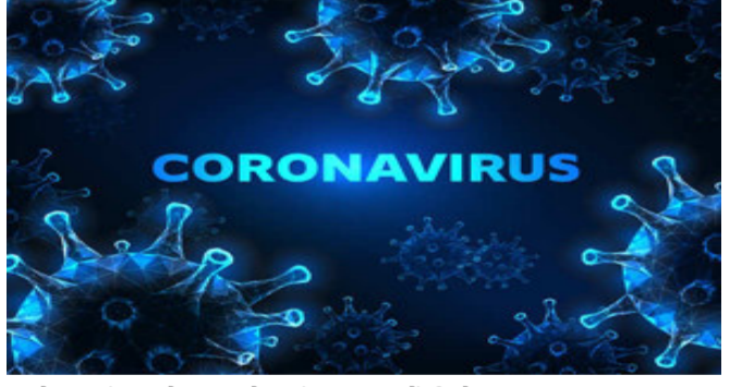
આવેલા આંકડાઓ મુજબ દેશમાં કુલ સંક્રમિતોની સંખ્યા ૭૫,૫૦,૨૭૩ પહોંચી છે. આ ઉપરાંત, ભારતમાં

ન્યુ દિલ્હી, ભારતમાં કોરોના સંક્રમણના ફેલવામાં સતત ઘટાડો આવી રહ્યો છે. છેલ્લા ૨૪ કલાકમાં ૫૫,૭૨૨ નવા પોઝિટિવ કેસો નોંધાયા છે. આ ઉપરાંત કોવિડ-૧૯ના કારણે ૫૭૯ દર્દીઓએ પોતાના જીવ ગુમાવ્યા છે. દેશમાં કુલ સંક્રમિતોનો આંક ૭૫ લાખને પાર થઈ ચૂક્યો છે. તો અત્યાર સુધીમાં ૧.૧૪ લાખ લોકોએ કોવિડ-૧૯ સામે લડતાં જીવ ગુમાવ્યો છે. કેન્દ્રીય આરોગ્ય વિભાગ દ્વારા જાહેર કરવામાં