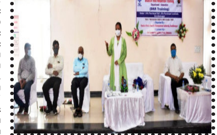
મેનેજમેન્ટ તાલીમ કાર્યક્રમની શરૂઆત કરવામાં આવી હતી. પ્રથમ દિવસની તાલીમમાં શિક્ષણ વિભાગના અધિકારીઓ/કર્મચારીઓ ને આપતિ વ્યવસ્થાપનમાં રાખવાની તકેદારી અંગેની તાલીમ આપવામાં આવી હતી. જેમાં શાળાઓમાં આપતિ અંગેની

લુણાવાડા, ગુજરાત સ્ટેટ કિઝાર્ટર મેનેજમેન્ટ ઓથોરીટી (GSDMA) ગાંધીનગર, મહિસાગર જિલ્લા કલેક્ટર કચેરી તથા જિલ્લા પંચાયત મહિસાગર અને બ્રહ્મ સમાજ સેવા ટ્રસ્ટ મહેસાણા સંયુક્ત ઉપક્રમે મહિસાગર જિલ્લાના વિવિધ વિભાગ જેવા કે પંચાયતી રાજ, શિક્ષણ, શહેરી અને ગ્રામ વિકાસ તથા આરોગ્ય વિભાગના અધિકારીઓ/કર્મચારીઓ માટે કિઝાર્ટર મેનેજમેન્ટ અંગેની ૦૨ દિવસની અલગ - અલગ વિભાગની તાલીમ કાર્યક્રમનું આયોજન કરવામાં આવેલ છે. જે અંતર્ગત શરૂ થતા તાલીમ કાર્યક્રમનો સવારે ૧૦:૩૦ કલાકે