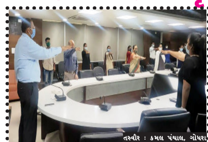
તસ્વીર : કમલ ચંચાલ, ગોધરા

ગોધરા, કોવિડ સંક્રમણના પ્રસારને રોકવા જનસામાન્યમાં મોટાપાયે જાગૃતિ પ્રસારવા સરકાર દ્વારા આરંભાયેલ જન આંદોલન અંતર્ગત પંચમહાલ જિલ્લા સેવાસદન ખાતે જિલ્લા કલેક્ટર અમિત અરોરાના અધ્યક્ષસ્થાને કલેક્ટર કચેરીના કર્મચારીઓ અને કર્મચોગીઓ દ્વારા કોવિડ સંક્રમણના બચાવ સંબંધિત તકેદારીઓનું ચુસ્ત પાલન કરવાના અને કોવિડ જનજાગૃતિના શપથ લીધા હતા. કલેક્ટર અમિત અરોરાના નેતૃત્વમાં સૌ અધિકારીઓ- કર્મચારીઓએ કોરોના મહામારીના ફેલાવાને રોકવા અંગે લોકોમાં જાગૃતિ આવે તે માટે પ્રયાસો કરવા, માસ્ક પહેર્યા વિના ઘરની બહાર નહીં નીકળવા, દરેકથી ઓછામાં ઓછું ૬ ફૂટ નું અંતર જાળવવા, વારંવાર સાબુથી હાથ ધોવા કે સેનેટાઈઝ કરતા રહેવા, પોતાની તથા સ્વજનોની