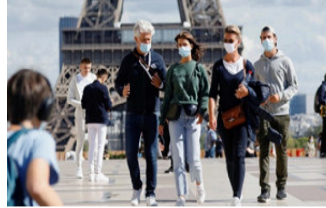
લોકડાઉન બાદ ભારત હવે અનલોક થઈ રહ્યું છે, પરંતુ અહીં પણ દૈનિક સ્તરે સંક્રમણના કેસોમાં ઉછાળો નોંધાયો છે.

બર્લિન, દુનિયાભરના દેશોમાં ફેલાઈ ચૂકેલી કોરોના મહામારી હવે તેનું ભયાનક રુપ બતાવી રહી છે. જે આખી દુનિયા માટે ભારે ચિંતા ઉભી કરશે, કારણકે કોરોના મહામારી સામે હથિયાર મૂકી દીધેલા યુરોપના કેટલાક દેશોમાં કોરોના વાયરસની સેકન્ડ વેવ શરૂ થઈ હોવાના સંકેત મળ્યા છે. જે પહેલા કરતા પણ ભયાનક હોવાની આશંકા છે. આ જ કારણથી યુરોપના કેટલાક દેશોમાં લોકડાઉન લાગૂ કરાયું છે અને ફ્રાન્સમાં કરફ્યુની સ્થિતિ ઉભી થઈ છે. જોકે