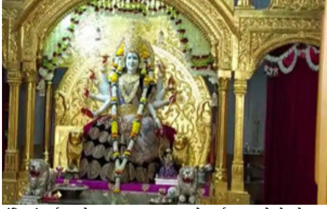
મંદિરમાં દર્શન રાખેતા મુજબ ચાલુ રહેશે. કોરોનાના પગલે અંબાજી દર્શન માટે પધારતા ભક્તોના આરોગ્યની સલામતી પર વિશેષ ભાર મુકતા અંબાજી મંદિર ટ્રસ્ટ દ્વારા રાજ્ય સરકારની કોવિડ ૧૯ અંગેની માર્ગદર્શિકા મુજબની તમામ સુવિધા અને વ્યવસ્થા મંદિર પરિસર અને મૂળ સ્થાન શક્તિપીઠ ગબ્બર પર્વતે કરવામાં આવી છે. આ ઉપરાંત નવરાત્રિ દરમિયાન માતાજીના

રહેશે. આ ઉપરાંત સોશિયલ ડિસ્ટન્સ સાથે સેનિટાઈઝ અને સ્કિનિંગ થયા બાદ જ મંદિરમાં પ્રવેશ આપવામાં આવશે.