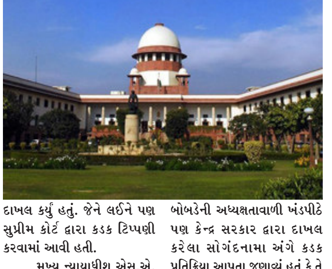
દાખલ કર્યું હતું. જેને લઈને પણ સુપ્રીમ કોર્ટ દ્વારા કડક ટિપ્પણી કરવામાં આવી હતી.

ન્યુ દિલ્હી, તબલીગી જમાતને લગતી અરજીઓ પર સુનાવણી કરતાં સુપ્રીમ કોર્ટે કહ્યું છે કે હાલના સમયમાં અભિવ્યક્તિની સ્વતંત્રતાનો સૌથી વધુ દુરુપયોગ કરવામાં આવ્યો છે. આ અરજીઓએ દીવી ચેનલો સામે તબલીગી જમાત વિરુદ્ધ બનાવટી સમાચાર પ્રસારિત કરવા અને નિઝામુદ્દીન મરકઝ ઘટનાને સાંપ્રદાયિક રૂપ આપવાનો આરોપ લગાવતા કાર્યવાહી કરવાની માંગ કરી છે.