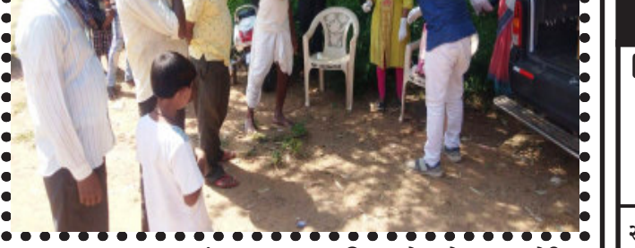
સંતરામપુર, પ્રાથમિક આરોગ્ય કેન્દ્ર દ્વારા મેડિકલ ઓફિસરને સ્ટાફ ઓષધિ આયુર્વેદિક નો ઉકાળો અને હેમિયોપેથીક દવાનું વિતરણ કરવામાં આવેલું હતું. સાથે સાથે કોરોના વિશે સુચના અને માર્ગદર્શન પણ આપવામાં આવેલું સંક્રમણથી બચવા માટે સોશિયલ ડિસ્ટન્સ નું પાલન કરવું મસક અવશ્ય પહેરવું વારંવાર સાબુથી હાથ ધોવા આરોગ્ય વિભાગ દ્વારા સંપૂર્ણ માર્ગદર્શન પુરૂ પાડવામાં આવ્યું હતું.

અરજદાર તરફથી હાજર રહેલા વરિષ્ઠ વકીલ દુયંત દવેએ કહ્યું કે સરકારે કહ્યું છે કે આમાં અભિવ્યક્તિની સ્વતંત્રતા શામેલ છે. આ તરફ મુખ્ય ન્યાયમૂર્તિએ કહ્યું હતું કે, ભાષણની સ્વતંત્રતા એ હાલના સમયમાં સૌથી વધુ દુરુપયોગ કરવામાં આવે છે. જમિઆત ઉલેમા-એ-હિન્દ, પીસ હાલી, મસ્જિદ મદારીઝની રીજે પર્લ્ટી ફેડરેશન, વર્ક સંસ્થા અને અબ્દુલ કુદસ લરકરે દાખલ કરેલી અરજીઓમાં આશો પ કરવામાં આવ્યો છે કે મીડિયા રિપોર્ટિંગ એકતરફી છે અને મુસ્લિમ સમુદાયને ખોટી રીતે રજૂ કરે છે.