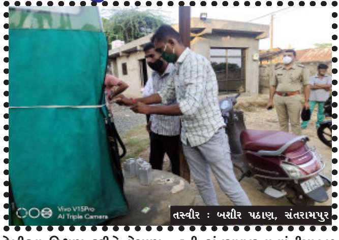
તસ્વીર : બશીર પઠાણ, સંતરામપુર

સંતરામપુર, સંતરામપુર તાલુકાના વાંઝીયા ખુટ ગામે પરમીશન વગર ચાલતા બાયોડીઝલ પંપ ઉપર પુરવઠા વિભાગે તપાસ કરી સેમ્પલ લેવામાં આવ્યા હતા તેમજ પરમીશન વગર ચાલતા બાયોડીઝલ પંપને સીલ કરવામાં આવ્યો.