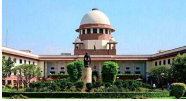
કલાક દીઠ અથવા ફીક્સ દરે મહેનતાણું ચુકવવા તાકીદ કરી છે. સુપ્રીમ કોર્ટની જસ્ટિસ ડી વાય ચંદ્રયુડની આગેવાની હેઠળની ખંડપીઠે જણાવ્યું હતું કે,

આંતરિક કટોકટી કહી આ રીતે વગર મહેનતાણે કામ કરાવવું યોગ્ય નથી. દરેક કાયદાનું પાલન થવું જ જોઈએ. તેમણે ઉમેર્યું કે મહામારીમાં અર્થતંત્રમાં આવેલી મંદીનો આખો ભાર એકલા કામદારો પર મૂકી ન શકાય. જિલ્લા સી વાય ચંદ્રયુડની આગેવાની વાળી સુપ્રીમ કોર્ટની બંધને રોગચાળો કહેવાશે નહીં કે રાષ્ટ્રની સુરક્ષાને ધમકી આપતી આંતરિક કટોકટી કહી શકાશે અને તેથી કાયદાની આવશ્યકતાઓને દૂર કરવા માટેનું એક કારણ. સુપ્રીમ કોર્ટનો ચુકાદાને ઉલ્લેખનીય છે કે આ પ્લેનમાં ૧૪ મુસાફરો બેસી શકે તેટલી ક્ષમતા છે. નોંધવું છે કે સ્પાર્ટ્સ જેટ દ્વારા સંચાલિત થનાર આ ફ્લાઈટમાં ૨ વિદેશી પાઈલટ અને ૨ ક્રૂ મેમ્બર હશે જે હ મહિના સુધી રોકાણ કરશે અને ભારતીય પાઈલટ તેમજ ક્રૂ મેમ્બરને સી-પ્લેન ઓપરેટ કરવાની તાલીમ આપશે. ૩૧ ઓક્ટોબરના રોજ સાબરમતી રિવરફ્રન્ટ પરથી સી-પ્લેન ઉડાન ભરશે પ સી-પ્લેન મારફતે સાબરમતીથી સ્ટેચ્યુ ઓફ યુનિટી સુધીનું ૨૨૦ કિમીનું અંતર માત્ર ૪૫ મિનિટમાં કપાશે.