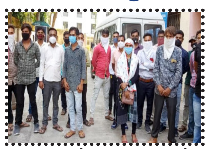
ગોધરા, બજાવતા ૪૬૦ જેટલા ઓપરેટરોએ તેમની વર્ષો જુની આપેલ ગ્રામપંચાયતોમાં વિલેજ કોમ્પ્યુટર ઓપરેટર તરીકે ફરજ