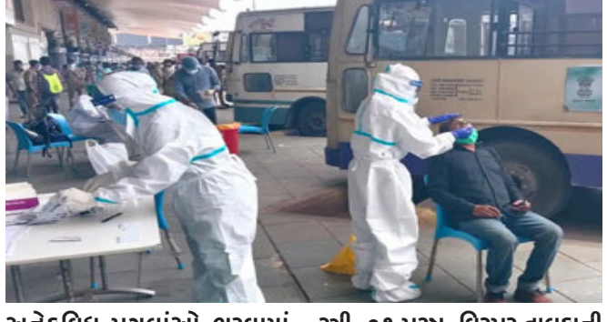
અનેકવિધ પગલાંઓ ભરવામાં આવી રહ્યા છે. મહિસાગર જિલ્લામાં આજે બાલાસિનોર તાલુકાના ૦૩ પુરૂષ, લુણાવાડા તાલુકાના ૦૪ પુરૂષ, સંતરામપુર તાલુકાની ૦૨ સ્ત્રી, ૦૧ પુરૂષ, વિરપુર તાલુકાની ૦૧ સ્ત્રી, ૦૧ પુરૂષનો કોરોના રીપોર્ટ પોઝીટીવ આવ્યો છે. આમ, જિલ્લામાં કોરોના (COVID 19)ના અત્યાર સુધીમાં એટલે કે તારીખ ૦૧-૧૦-૨૦૨૦ ના સાંજના ૫-૦૦ વાગ્યા સુધીમાં ૧૦૭૭ કેસ પોઝીટીવ નોંધાયા છે.