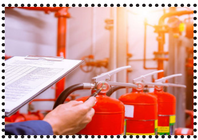
રાજ્ય સરકાર આ હેતુસર પ્રાઈવેટ યુવા ઈજનેરોને જરૂરી તાલીમ બાદ ફાયર સેફ્ટી

ગાંધીનગર, રાજ્યમાં ફાયર સેફ્ટીના કડક અમલથી લોકોના જાન-માલ-મિલકતને આગથી સંરક્ષણ આપવા માટે ગુજરાત સરકાર દ્વારા મહત્વની જાહેરાત કરાઈ છે. આ જાહેરાત મુજબ, રાજ્યમાં દરેક હાઈરાઈઝ બિલ્ડિંગ, ઉંચા મકાનો, વાણિજ્યિક સંકુલ, સ્કૂલ, કોલેજ-હોસ્પિટલ્સ, ઔદ્યોગિક એકમો માટે ફાયર સેફ્ટી એન.ઓ.સી. મેળવવાનું અને દર છ મહિને તેનું રિન્યુઅલ ફરજિયાત કરવામાં આવ્યું છે.